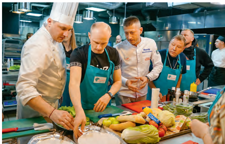
Первый день саммита завершился гастрономическим баттлом «Вкус Сибири».