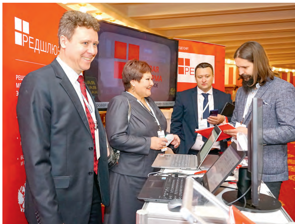
Участники выставки продуктов импортонезависимости.