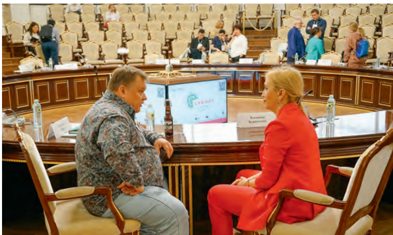
У участников саммита и в перерывах было немало общих тем для разговора.