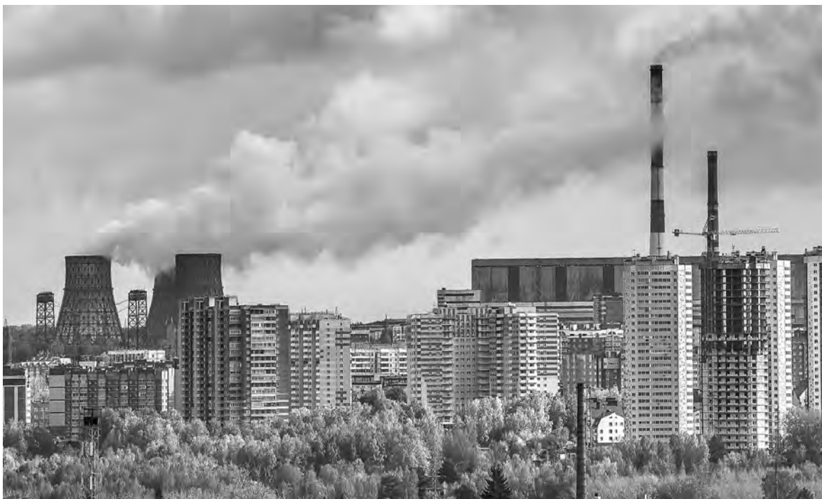
В XXI веке человечеству надо найти способ полностью прекратить выбросы углекислого газа в атмосферу, предупреждают новосибирские учёные.

22 мая 2001 года ряд стран приняли Стокгольмскую конвенцию для контроля обращения с СОЗ, сейчас к ней присоединились уже 185 стран, в том числе Россия. В Новосибирске на базе Института органической химии СО РАН действует национальный центр по Стокгольмской конвенции, в