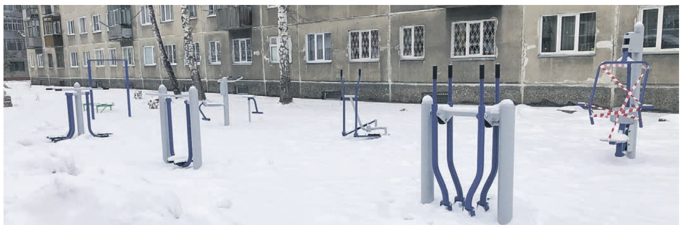
Новые тренажёры на ул. Ипподромская, 25.