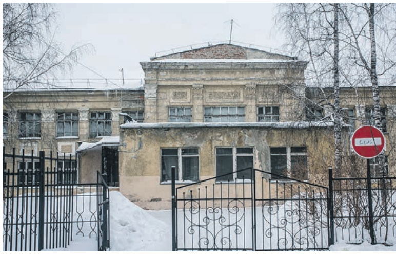
Так выглядела школа до сноса.

Депутаты-коммунисты давно требуют решить проблему с реконструкцией здания школы. Так, наказ Сергею Кальченко