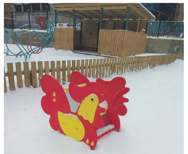
Детский сад №495. Благодаря помощи депутата во дворе детского сада появились детские качели в форме животных: дельфинёнка, петушка и лягушонка. В декабре поступят стулья для музыкального зала.