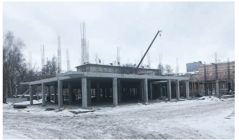
Сейчас на месте снесённого здания ведётся строительство цокольного этажа новой современной школы.

В марте 2021 года были внесены соответствующие поправки в областной бюджет, и в этом же году на реконструкцию школы выделили 50 миллионов рублей.