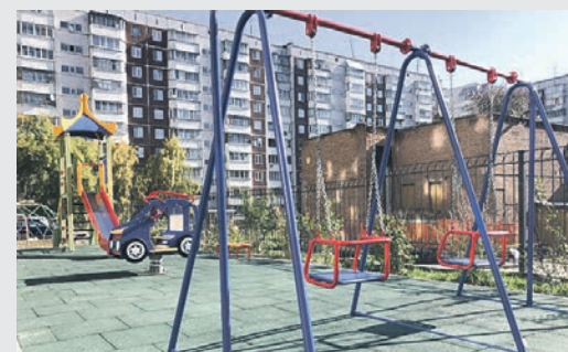
Детская площадка на ул. Депутатская, 58

Обустройство дворов. По наказам были благоустроены дворы по адресам: ул. Депутатская, 58, ул. Октябрьская, 33, ул. Ипподромская, 25. Установлены качели, детский городок, вазоны и тренажёры.