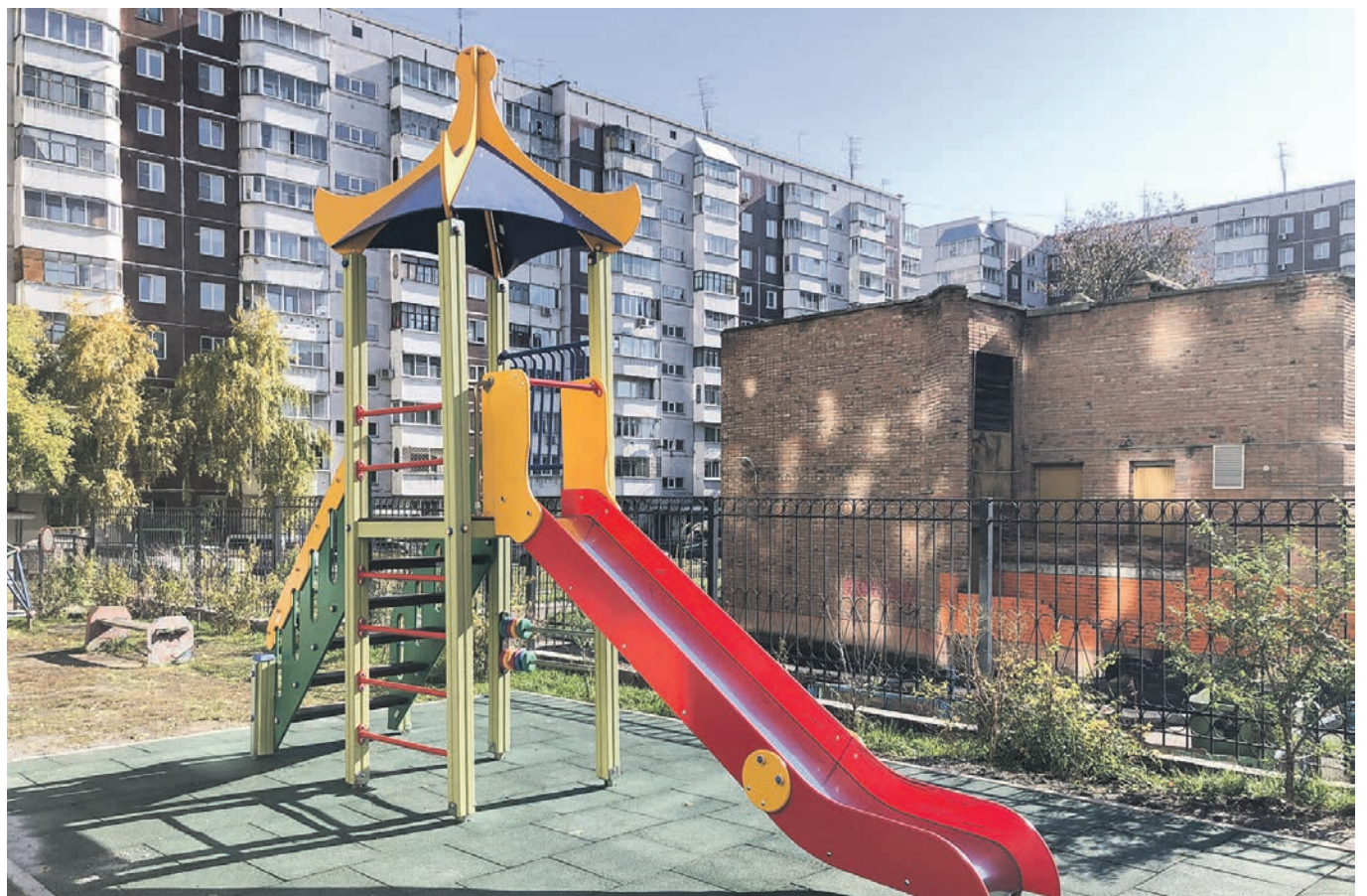
Детский городок на улице Депутатская, 58.

Где: Новосибирск, ул. Вокзальная магистраль, 2. Когда: последняя пятница месяца, с 14:00 до 17:00, по предварительной записи. Как записаться: 203-47-61.