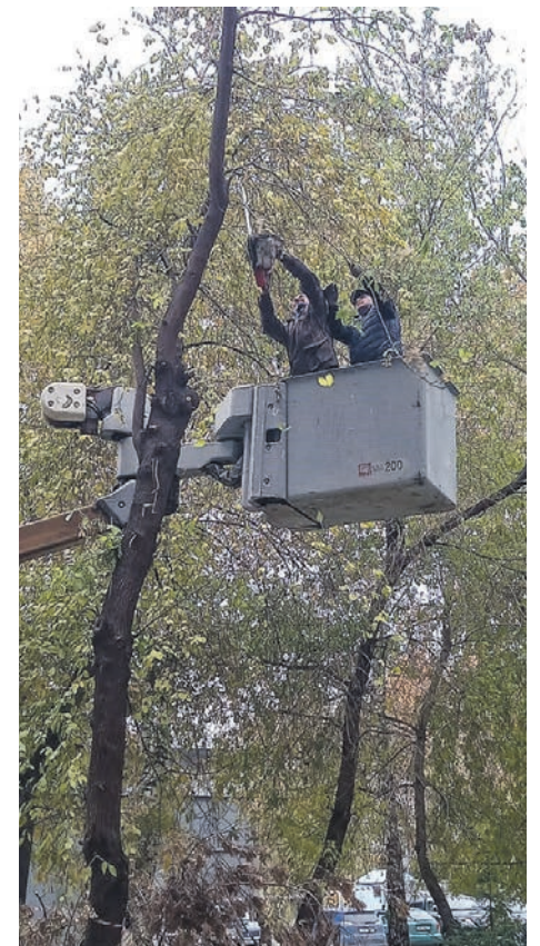
Обрезка деревьев на ул. Мичурина, 19.