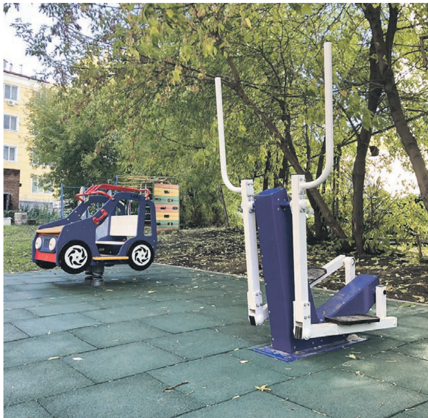
Благоустройство на ул. Октябрьская, 33.