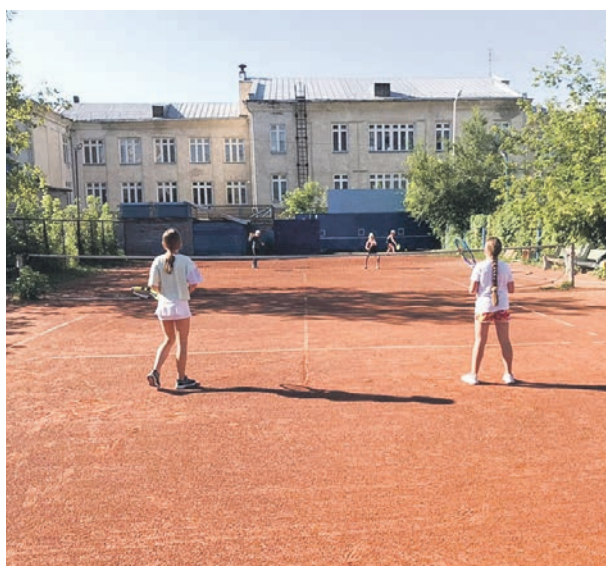
Школа №29. Было установлено освещение и уложено покрытие на теннисном корте. Также здесь обустраивают ветрозащитный фон.