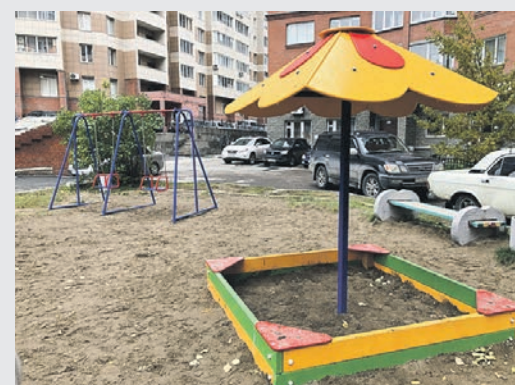
Благоустройство на ул. Семьи Шамшиных, 4.

Кроме того, после обращения жителей во дворе дома №4 по улице Семьи Шамшиных появились песочница, качели и тренажёр.