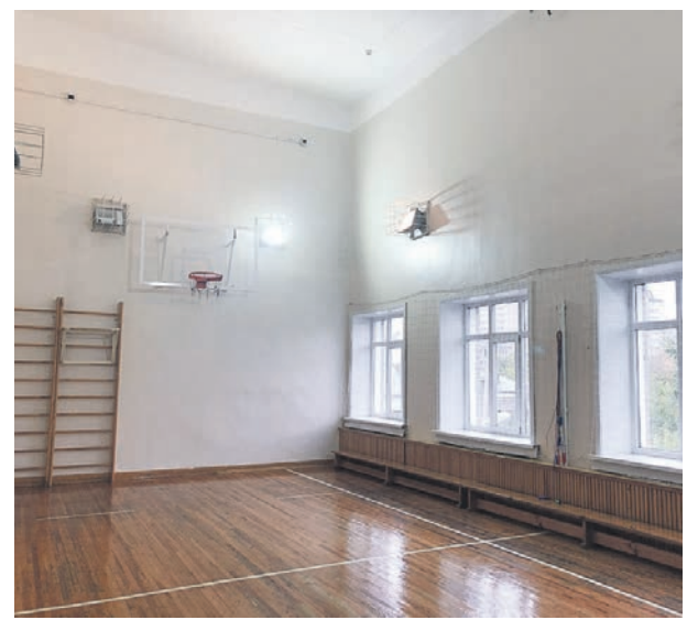
Гимназия №1. На средства депутатского фонда был отремонтирован малый спортивный зал – обновлена штукатурка и установлены новые подоконники.