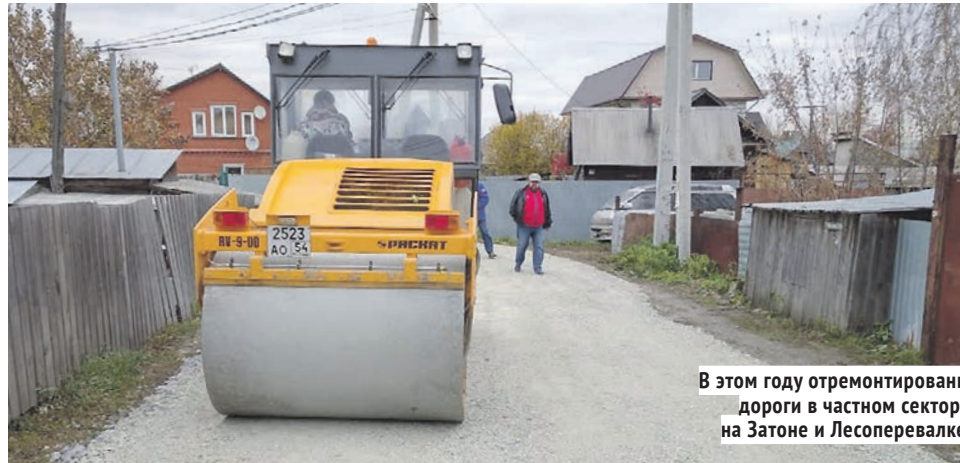
В этом году отремонтированы дороги в частном секторе на Затоне и Лесоперевалке.

— Я это вижу по нашей отрасли: мы строим, а людям всё сложнее приобретать квартиры — процентные ставки на ипотеку далеко не на том уровне, который можно считать приемлемым. На федеральном уровне предпринимаются попытки исправить ситуацию, но и региональное законодательство не должно отставать, какой бы сложной ни была ситуация. Я много говорю о мультипликативном эффекте, автором этой идеи является британский экономист Джон Мейнард Кейнс. Строительство остаётся одним из самых мощных и быстрых локомотивов экономики. Один строитель создаёт 15–20 рабочих мест в смежных отраслях, три четверти своих инвестиций мы отдаём им, закупая материалы, оборудование, технологии. Стало быть, и там