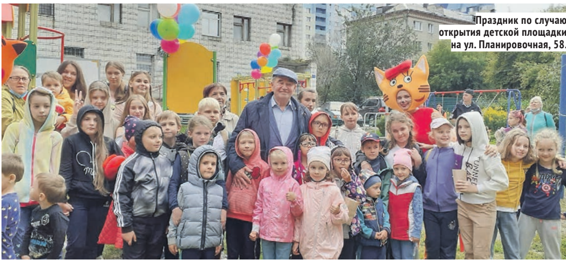
Праздник по случаю открытия детской площадки на ул. Планировочная, 58.