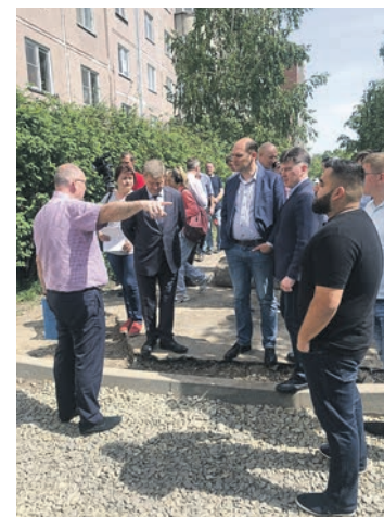
Проверка хода работ по благоустройству у дома №3 по улице Толстого.