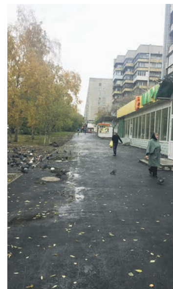
Тротуар у дома №66 по улице Никитина, отремонтированный по наказам избирателей.