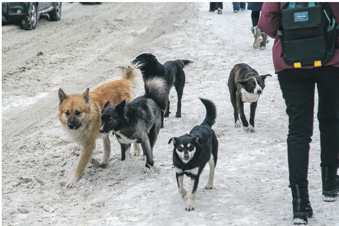
О безнадзорных животных нужно сообщать по телефону 112.