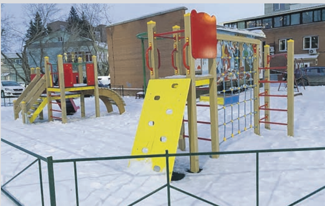
Детский городок у дома №26/1 по улице Восход установлен по наказам избирателей.