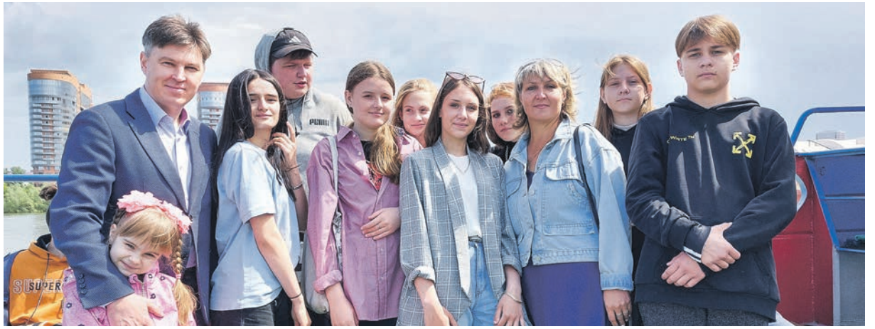
Школьники получили удовольствие от прогулки и смогли пообщаться с депутатом.

В День защиты детей школьники Октябрьского района традиционно уже в течение семи лет получают необычный подарок от депутатов — прогулку на теплоходе.