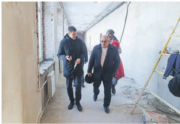
Депутат знакомится с ходом реконструкции школы в Безменово.

Реконструкция 5-километрового участка водовода началась