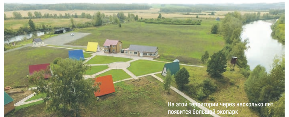
На этой территории через несколько лет появится большой экопарк

Кроме того, депутат активно поддерживает волонтерское движение, активисты которого проявляют постоянную заботу об инвалидах. ●