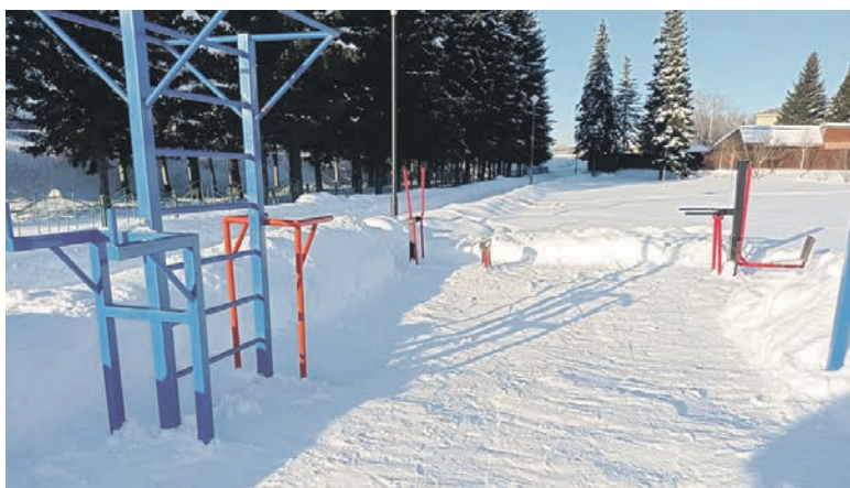
Волонтеры и помощники депутата регулярно чистят от снега детские и спортивные площадки, помогают пожилым людям.