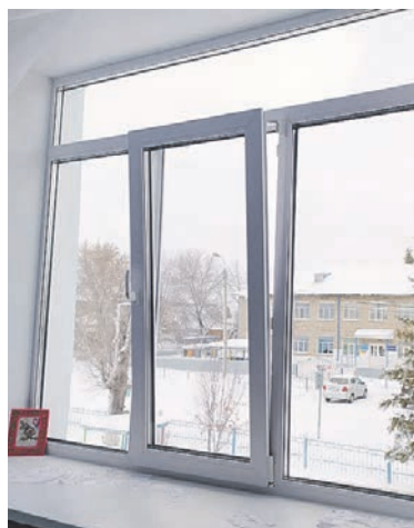
В Черепановском детском саду «Светлячок» депутат помог установить 16 новых окон.

Конечно, круг вопросов, с которыми обращаются люди, гораздо шире. И я стараюсь прислушиваться ко всем просьбам. Например, мной были выделены деньги на приобретение в Маслянино