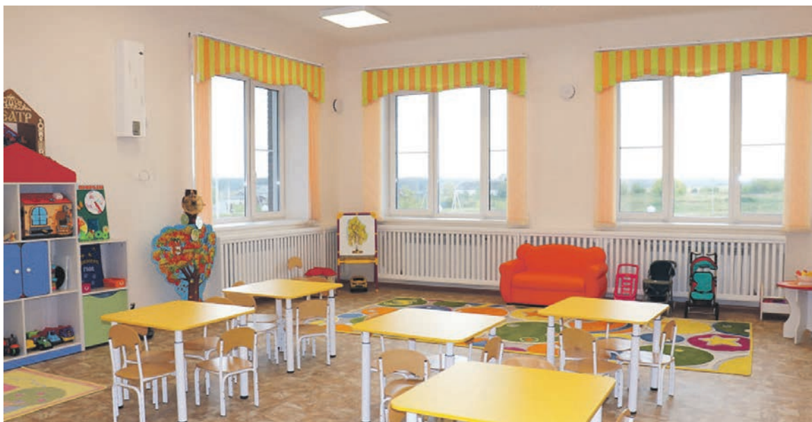
Новый детский сад в селе Мамоново Маслянинского района.

Хотя на нашем округе есть примеры строительства новых асфальтовых дорог: в этом году построен участок более двух километров (из необходимых двенадцати) дороги на Егорьевск в Маслянинском районе. Это крупный, развивающийся муниципалитет, где развита золотодобыча, туризм, и дорога туда крайне важна. Да, пока сделана только малая часть. Но в данном случае, как говорится, лиха беда начало. Проект уже запущен, эта дорога