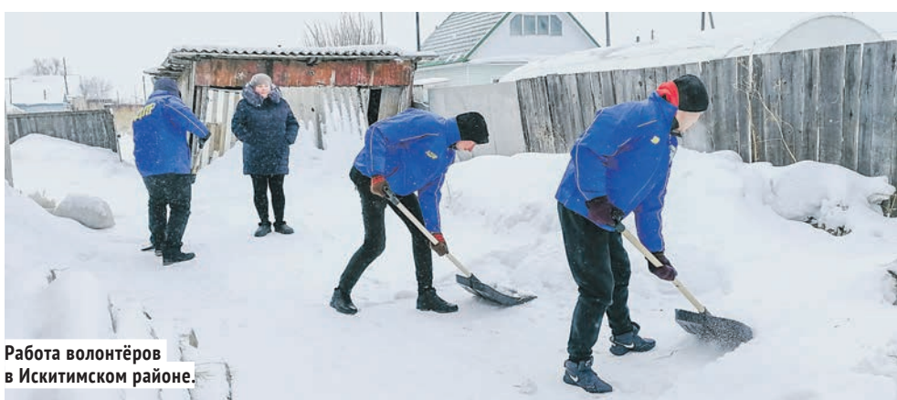
Работа волонтеров в Искитимском районе.