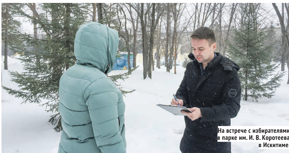
На встрече с избирателями в парке им. И. В. Коротева в Искитиме.