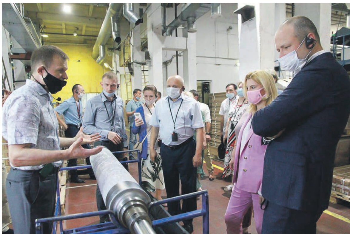
Бердская фабрика «Элизиум» выпускает обои, не уступающие в качестве лучшим зарубежным аналогам.

На круглом столе обсуждались различные вопросы: подготовка кадров, привлечение молодых специалистов на производство, взаимодействие производственных предприятий с крупными торговыми сетями, ритейлерами, подключение производственных мощностей к инженерным коммуникациям.