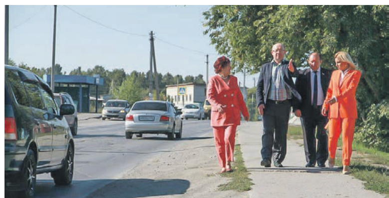
Депутаты проверили работы по ремонту тротуаров и отсыпке дорог частного сектора.

корпуса, предпринимательского сообщества и профильных областных министерств — министерства промышленности, торговли и развития предпринимательства и министерства строительства.