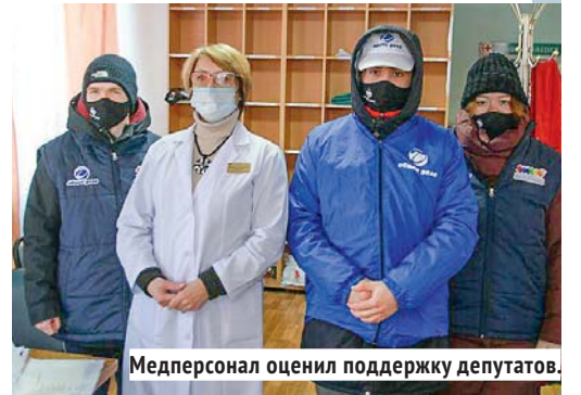
Медперсонал оценил поддержку депутатов.