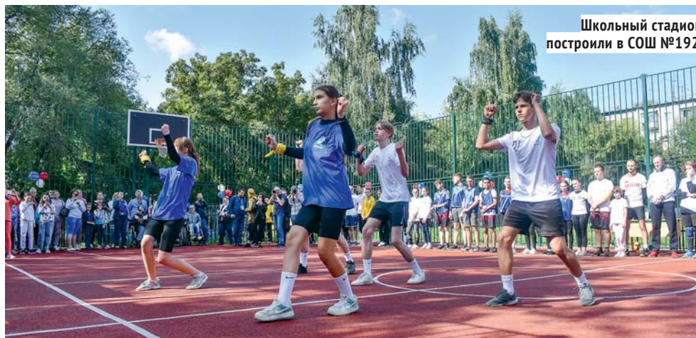
Школьный стадион построили в СОШ №192.

Чемском жилмассиве, где ещё три жилых комплекса — «Просторный», «Тулинка» и «Матрёшкин двор».