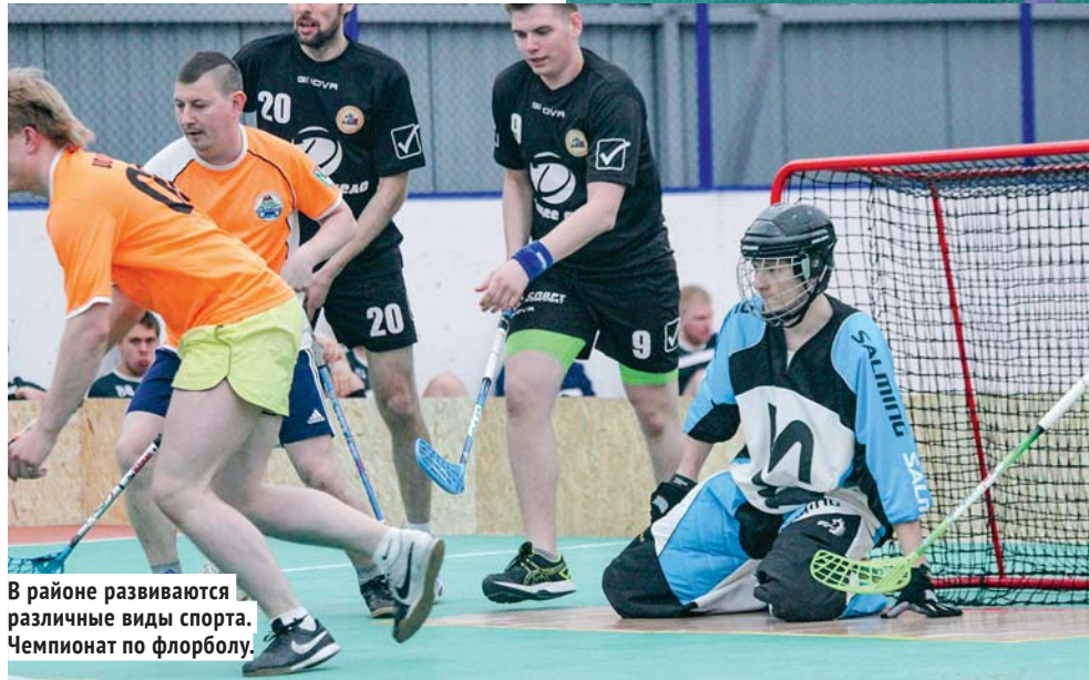
В районе развиваются различные виды спорта. Чемпионат по флорболу.