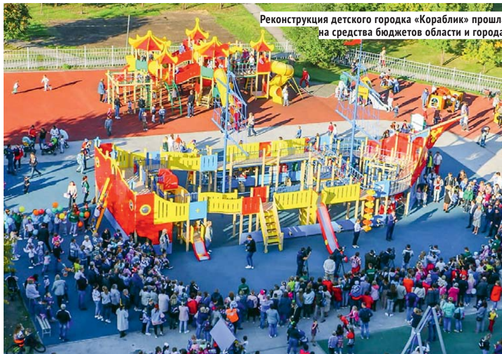
Реконструкция детского городка «Кораблик» прошла на средства бюджетов области и города.

Постепенно Кировка обретала новое лицо, рождались и реализовывались мас-