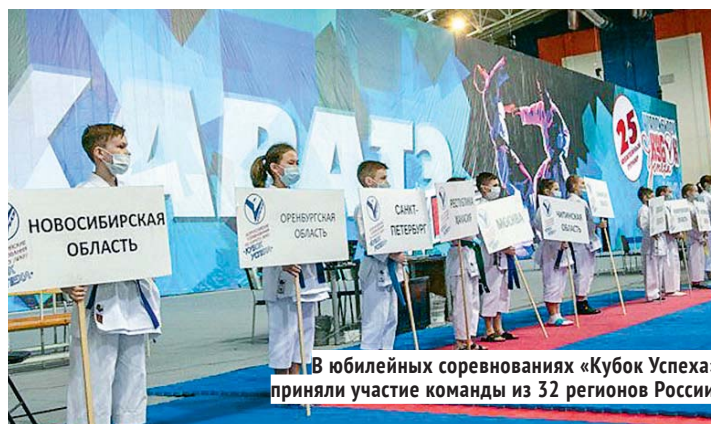
В юбилейных соревнованиях «Кубок Успеха» приняли участие команды из 32 регионов России.

Участников поздравили трёхкратный Олимпийский чемпион, Герой России, член Совета Федерации Федерального Собрания РФ Александр Карелин и российский гимнаст, олимпийский чемпион 1996 года, бронзовый призёр Олимпийских игр 2000 года, серебряный призёр чемпионата мира 1999 года, обладатель кубка Гран-при во Франции депутат заксобрания Евгений Подгорный .