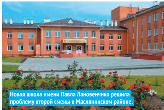
Новая школа имени Павла Лановенчика решила проблему второй смены в Маслянинском районе.