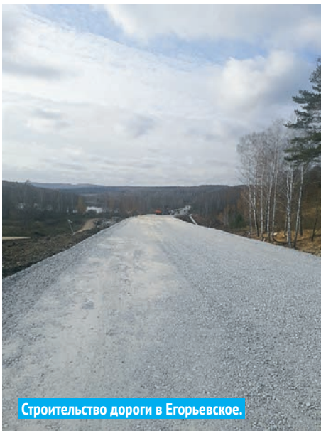
Строительство дороги в Егорьевское.