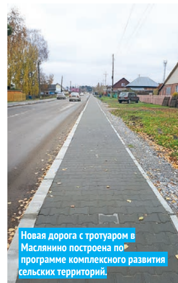
Новая дорога с тротуаром в Маслянино построена по программе комплексного развития сельских территорий.

Что же касается асфальтовых дорог, это отдельная категория, ещё более дорогостоящая и практически недоступная нам без поддержки областного бюджета. К счастью, уже два года существует федеральная программа «Комплексное развитие сельских территорий», в которой и район, и посёлок Маслянино активно участвуют. Нам уже удалось построить в райцентре несколько участков хороших дорог с тротуарами.