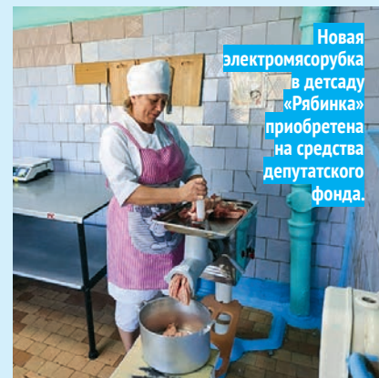
Новая электромясорубка в детсаду «Рябинка» приобретена на средства депутатского фонда.

Черепановская средняя школа №5 — ремонт школьного перехода «Черепановский краеведческий музей» — ремонт помещения художественного отдела музея Пушкинская средняя школа — устройство вентиляции в школьной столовой Детский сад №1 «Рябинка» — приобретение кухонной машины для приготовления блюд «Шурыгинский СДК» — приобретение полового покрытия в зрительный зал Безменовская средняя школа — приобретение электроплиты в школьную столовую