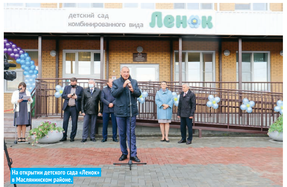
На открытии детского сада «Ленок» в Маслянинском районе.

В ходе поездки в район Майис Мамедов также посетил презентацию площадки окружного молодёжного форума с международным участием «Сибирь здесь», проведение которого планируется на территории сельского экопарка «Хомутина». Как подчеркнул депутат, пример Маслянинского