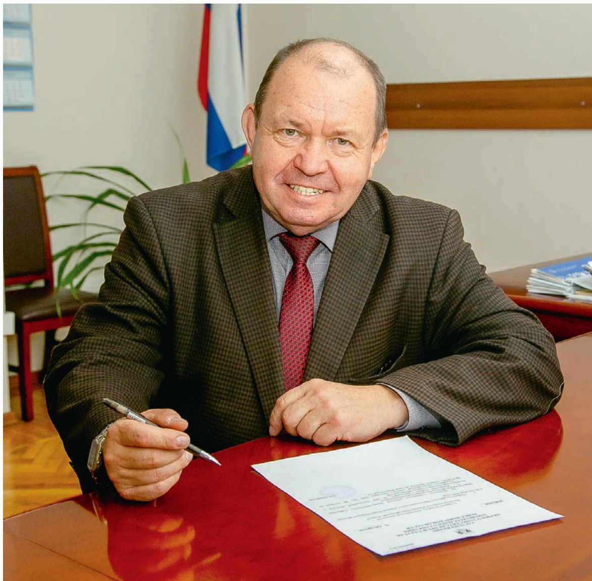
ГРАФИК ПРИЁМА ГРАЖДАН

— Серьёзные проблемы есть практически везде. В Искитимском районе главная — это, конечно, дороги. Глобальная же проблема — обеспечение питьевой водой, строительство