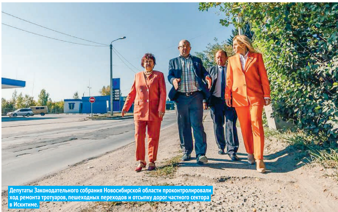
Депутаты Законодательного собрания Новосибирской области проконтролировали ход ремонта тротуаров, пешеходных переходов и отсыпку дорог частного сектора в Искитиме.

– Новосибирской области дополнительно выделили один миллиард рублей на ремонт