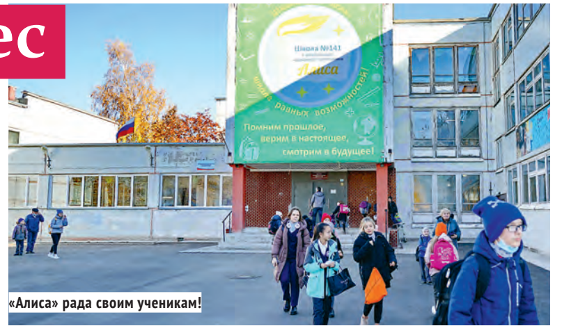
«Алиса» рада своим ученикам!