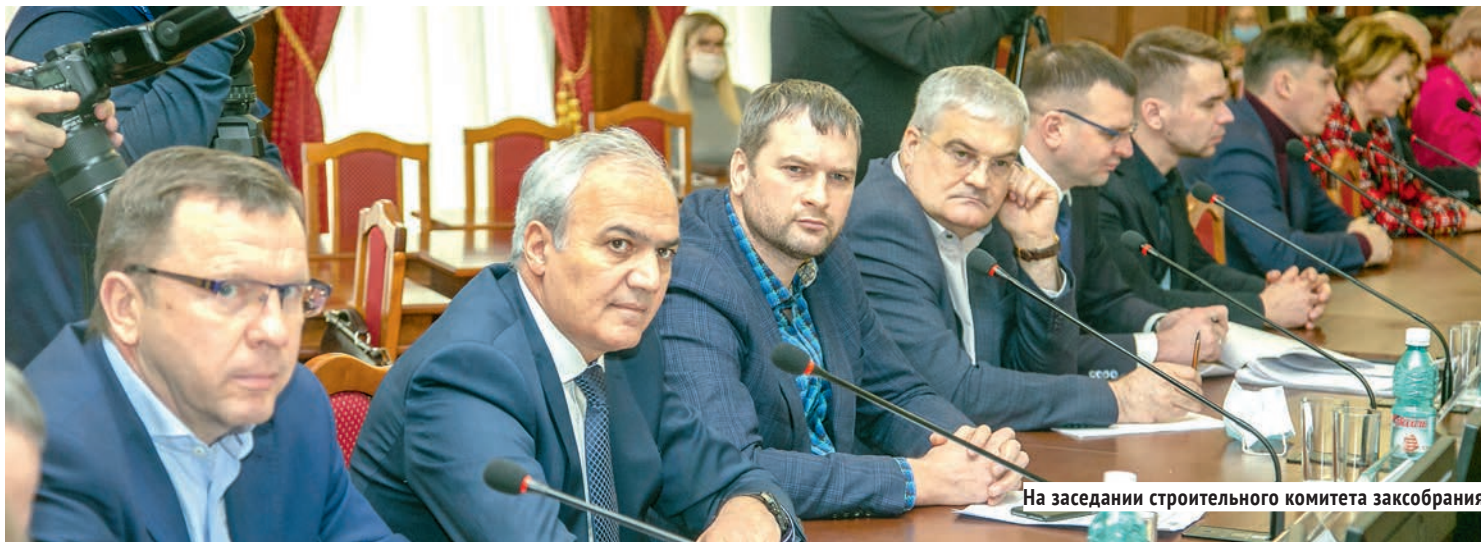
На заседании строительного комитета заксобрании.

— И там тоже работу надо усиливать. Но мне кажется, больше внимания надо уделять простым вещам: хоккейным коробкам во дворах и при школах, крытым каткам для детей в микрорайонах — для массового спорта. Да, мегаобъекты нужны, они привлекают в город деньги, они как флаги. Но главными для нас должны быть другие объекты: школы, детские сады, кружки и секции, чтобы росли свои таланты в спорте и других сферах. Если же будем строить дворцы и стадионы, а играть там будут спортсмены, купленные в Европе или Канаде, то в чём вообще смысл?