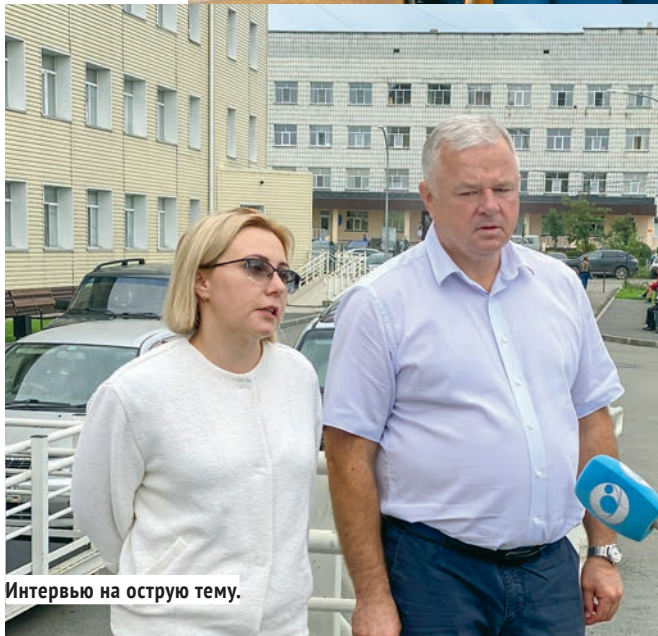
Интервью на острую тему.

— от рождения до ухода. И неважно, где этот человек живёт — в мегаполисе или в отдалённой деревне. Убеждён — каждый человек должен иметь доступ к качественной медицине. Мы, разумеется, не сможем сделать в каждом селе супербольницу. Но мы обязаны дать больному возможность доехать до больницы, а в случае неотложной помощи вывезти его из самой глухой деревни в нужное медицинское учреждение. Что касается здравоохранения в целом, то мы сегодня понимаем, что медицина должна быть ожидающей — с пустыми больницами «про запас» и накопленными кадровыми ресурсами. И это было очень трудно доказать некоторым коллегам — особенно, когда после второй волны пандемии нас всех немного отпустило.