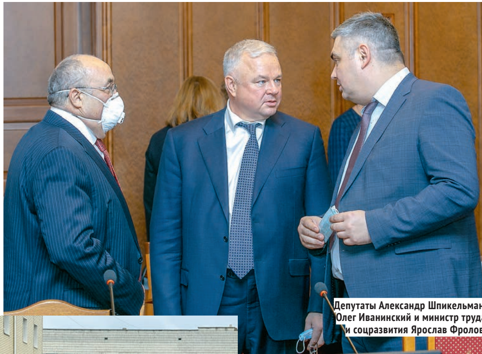
Депутаты Александр Шпикельман, Олег Ивановский и министр труда и соцразвития Ярослав Фролов.

— Да, и у неё даже есть название — демография. Это главный национальный проект, который предусматривает медицинское и социальное сопровождение человека на протяжении всей его жизни