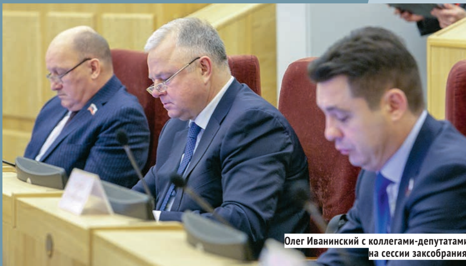
Олег Иванинский с коллегами-депутатами на сессии заксобрания.