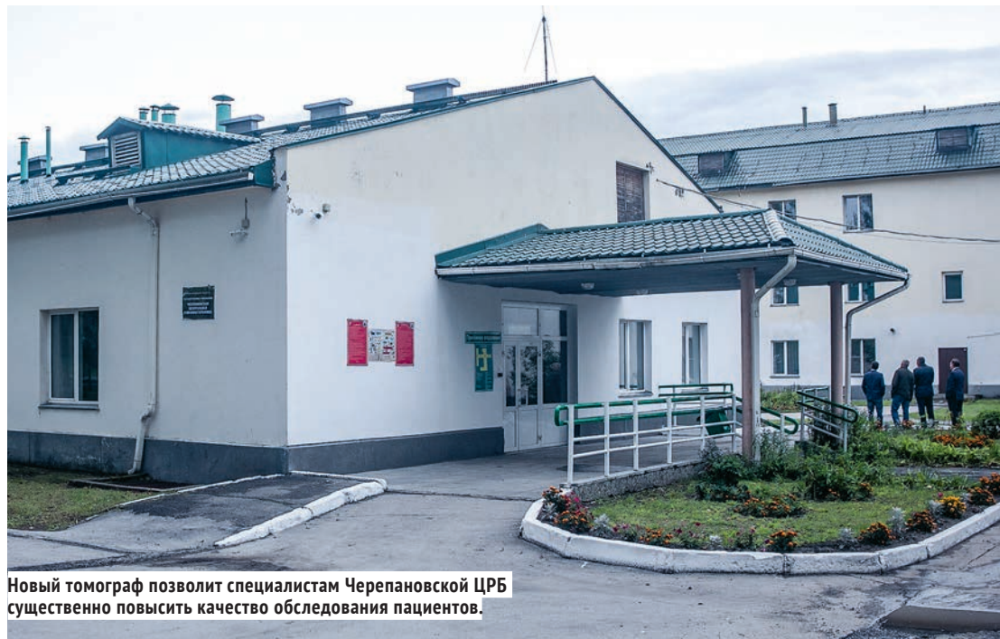
Новый томограф позволит специалистам Черепановской ЦРБ существенно повысить качество обследования пациентов.