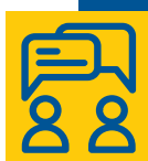
ГРАФИК ПРИЁМА ИЗБИРАТЕЛЕЙ