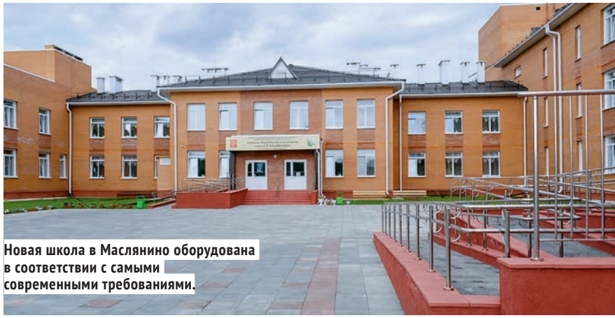
Новая школа в Маслянино оборудована в соответствии с самыми современными требованиями.