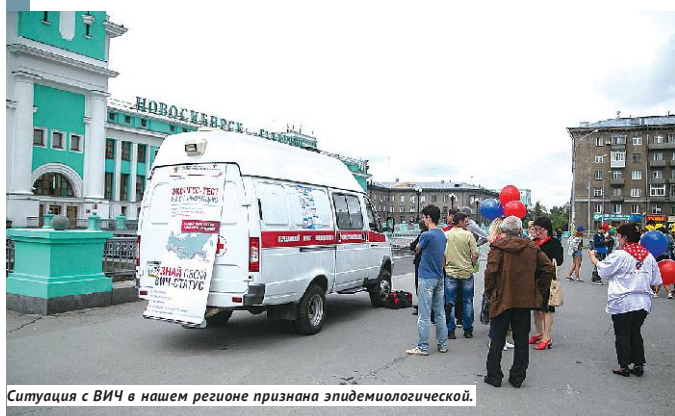
Ситуация с ВИЧ в нашем регионе признана эпидемиологической.

В Новосибирске можно было сдать экспресс-тест на ВИЧ в рамках Всероссийской акции, которую организовали Министерство здравоохранения РФ совместно с РЖД.