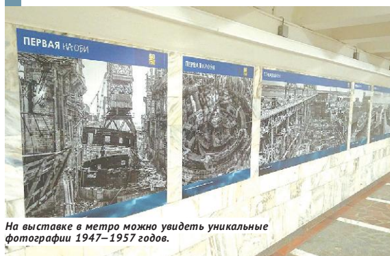
На выставке в метро можно увидеть уникальные фотографии 1947–1957 годов.

ного фотографа Бориса Мордуховского : они были сделаны с 1947-го по 1957 год. Директор Музея города Новосибирска Елена Щукина отметила, что эти кадры, безусловно, являются уникальными.