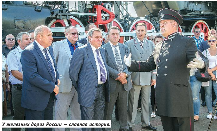
У железных дорог России — славная история.

Железнодорожный вокзал Черепаново — со столетней историей. Был открыт ещё в 1915 году. После реконструкции он превратился в комфортный для пассажиров комплекс. Даже внешне выглядит «солнечным». Помимо обновлённого фасада, окон и дверей появилась и соответствующая современным требованиям начинка: «рамка» на входе для обеспечения безопасности, для удобства и комфорта — новая мебель в зале ожидания, большое информационное табло, переговорные устройство «пассажир—касир». Через некоторое время в здании вокзала должны также оборудовать зону беспроводного доступа в интернет. Для людей с ограниченными возможностями на входе и выходе из вокзала установлены пандусы, дверные проёмы — необходимой ширины и без порогов, обустроена санитарная комната. Не только внутри здания, но и на территории железно-