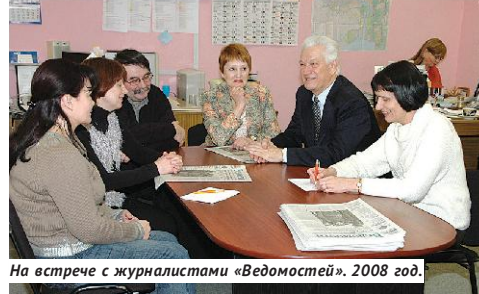
На встрече с журналистами «Ведомостей». 2008 год.

Точно так же мы были вынуждены помогать из бюджета промышленным предприятиям, где люди по пять месяцев сидели без зарплат. Главное было — спасти экономику и людей, не давать поднимать бунты.