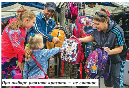
При выборе рюкзака красота — не главное.

Вопрос №2: одежда. Мальчику на учебный год понадобится как минимум одна (а лучше две) пара брюк, две-три светлые рубашки, жилетка, сменная пара туфель, форма и обувь для занятий физкультурой. Неплохой костюм-тройку на ярмарке можно приобрести за 1 200–1 500 рублей, обувь — за 500–700 рублей за пару, примерно столько же будут стоить рубашки, но это — самый бюджетный вариант. К тому же, сегодня в большинстве школ, особенно в Новосибирске, необходимо иметь единообразную форму, продающуюся на определённых торговых площадках, что сужает пространство выбора. Интернет-магазины, пестрящие предложениями на любой вкус и кошлёк, зачастую тоже не вариант: одежду и рюкзак всё же лучше примерять на конкретного ребёнка, не забывая, что он будет расти в течение года. А вот различную канцелярию можно купить и там, в