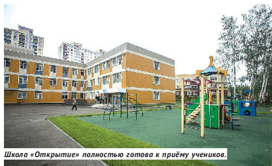
Школа «Открытие» полностью готова к приёму учеников.

дополнительных учебных мест появится в регионе после открытия новых школ.