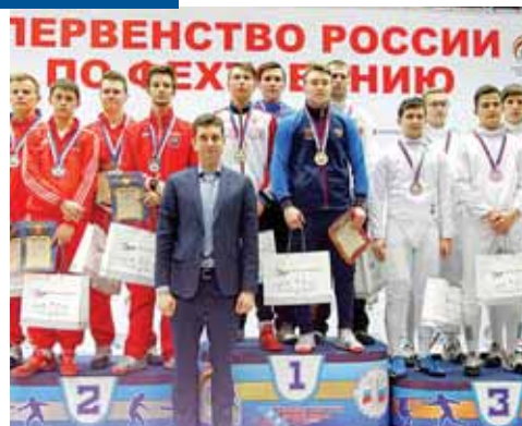
Команды юношей выиграли 1-е и 3-е места.