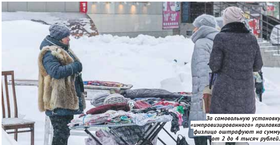
За самовольную установку «импровизированного» прилавка физлицо оштрафуют на сумму от 2 до 4 тысяч рублей.

ПРАВО Переселенцев с Севера будут ставить на учёт в местных органах власти.