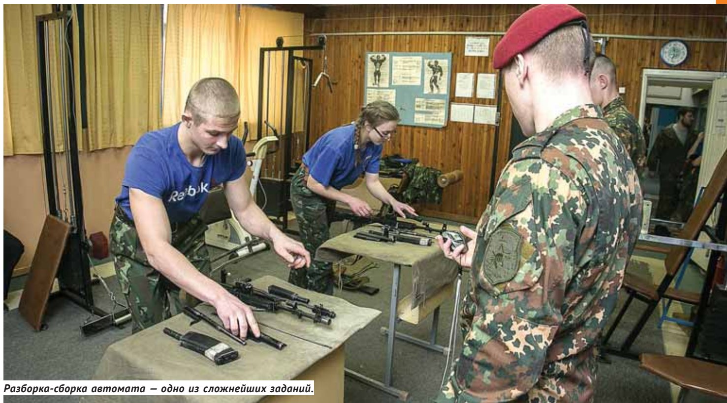
Разборка-сборка автомата — одно из сложнейших заданий.

Уникальные школьные соревнования по огневой подготовке в седьмой раз прошли в Новосибирске.