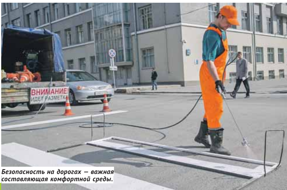
Безопасность на дорогах — важная составляющая комфортной среды.

Между тем шанс повлиять на дальнейшую работу по приоритетному проекту «Формирование комфортной городской среды» появится и у жителей Новосибирска, как и Барабинска, Бердска, Искитима, Карасука, Куйбышева, Оби, Татарска, Тогулина и Краснообска в день президентских выборов — 18 марта. Горожанам предложат проголосовать за те уголки, благоустроить которые надо будет в ближайшие сроки, — до конца 2019 года. Перечень мест, где граждане могут принять участие в голосовании, размещён на сайтах этих городов.