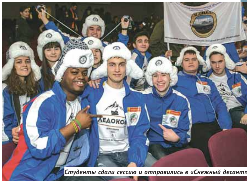
Студенты сдали сессию и отправились в «Снежный десант».

«Снежный десант» — это студенческая межрегиональная патриотическая акция, которая корнями уходит в движение строительных отрядов Новосибирской области, родившееся в 1962 году, когда студенты отправились на