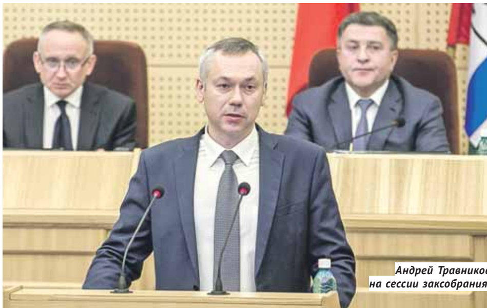
Андрей Травников на сессии заксобрания.

За прошедшее с этого дня время врио губернатора принял ряд знаковых для региона решений. Например, он заявил о необходимости расторжения «мусорной концессии», ставшей камнем преткновения в противостоянии новосибирских властей и общественности, не раз выходявшей на массовые протестные акции. При его участии разрешился спорный вопрос о месте и условиях строительства новой ледовой арены. Врио губернатора не исключил, что в ближайшие годы бюджету Новосибирска