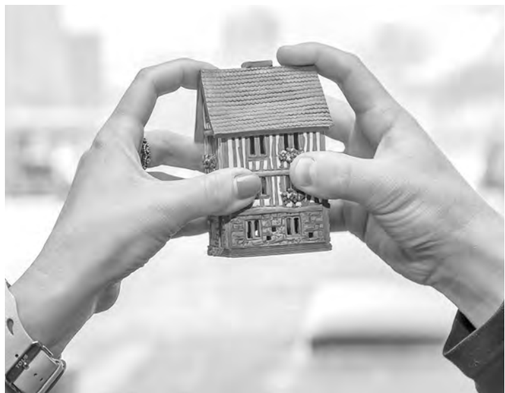
Страховать или нет своё жильё — решать только вам.

Таким образом, возложить на собственника обязанность страховать своё имущество в соответствии с гражданским законодательством Российской Федерации не представляется возможным.