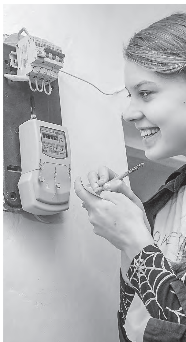
В 2020 году в Новосибирской области заменено и модернизировано более 200 километров линий электропередач.

Г лавное достижение нынешнего отопительного сезона в Новосибирской области — паспорта готовности к нему своевременно получили 95% муниципальных образований. Это один из лидирующих показателей в Сибирском федеральном округе. Ещё год назад этот показатель, по словам министра энергетики и ЖКХ региона Дениса Архипова , составлял 88%. В оставшихся территориях, где были выявлены нарушения, сейчас идёт их устранение, а где-то оно уже завершилось. В любом случае на надёжность теплоснабжения населения они уже не влияют — затруднения тут скорее для местных администраций, которые пока так и не получили акты готовности к зиме.