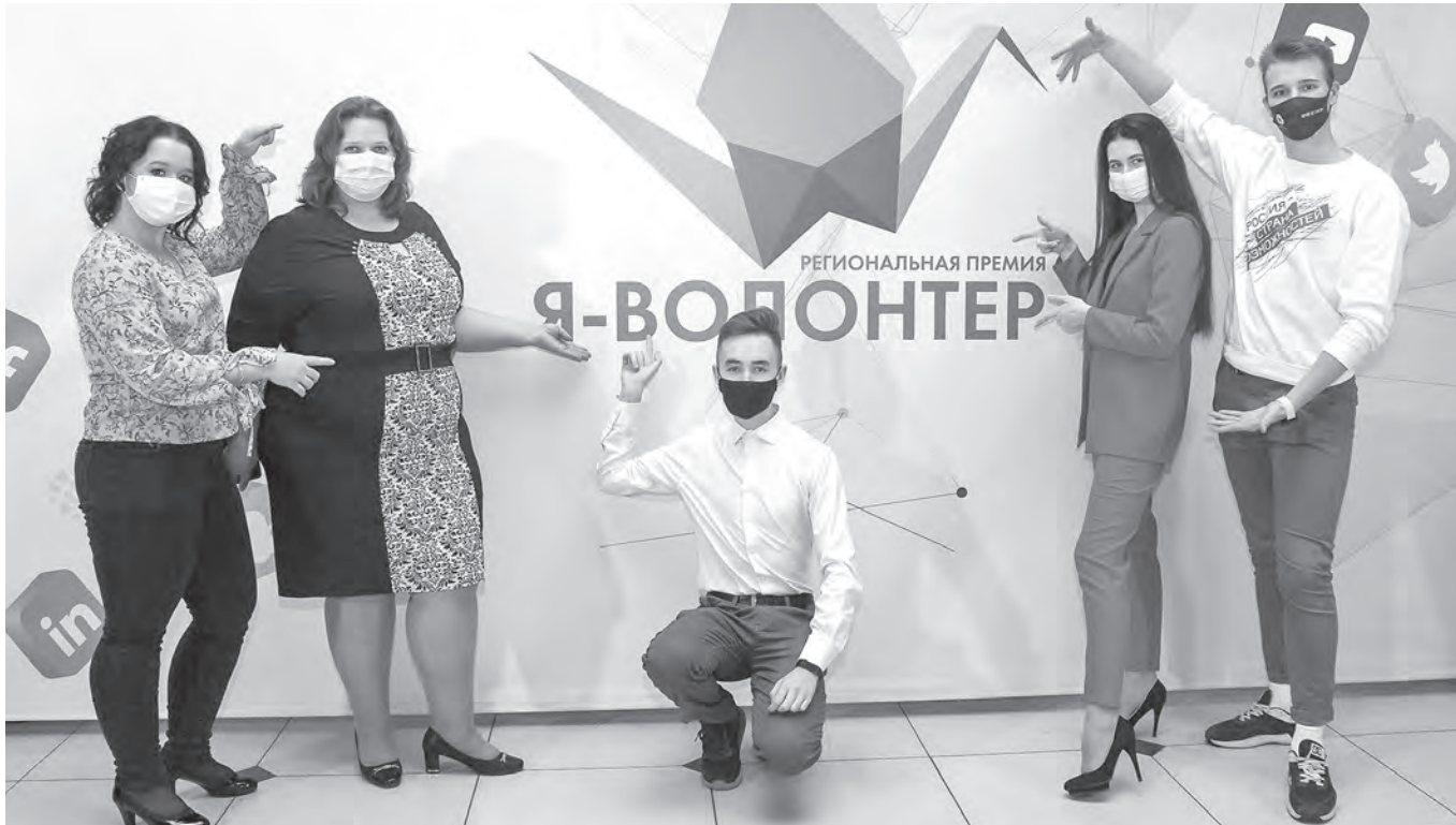
2020 год вполне может претендовать на звание «Год волонтерства».

АКТУАЛЬНО Добровольцев в Новосибирской области стало больше. Как сочувствие и готовность прийти на помощь помогают жить во время пандемии?