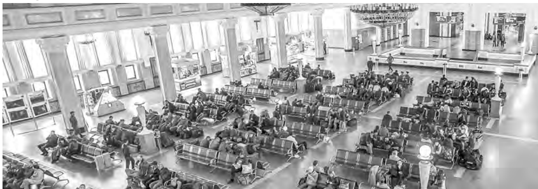
По числу прибывших соотечественников наш регион занимает первое место в СФО и второе место в России.

Новосибирская область является одним из привлекательных регионов Российской Федерации для переселения соотечественников, проживающих за рубежом. В 2020 году в наш регион приехали жить более 3 тысяч человек. Работа по переселению и адаптации соотечественников ведётся в рамках областной госпрограммы «Оказание содействия добровольному переселению в Новосибирскую область соотечественников, проживающих за рубежом».