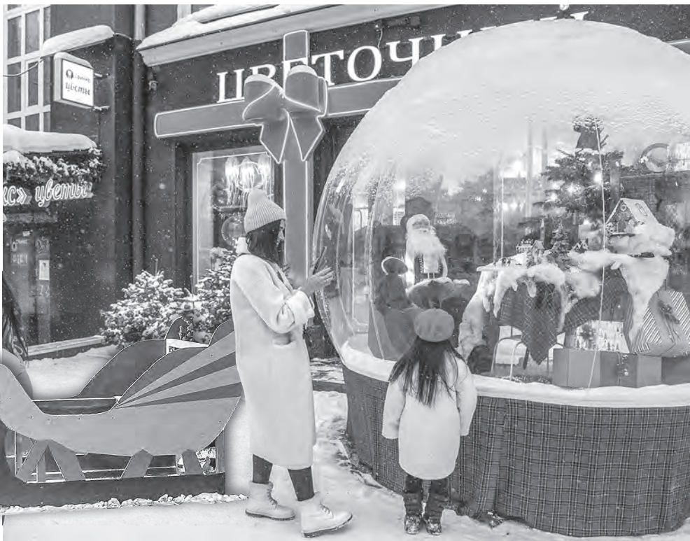
Праздничная атмосфера царит в эти дни на улицах Новосибирска.