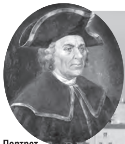
Портрет капитан-командора Беринга (1681–1741).