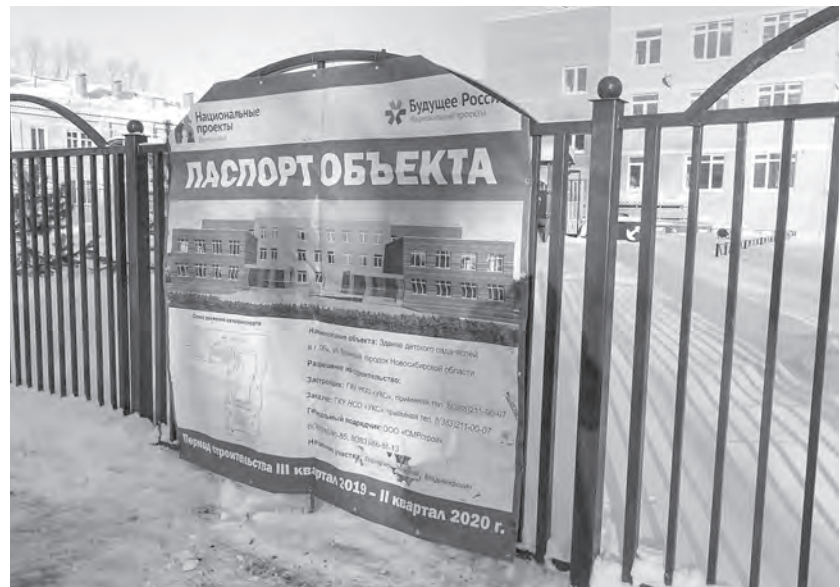
Стоимость строительства нового детсада составляет 266 млн руб., из них 137 млн — средства федерального бюджета, 126 млн — средства бюджета области.

В соответствии с национальным проектом «Демография» и национальным проектом «Жильё и городская среда» в 2020 году в Новосибирской области до конца года будет введено в эксплуатацию 16 детских садов на 3 190 мест, из них 1 035 мест для детей до трёх лет. Уже завершено строительство и получены акты ввода в эксплуатацию на 11 строительных объектах дошкольного образования, в настоящее время проводится работа по получению лицензии, до конца года будут получены разрешения на ввод ещё на 5 объектах. Кроме того, в 2020 году ведётся строительство ещё 11 дошкольных учреждений на 1 870 мест, из них 659 мест для детей до трёх лет. На эти цели в выделено 3,3 млрд рублей, в том числе из бюджета Новосибирской области 2,1 млрд, из федерального бюджета — 1,2 млрд.