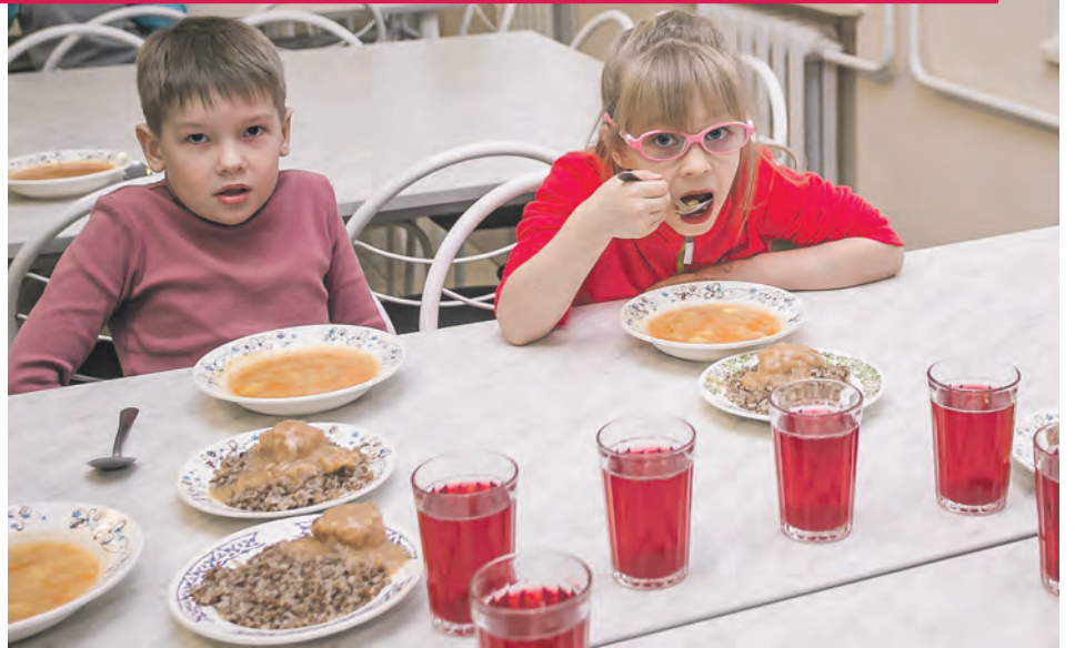
Бесплатным горячим питанием обеспечены все школьники региона с 1-го по 4-й класс.

На оперативном совещании в правительстве министр образования региона выступил с докладом об обеспечении детей из младших классов бесплатным горячим питанием.