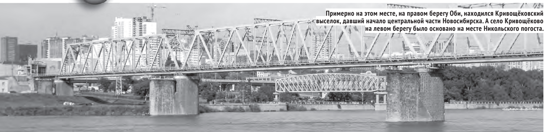
Примерно на этом месте, на правом берегу Оби, находился Кривощёковский выселок, давший начало центральной части Новосибирска. А село Кривощёково на левом берегу было основано на месте Никольского погоста.