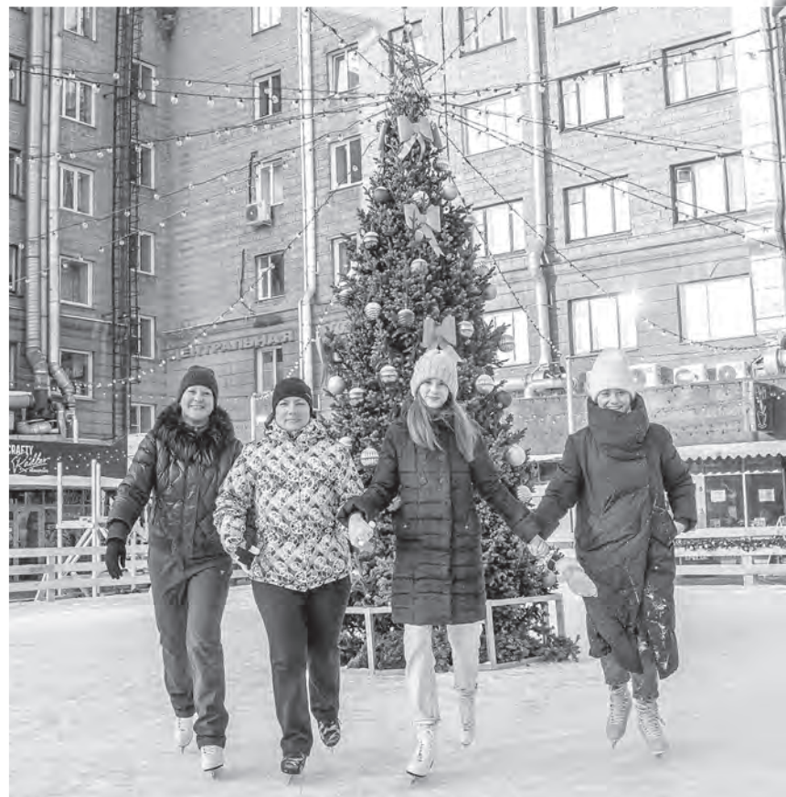
Психологи советуют в новогодние праздники будить в себе «внутреннего ребёнка» и предлагать ему развлечения. Например, катание на коньках — и весело, и для здоровья полезно!

— Избавление от домашнего хлама лучше всяких мантр переклочает мозги, — уверена семейный психолог