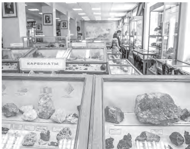
Академический отряд Великой экспедиции изучал геологию Сибири — сегодня эти традиции продолжает Центральный Сибирский геологический музей.