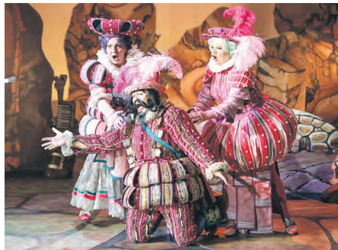
«Кот в сапогах», НОВАТ

найти и в афише театра «Старый дом» — «Мама-кот» (6+), «Морозко» (0+) и «Путешествие Нильса с дикими гусями» (6+).