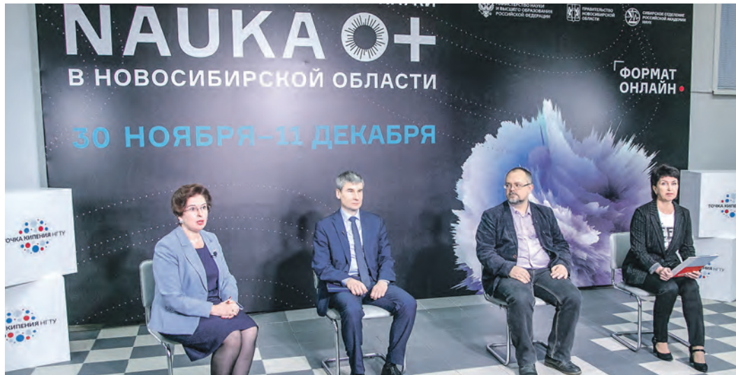
На открытии фестиваля обсудили проект «СКИФ».

мышленности России. А в Новосибирске на эту дату накладывается ещё одна — 120-летие со дня рождения «крёстного отца» Академгородка академика Михаила Лаврентьева.