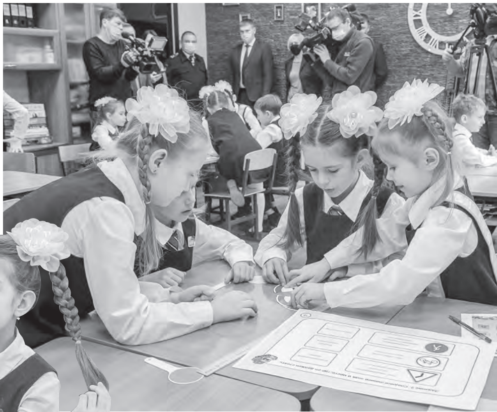
Онлайн-олимпиаду можно пройти до 11 декабря.