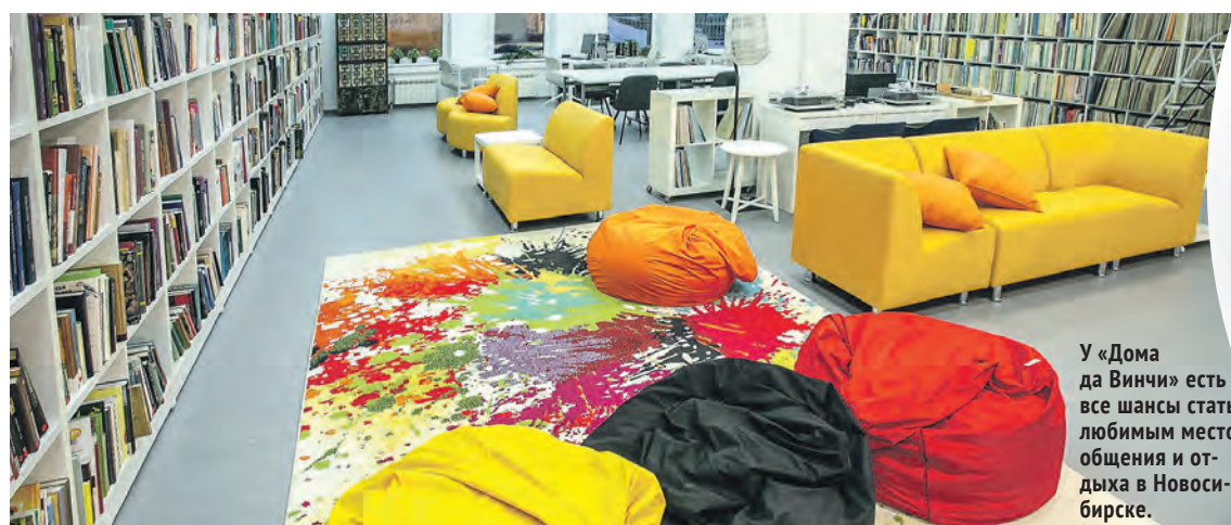
У «Дома да Винчи» есть все шансы стать любимым местом общения и отдыха в Новосибирске.