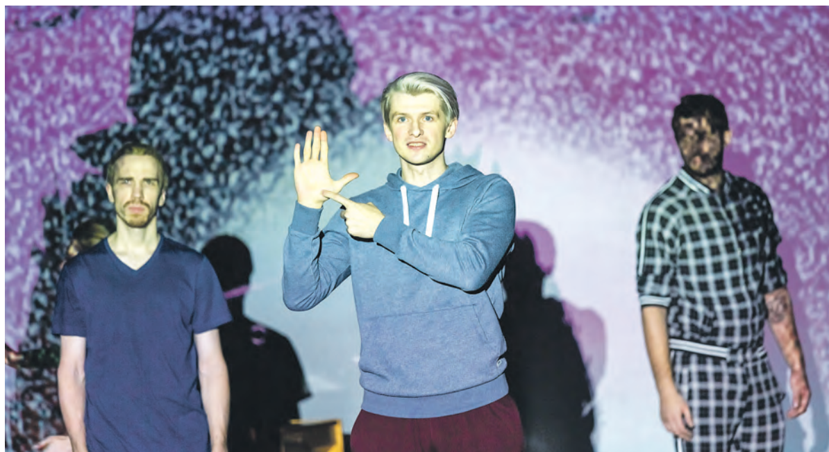
Следующие показы спектакля «ЛЮБЛЮ-НЕМОГУ» – 22 и 27 декабря.

В «Старом доме» сломали современный канон о неповторимости каждого из нас.