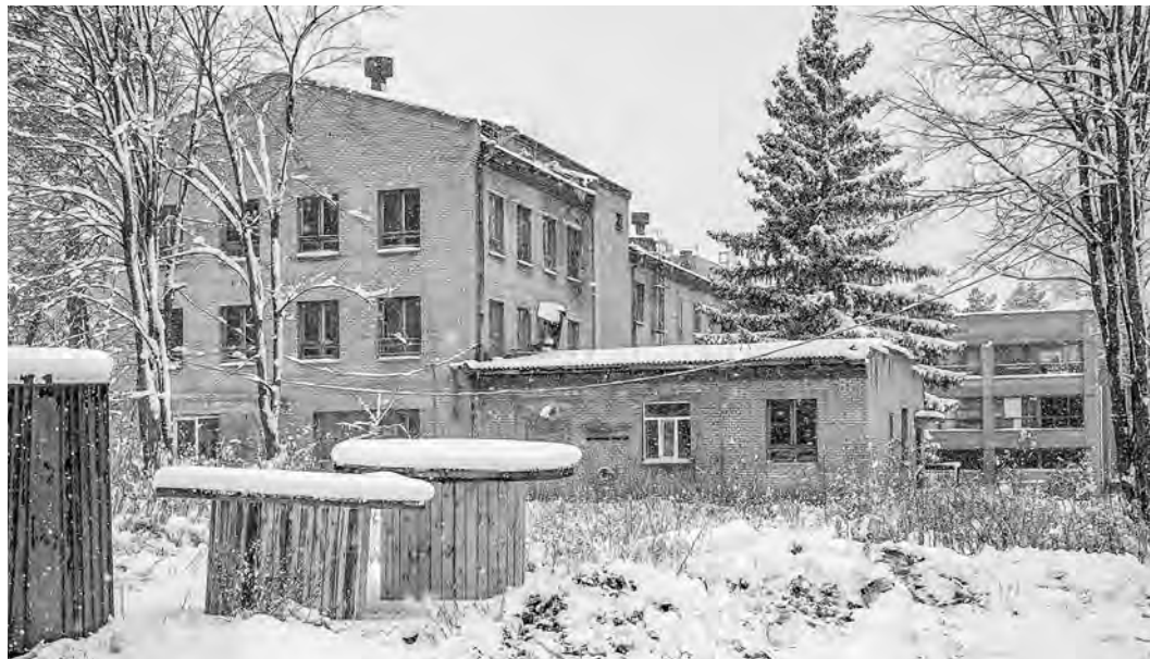
Резонансные случаи — рождение системного кризиса в детской туберкулёзной больнице.

«Ведомости» уже писали, что гуманистическая катастрофа в