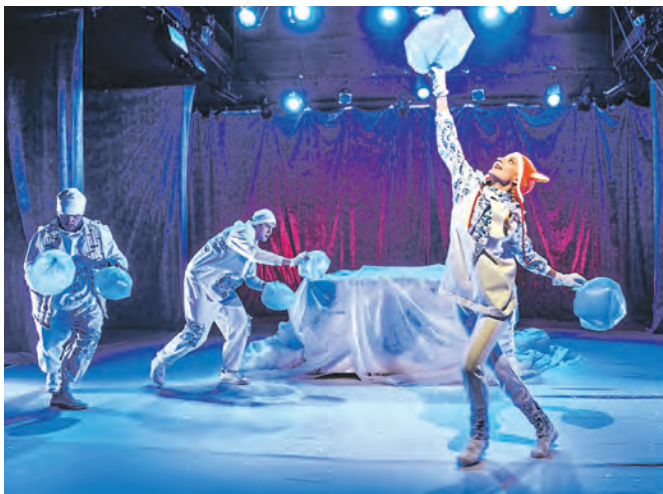
«Лисичка-сестричка и Серый волк», «Красный факел»

Несколько показов спектаклей для семейного просмотра можно