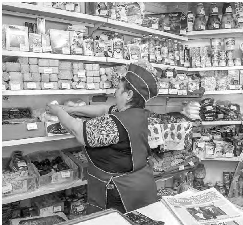
В министерстве торговли НСО полагают, что ажиотажного роста цен после отмены ЕНВД опасаться не стоит.