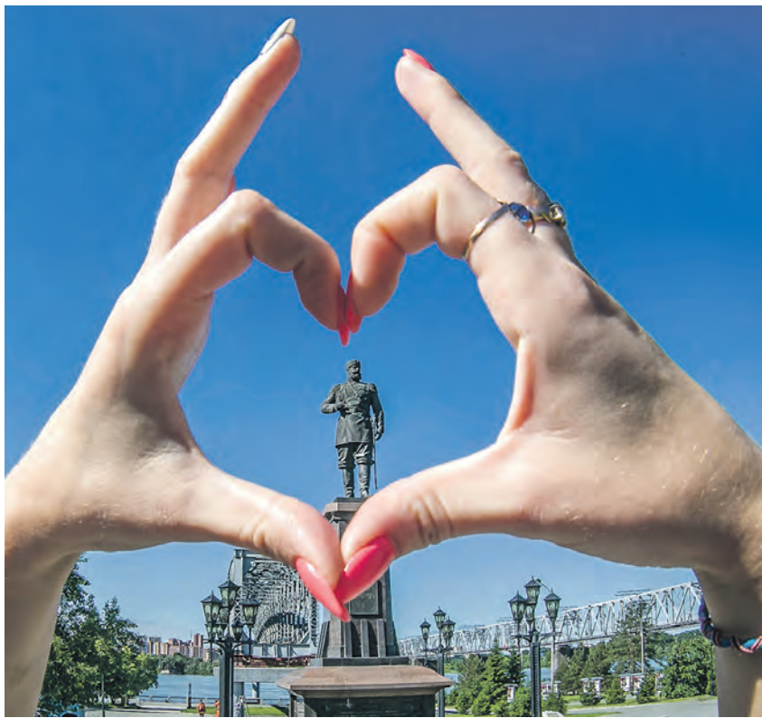
Одним из трёх ключевых объектов «Императорского маршрута» стал памятник Александру III на набережной.