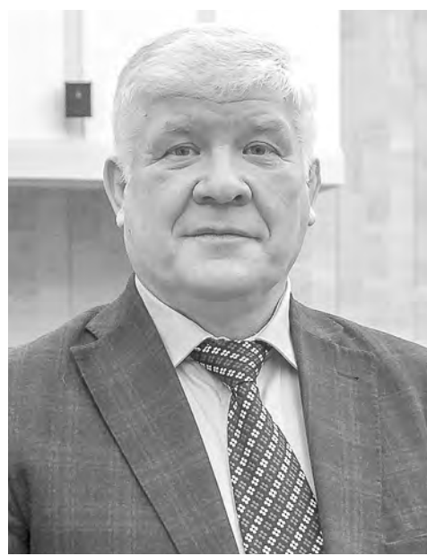
ФРАКЦИЯ КПРФ КОМИТЕТ по транспортной, промышленной и информационной политике

Примерно десятилетие назад прорывом стала областная программа стимулирования жилищного строительства, когда мы вышли на миллион квадратных метров жилья в год, чего не было даже в советские времена. Строительная отрасль в принципе единственная в эконо-