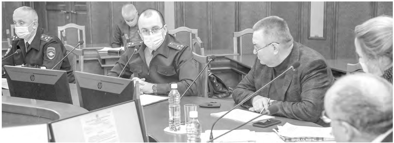
На заседаниях комиссии депутаты традиционно заслушивают доклады представителей прокуратуры и полиции.

Довольно часто прокуратуре приходится обращать внимание на конфликты интересов, которые возникают в учреждениях, подведомственных областному минздраву: родственники устраивают друг друга на работу, начисляют премии. Однако это утверждение вызвало недоумение у депутатов-медиков: в антикоррупционную комиссию вошли все четыре депутата седьмого созыва, связанные