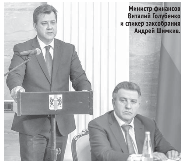
Министр финансов Виталий Голубенко и спикер заксобраний Андрей Шимкив.

На заседании правительства области представлен проект бюджета на 2021 год и плановый период 2022–2023 годов. Прежде чем назвать основные параметры документа, министр финансов и налоговой политики области Виталий Голубенко перечислил ряд факторов, заметно повлиявших на ухудшение макроэкономической ситуации, исходя из которой рассчитывался проект бюджета. В числе основных принципов, которыми руководствовались разработчики, — учёт прогноза социально-экономического развития области, изменения федерального законодательства, влияющие на собственные доходы, учёт федеральных трансфертов, обеспечение выполнения указов президента, оптимизация текущих расходов органов власти, сохранение финансовой устойчивости местных бюджетов.