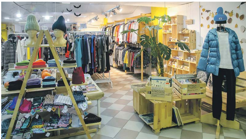
За год работы GUSTO раздал нуждающимся 10 тонн вещей и отправил в переработку 4 тонны.

Да и с утилизацией нашедшего ширпотреба есть определённые проблемы: по статистике, 85% приобретённой за год одежды утилизируется без последующей переработки. Конечно, масс-маркет под напором эоактивистов дрогнул: к примеру, такие известные бренды, как H&M, Mango и ASOS, стали предпринимать публичные шаги в сторону осознанного потребления — выпускать коллекции из переработанных материалов и менять старую одежду на купон. Вот только купон даёт скидочное право на новый шмот, а это означает, что сансара потребления жила, живёт и будет жить.