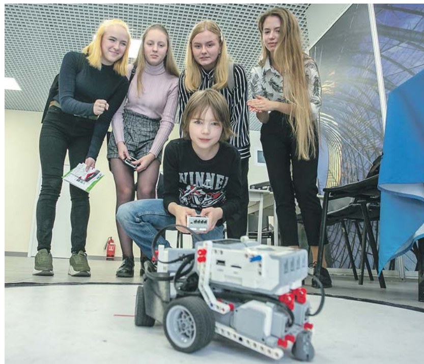
Роботехника, авиамоделирование, конструирование беспилотных автомобилей — современные дети активно овладевают этими компетенциями.

В школах Новосибирской области работают 78 педагогов из шести регионов России — они приехали по программе «Земский учитель». Как рассказал министр образования, эти учителя преподают в школах малых населённых пунктов,