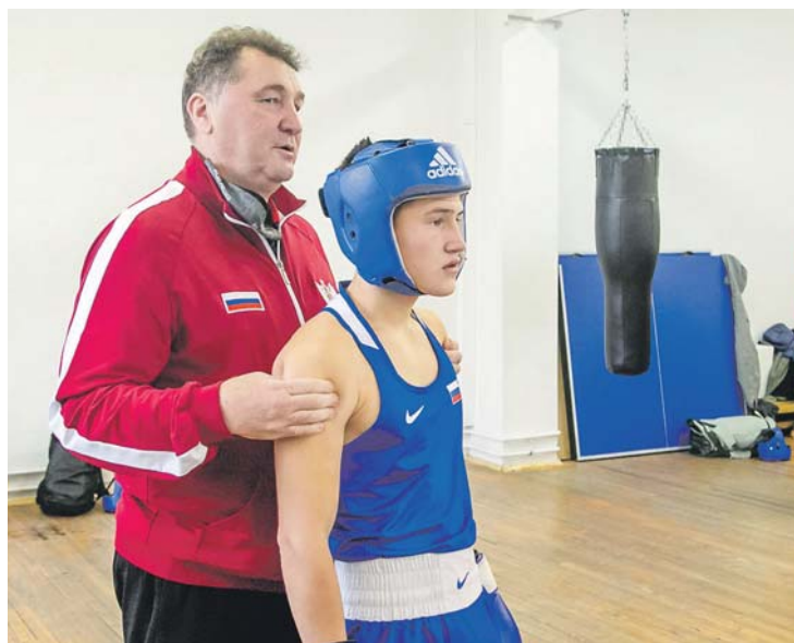
Заслуженный тренер России Юрий Емельянов готовит воспитанника к поединку.