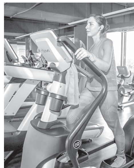
Посетителям фитнес-клубов могут разрешить вернуть часть затрат на абонемент.