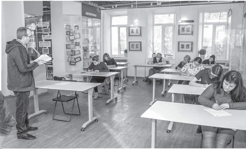
В этом году в Новосибирске диктант офлайн написали 1 139 человек.

В Новосибирской области, как и по всей России, подводят итоги Тотального диктанта. Акция по проверке грамотности русского языка впервые за 17 лет прошла без аншлагов.