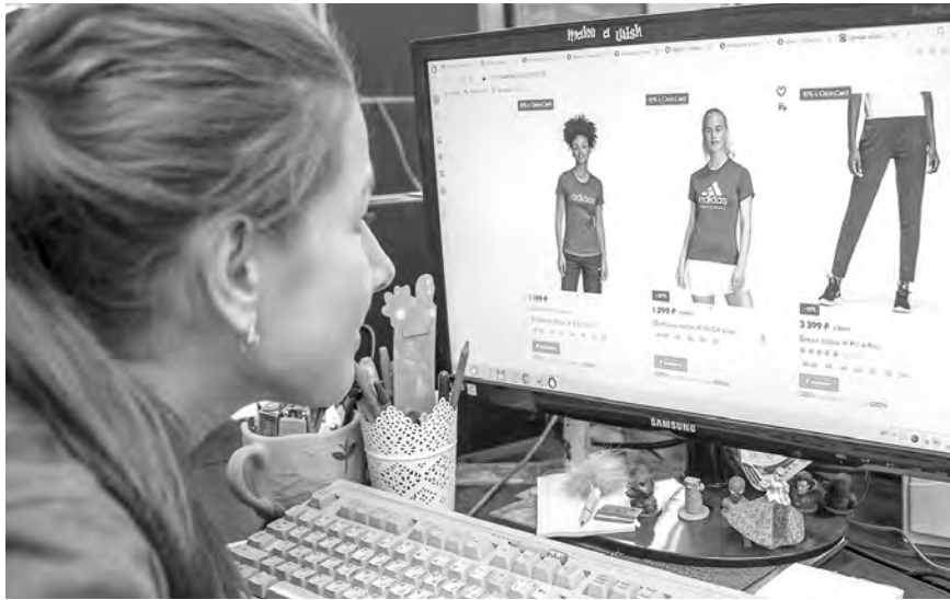
Электронная торговля в 2020 году переживает настоящий бум.

В числе основных направлений — обмен опытом работы в новых условиях, знакомство с последними трендами электронной торговли, изучение особенностей потребительского поведения в условиях пандемии.