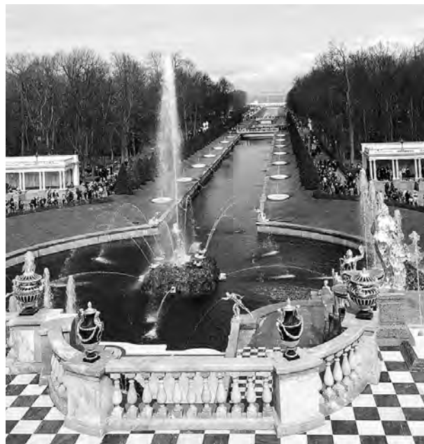
Традиционно большое количество туристов посещают Санкт-Петербург.