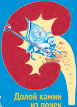
Долой камни из почек

МЕТОДЫ ЛЕЧЕНИЯ: питьевое лечение минеральной водой «Серебряный ключ», бальнеотерапия (ванны, теплый бассейн), ингаляционная терапия, спелеотерапия, траволечение, массажи, физиотерапия, глинолечение, ЛФК, климатолечение.