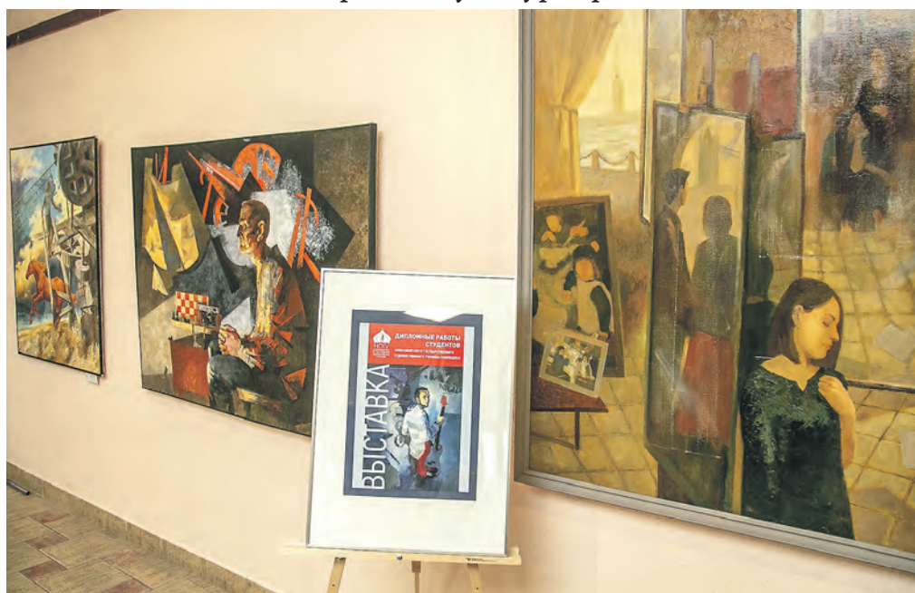
Выставка дипломных работ студентов Новосибирского художественного училища в арт-пространстве Камерного зала филармонии.

ПРОЕКТЫ Музей конструктивизма, здания для театров, творческие проекты земляков из Москвы — региональное министерство культуры рассказало о планах.