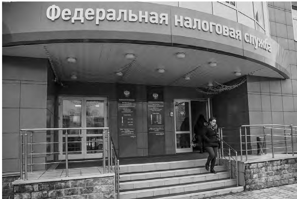
В 2020 году жителям Новосибирской области направлено 528 тысяч налоговых уведомлений в электронном виде и 818 тысяч — в бумажном.

Форма налогового уведомления в 2019 году была оптимизирована — теперь отдельный платёжный документ (квитанция) налогоплательщику не направляется, а все необходимые для уплаты налога сведения включены в уведомление. В 2020 году жителям области направлено 528 тысяч уведомлений в электронном виде и 818 тысяч — в бумажном.