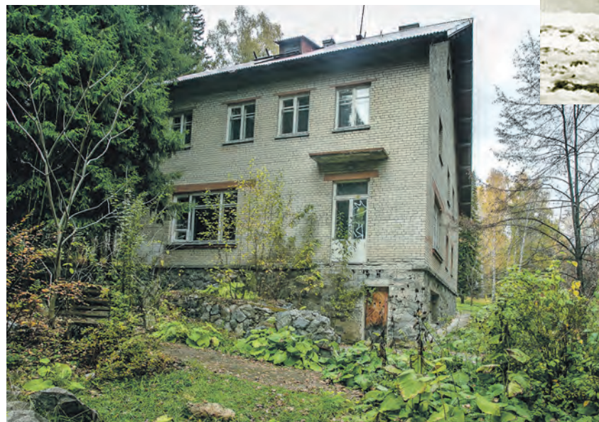
Коттедж был построен для академика Лаврентьева по заказу Хрущёва.

Кстати, и дорога Новосибирск — Академгородок появилась благодаря академику Лав-