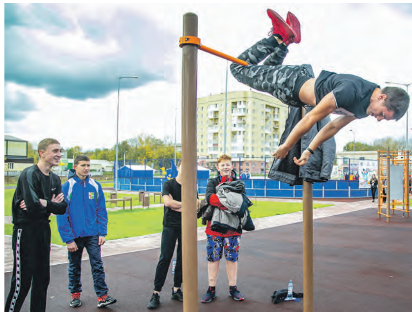
В августе-сентябре был зафиксирован заметный прирост детей, записывающихся в спортивные секции, стало больше и занимающихся физкультурой на улице.

Важно, что в коронавирус совсем не останавливалось строительство спортивных объектов. Региональный волейбольный центр уже функционирует, а в минувшую субботу, 3 октября, он был торжественно открыт матчем на Суперкубок России. Эта крутейшая арена (как по вместимости — около 5 000 зрителей, так и по технологической оснащённости) не только станет домом волейбольного «Локомотива», но и местом проведения одного из групповых этапов чемпионата мира 2022 года. Кроме того, здесь мож-