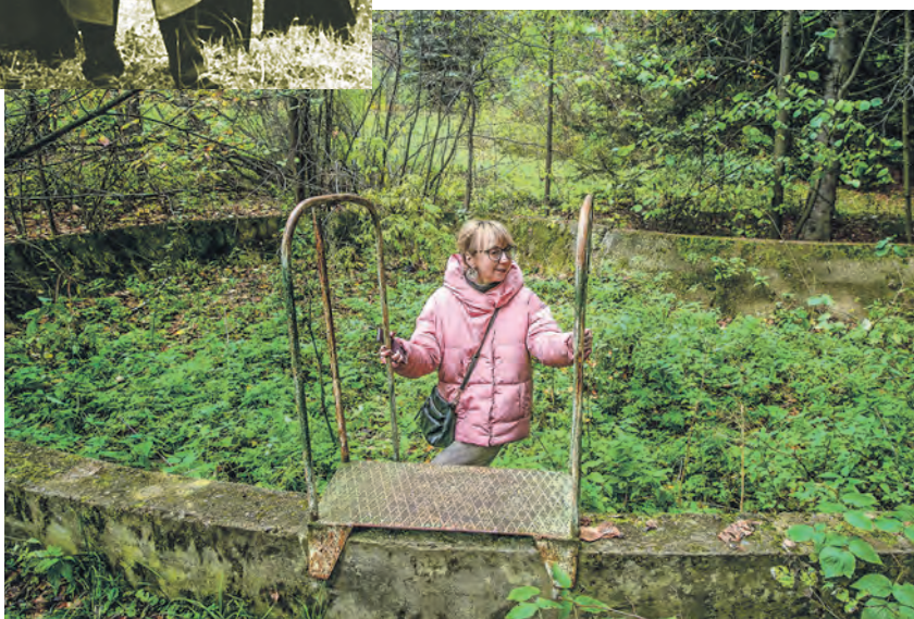
В этом заросшем бассейне запустил свои знаменитые «цунами» академик Лаврентьев.