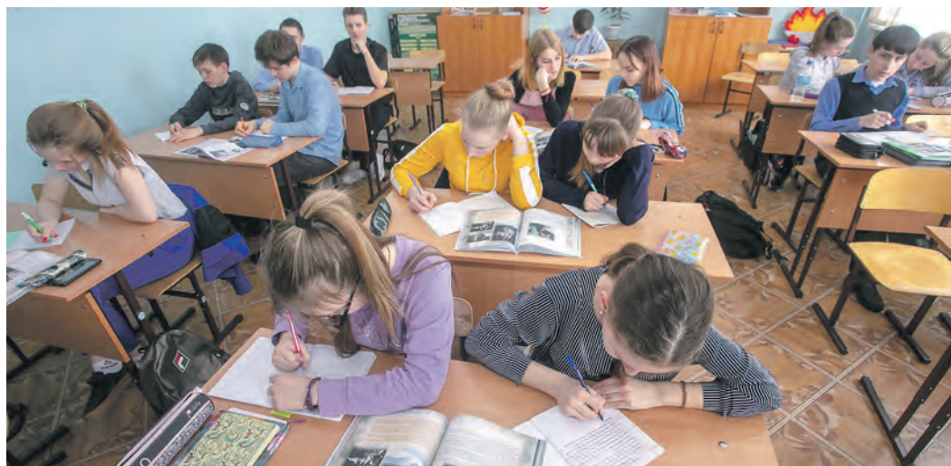
Десятиклассники, которым в прошлом учебном году не пришлось сдавать ОГЭ, в этом пишут стартовые диагностические работы.

Последствия скомканного окончания 2019/2020 учебного года, последние месяцы которого из-за коронавируса проходили в дистанционном режиме, дают о себе знать до сих пор. Одно из них — перенос Всероссийских проверочных работ. Учащиеся 4–8 классов должны были писать их в апреле, но в итоге сдают сейчас — в 5–9-х. Однако, по мнению представителей регионального минобра, такой перенос пошёл детям только на пользу: остаточные знания, приобретённые в предыдущем учебном году, имеет смысл проверять именно после летних каникул.