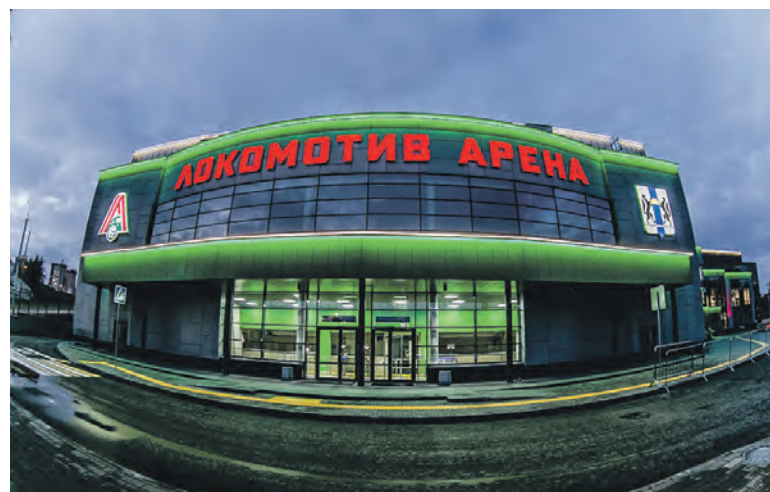
В вечернее время волейбольный центр эффектно подсвечивается