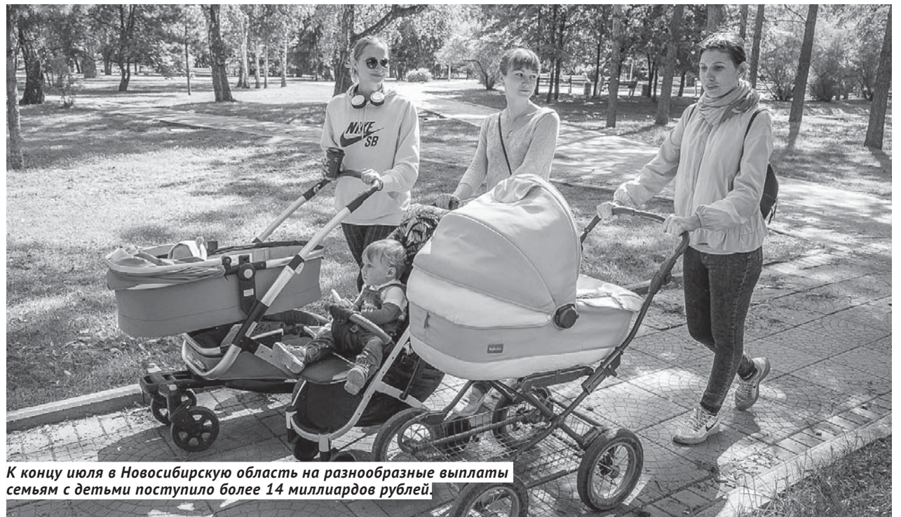
К концу июля в Новосибирскую область на разнообразные выплаты семьям с детьми поступило более 14 миллиардов рублей.

Позади — уже четыре месяца карантинных мероприятий самого разного уровня строгости. Для кого-то все неудобства ограничились необходимостью носить маску — и этим людям сильно повезло. А многие из-за простоя предприятий остались без работы, у кого-то несёт огромные убытки бизнес — и эти люди оказались на грани выживания. Поэтому эти четыре месяца стали проверкой на прочность не только для системы здравоохранения, но и для системы социальной защиты населения. Конечно, огромным подспорьем стали «президентские» выплаты и другие меры поддержки граждан и бизнеса, которые несколько раз вводились после выступлений президента РФ Владимира Путина, но всю нагрузку с региональной власти они не сняли.