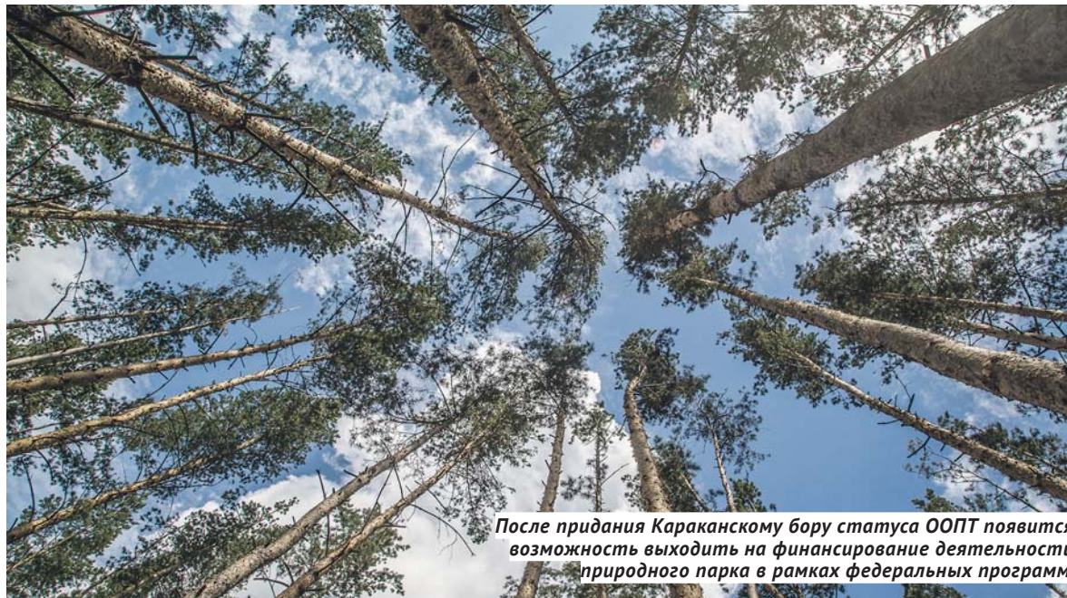
После придания Караканскому бору статуса ООПТ появится возможность выходить на финансирование деятельности природного парка в рамках федеральных программ.

Площадь Караканского бора — 99 000 гектаров. Компактный лесной массив тянется вдоль правого берега Новосибирского водохранилища на 98 км, наибольшая ширина бора — 18 км.