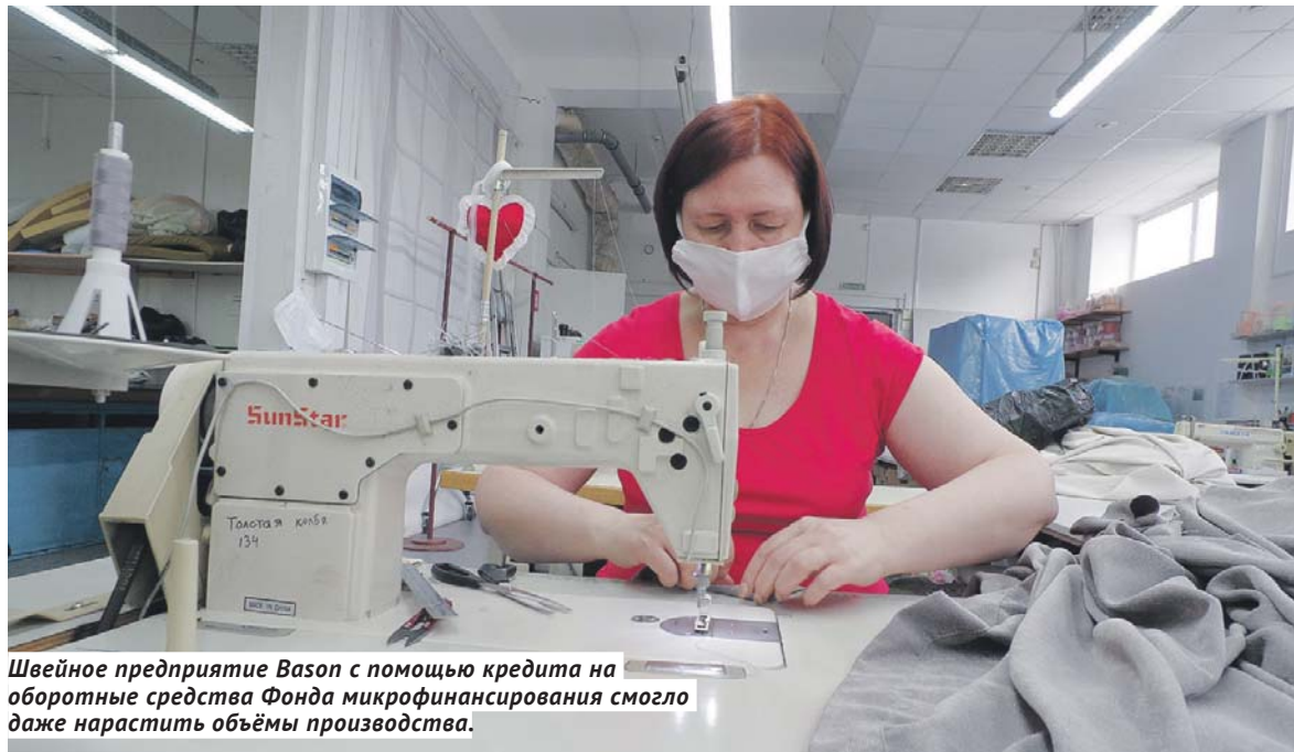
Швейное предприятие Bason с помощью кредита на оборотные средства Фонда микрофинансирования смогло даже нарастить объёмы производства.

До 1 июля действовал мораторий на блокировку счетов, сейчас «Опора России» предлагает продлить его до конца 2021 года — как и мораторий на плановые проверки бизнеса (кроме трёх самых высоких категорий риска) со стороны контрольно-надзорных органов. То же самое касается и процедуры банкротства — пока на неё наложен мораторий до октября 2020 года, но предприниматели считают, что продлить надо будет и его.