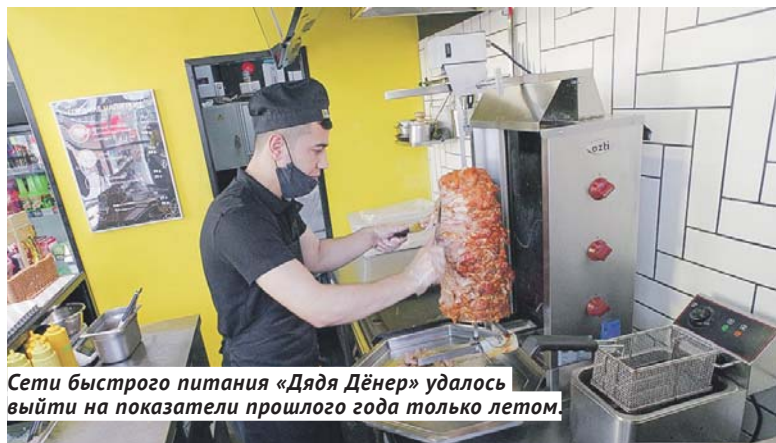
Сети быстрого питания «Дядя Дёнер» удалось выйти на показатели прошлого года только летом.

— Мы обслуживаем корпоративных клиентов — госпредприятия, школы, филармонии,