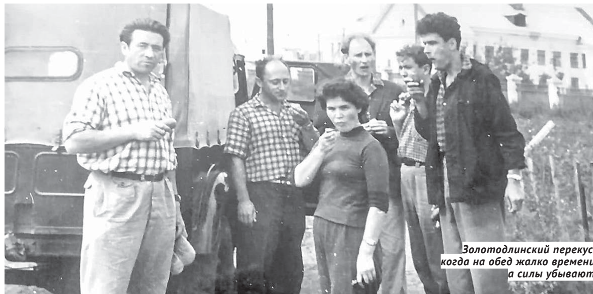
Золотодлинский перекус: когда на обед жалко времени, а силы убывают.