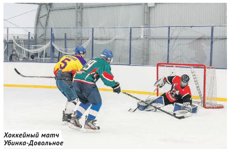
Хоккейный матч Убинка-Довольное