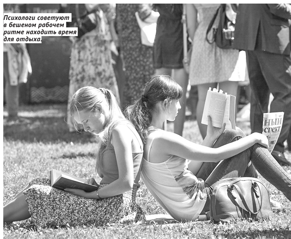
Психологи советуют в бешеном рабочем ритме находить время для отдыха.

— В своей практике я также вижу связь выгорания с поиском профессии «по душе», — говорит психотерапевт. — Ещё лет 100 назад в нашей стране казалось возможным работать без оглядки на свои желания, сейчас же многие стремятся трудиться там, где ощущают реализацию и эмоциональный подъём. Соответственно, если дело «по душе» не найдено, а нынешняя работа совсем не нравится, выгорание наступает с большей долей вероятности.