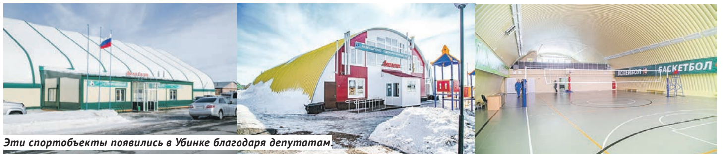
Эти спортивные объекты появились в Убинке благодаря депутатам.