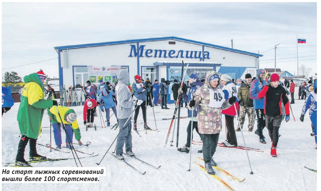
На старт лыжных соревнований вышли более 100 спортсменов.

Во всей этой истории интересно другое — место проведения соревнований. Убинка в плане развития спортивной инфраструктуры ещё недавно была как бы провинцией среди районов округа, но буквально за три года стала столицей, получив три прекрасных спортивных объекта: лыжную базу «Метелица», крутую хоккейную