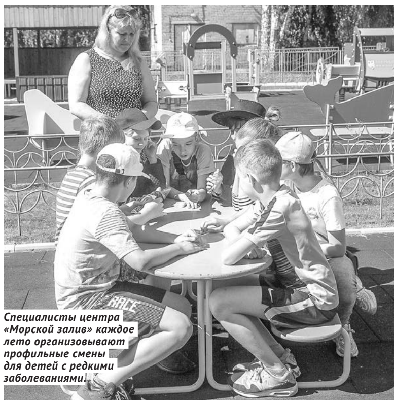
Специалисты центра «Морской залив» каждое лето организуют профильные смены для детей с редкими заболеваниями.