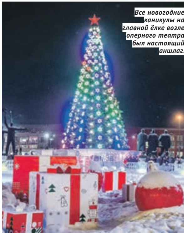
Все новогодние каникулы на главной ёлке возле оперного театра был настоящий аншлаг.

Кроме того, в дни новогодних каникул состоялись премьерные показы спектаклей новосибирских театров. Для школьников Новосибирской