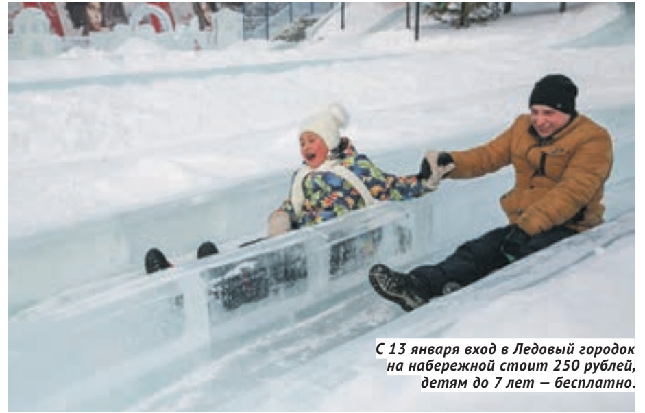
С 13 января вход в Ледовый городок на набережной стоит 250 рублей, детям до 7 лет – бесплатно.

области была организована традиционная ежегодная Губернаторская новогодняя ёлка — 27 декабря на сцене ГКЗ им. А. М. Каца показали сказочное представление. Участниками ёлки стали около 1 700 детей в возрасте от 6 до лет. Среди них — одарённые дети, победители конкурсов, олимпиад, дети из многодетных и малообеспеченных семей, а также дети-сироты и дети с ограниченными возможностями здоровья. Кстати, спектакль, поставленный для Губернаторской ёлки, 6 и 7 января сыграли в Домах культуры Чулымского и Мошковского районов. По традиции,