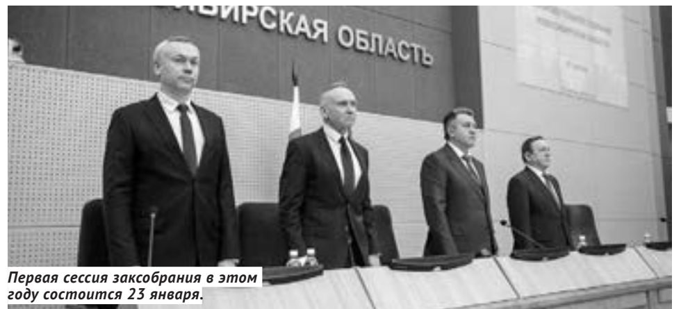
Первая сессия заксобрания в этом году состоится 23 января.