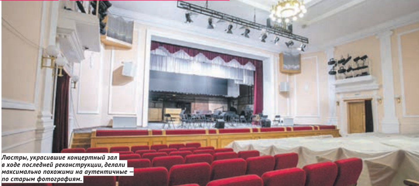
Люстры, украсившие концертный зал в ходе последней реконструкции, делали максимально похожими на аутентичные — по старым фотографиям.

В Доме Ленина в разное время работали окружной комитет партии, городской радиокомитет, научно-исследовательский институт коммунистического воспитания, часть помещений снимали Общество политкаторжан и «Кузбассуголь». Как вспоминают старожилы, со стороны улицы Горького в Доме Ленина когда-то