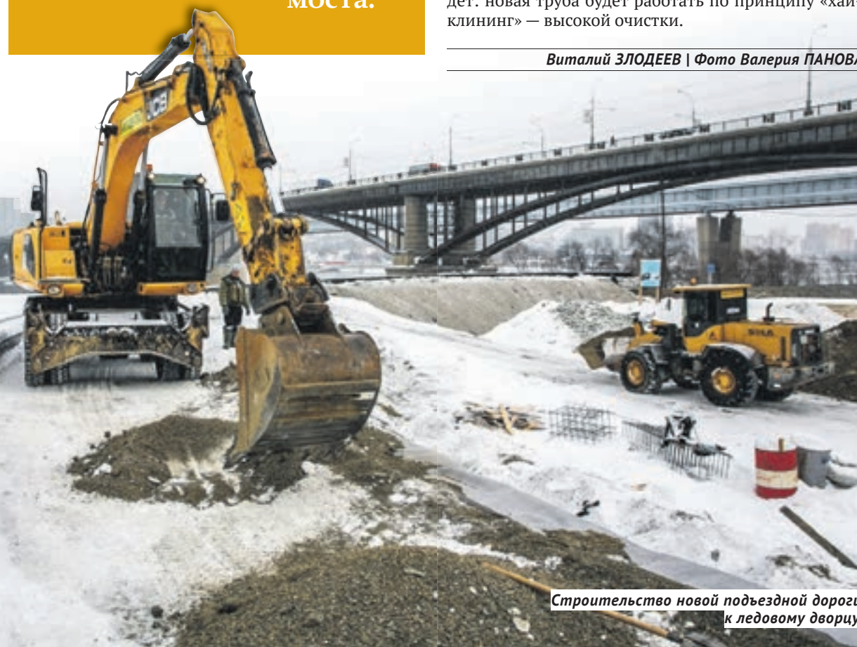
Строительство новой подъездной дороги к ледовому дворцу.

200 метров протяжённость подземного тоннеля, по которому коллектор будет проходить под дамбой Октябрьского моста.