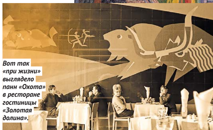
Вот так «при жизни» выглядело панно «Охота» в ресторане гостиницы «Золотая долина».