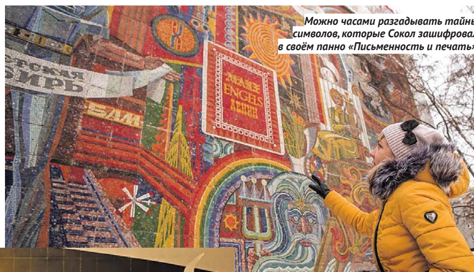
Можно часами разгадывать тайны символов, которые Сокол зашифровал в своём панно «Письменность и печать».

Как выяснилось, в 2014 году в ресторане «Золотая долина» была выполнена перепланировка, и панно демонтировали, так как не оно вписывалось в новую концепцию гостиничного общепита. А потом вдруг потерялось. Пятнадцатиметровая «Охота» исчезла. Как объяснили собственники ресторана, «во время ремонта подрядчики его