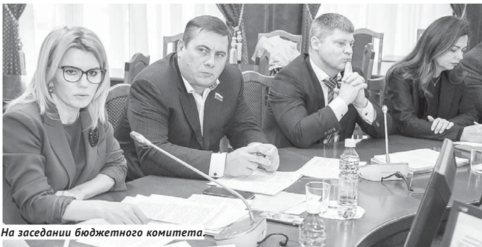
На заседании бюджетного комитета.

содержится недостоверная или неполная информация, есть ошибки, неточности и недостатки в заполнении граф, в результате не существует полностью достоверных данных о количестве объектов незавершенного строительства, сметной стоимости, а также объёмах бюджетных средств, необходимых для их завершения.