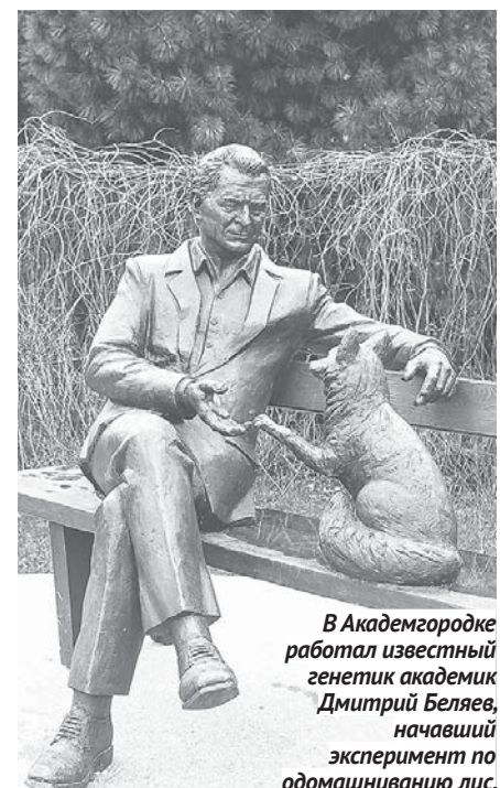
В Академгородке работал известный генетик академик Дмитрий Беляев , начавший эксперимент по одомашниванию лис.