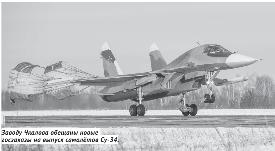
Заводу Чкалова обещаны новые госзаказы на выпуск самолётов Су-34.

Инвестиции в промышленность за первое полугодие составили 8,34 млрд рублей — это около 104% к прошлогодним цифрам. В числе компаний, реализующих крупные инвестиционные проекты — «Сибирский антрацит» с общим объёмом вложений за пять лет 17 млрд рублей. Продолжается реконструкция завода полупроводниковых приборов — в основном на средства федеральной программы. На Совете по инвестициям поддержан проект Новосибирского картонно-бумажного комбината — первый этап запущен в прошлом году, расска-