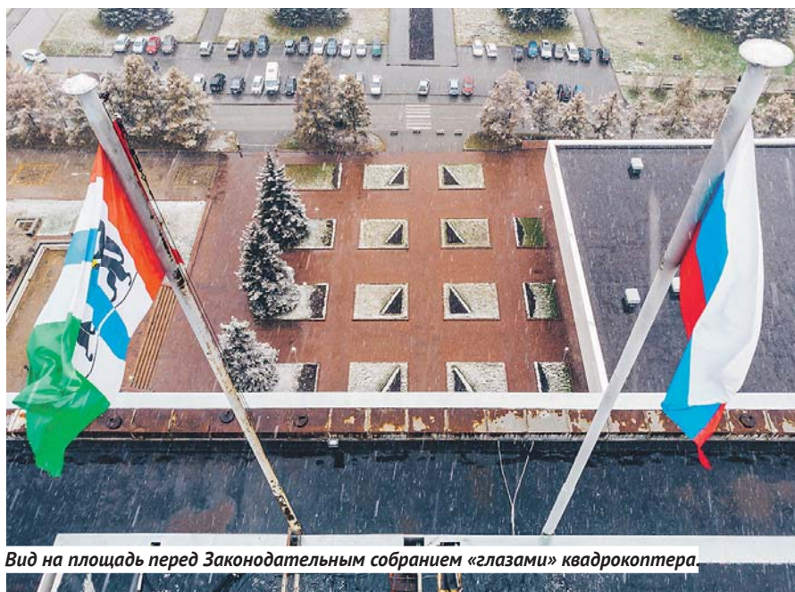
Вид на площадь перед Законодательным собранием «глазами» квадрокоптера.

Ежедневно выдаётся около 40 разрешений на полёты беспилотников. В 2018 году было зарегистрировано 6 нарушений использования воздушного пространства, а в 2019-м, который ещё не кончился, уже 12.