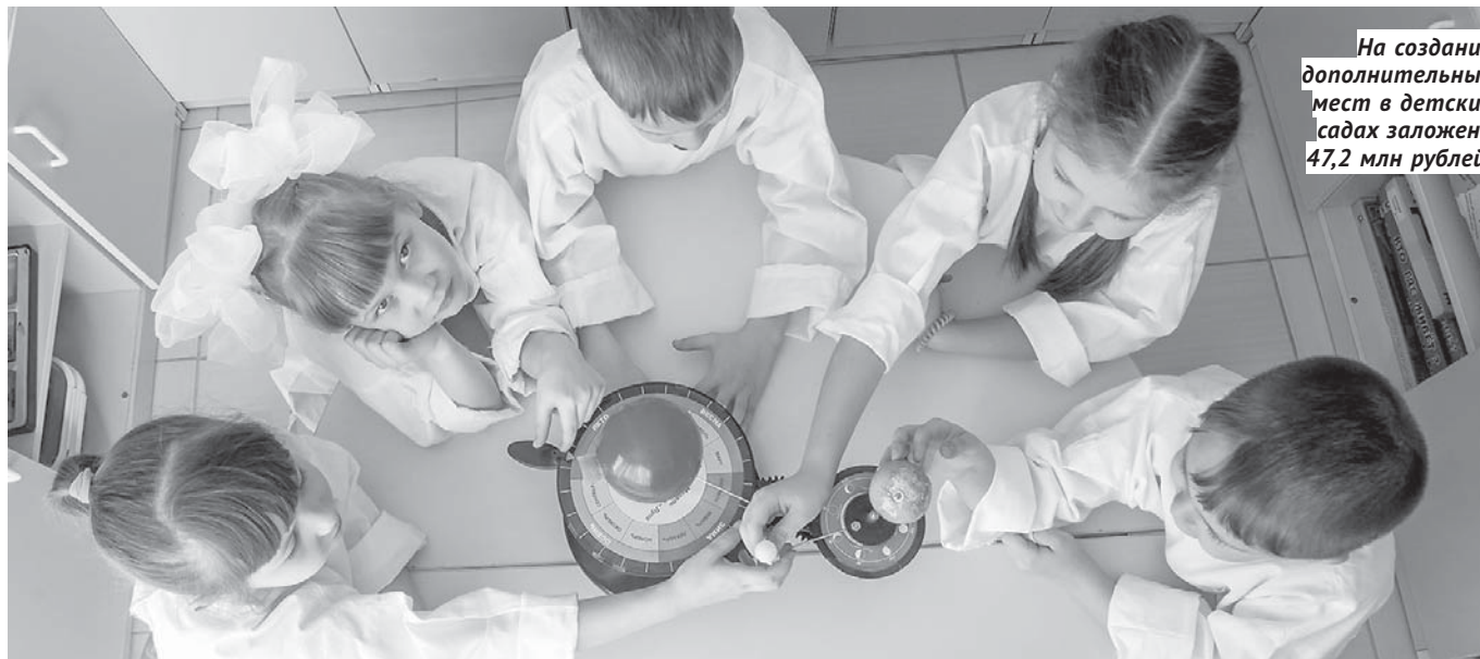
На создание дополнительных мест в детских садах заложено 47,2 млн рублей.

П араметры уже третьей в этом году корректировки областного бюджета представил на заседании регионального правительства министр финансов и налоговой политики области Виталий Голубенко . Он сделал акцент на необходимости принять изменения как можно скорее, так как часть средств предполагается направить на поддержку сферы ЖКХ для своевременной подготовки к зимнему сезону.