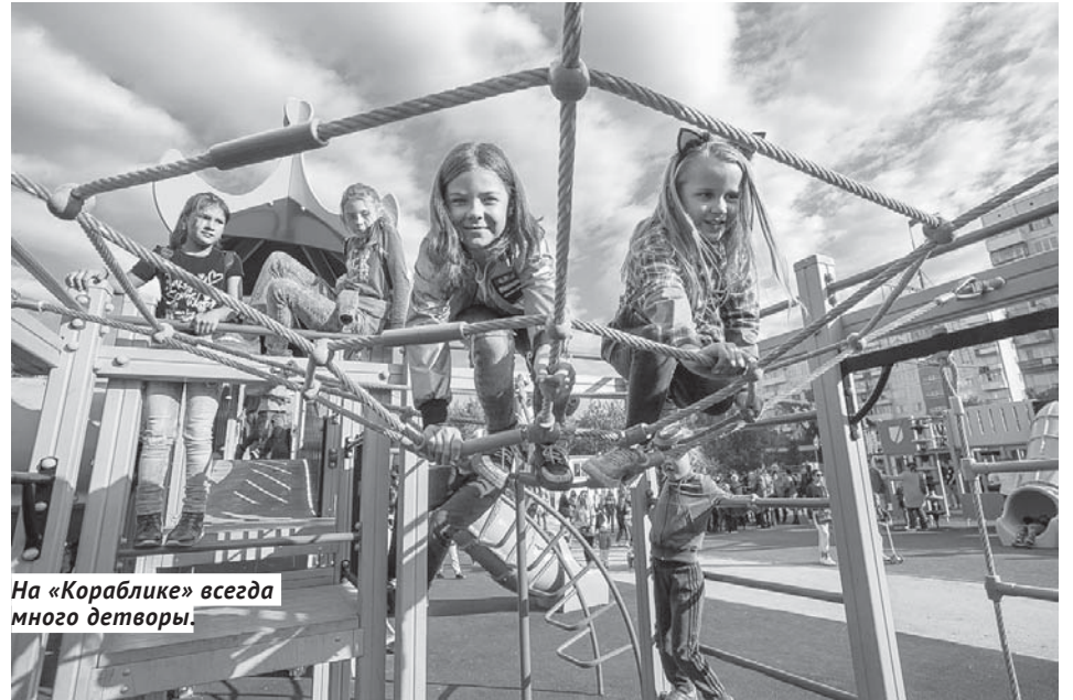
На «Кораблике» всегда много детворы.