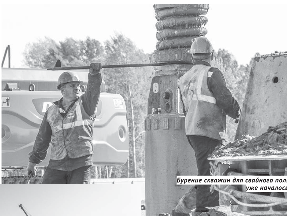
Бурение скважин для свайного поля уже началось.