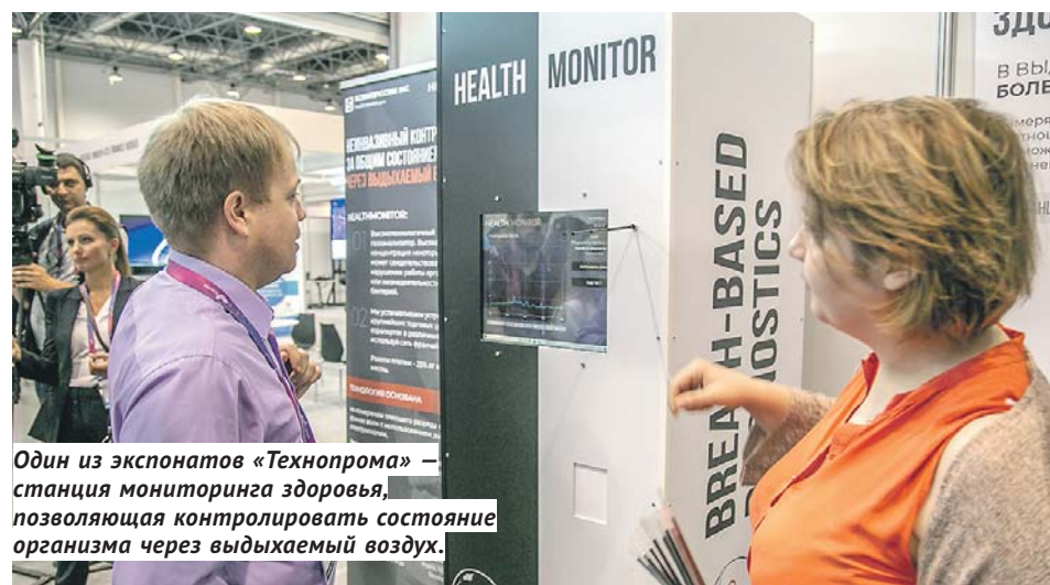
Один из экспонатов «Технопрома» — станция мониторинга здоровья, позволяющая контролировать состояние организма через выдыхаемый воздух.