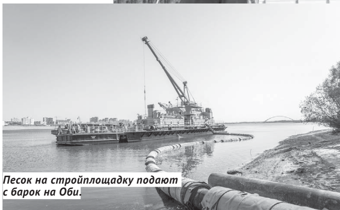
Песок на стройплощадку подают с барок на Оби.

будущую арену, будет пробурено 1 500 скважин глубиной от 16 до 35 метров, в зависимости от глубины залегания скальной плиты, в которую каждая скважина будет заходить минимум на метр, — рассказал Андрей Кокорин. — Потом в скважины будут вставляться металлические свайные каркасы диаметром от 60 до 80 сантиметров, в них будет заливаться бетон. Такое свайное поле выдержит всю проектную нагрузку