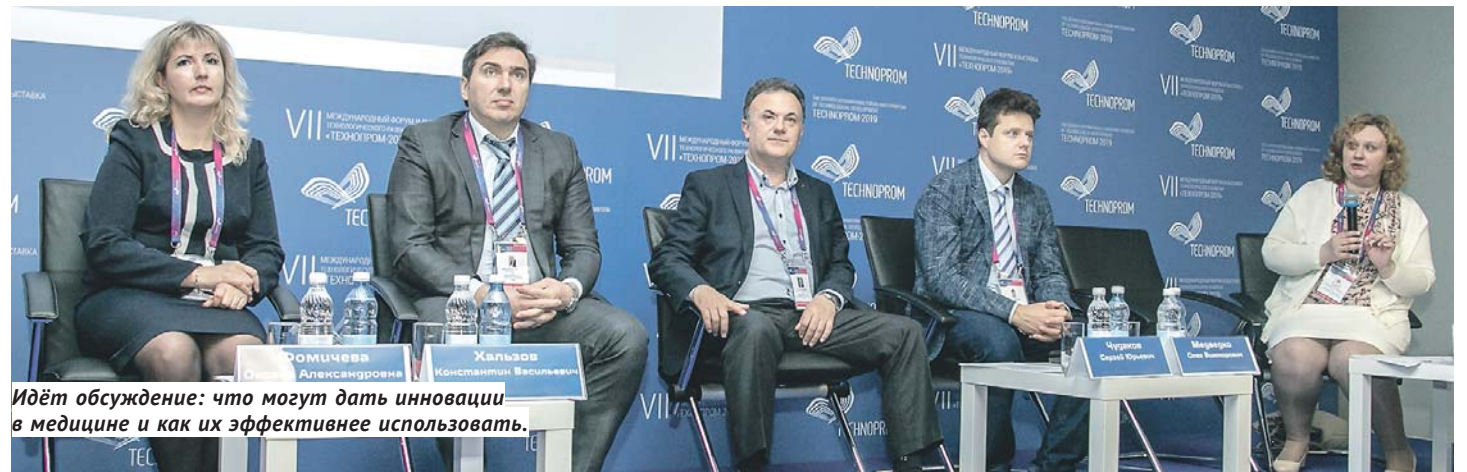
Идёт обсуждение: что могут дать инновации в медицине и как их эффективнее использовать.