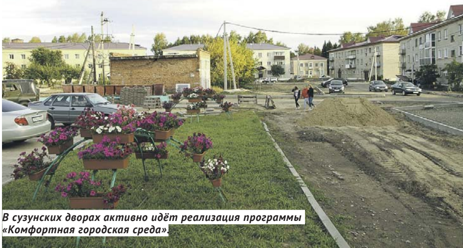
В сузунских дворах активно идёт реализация программы «Комфортная городская среда».

детскую площадку и другие элементы благоустройства. Как сказал спикер заксобрания, работа в этом направлении на округе будет продолжаться и в будущем.