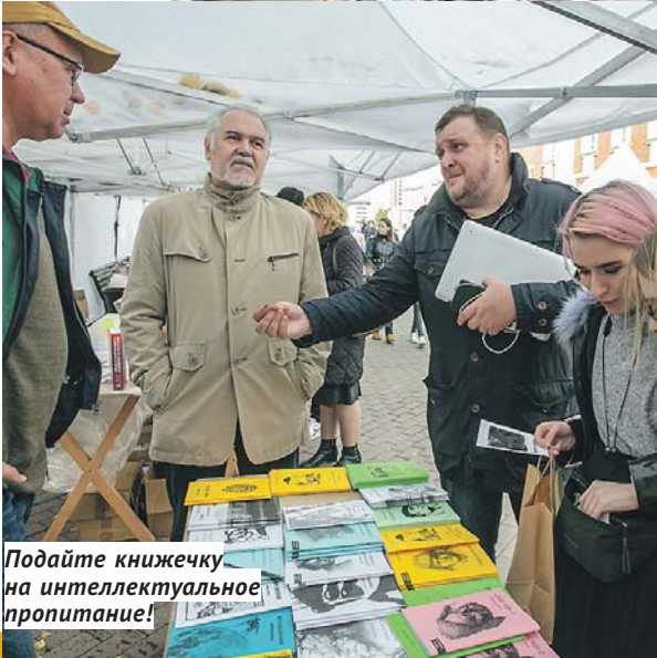
Подайте книжечку на интеллектуальное пропитание!