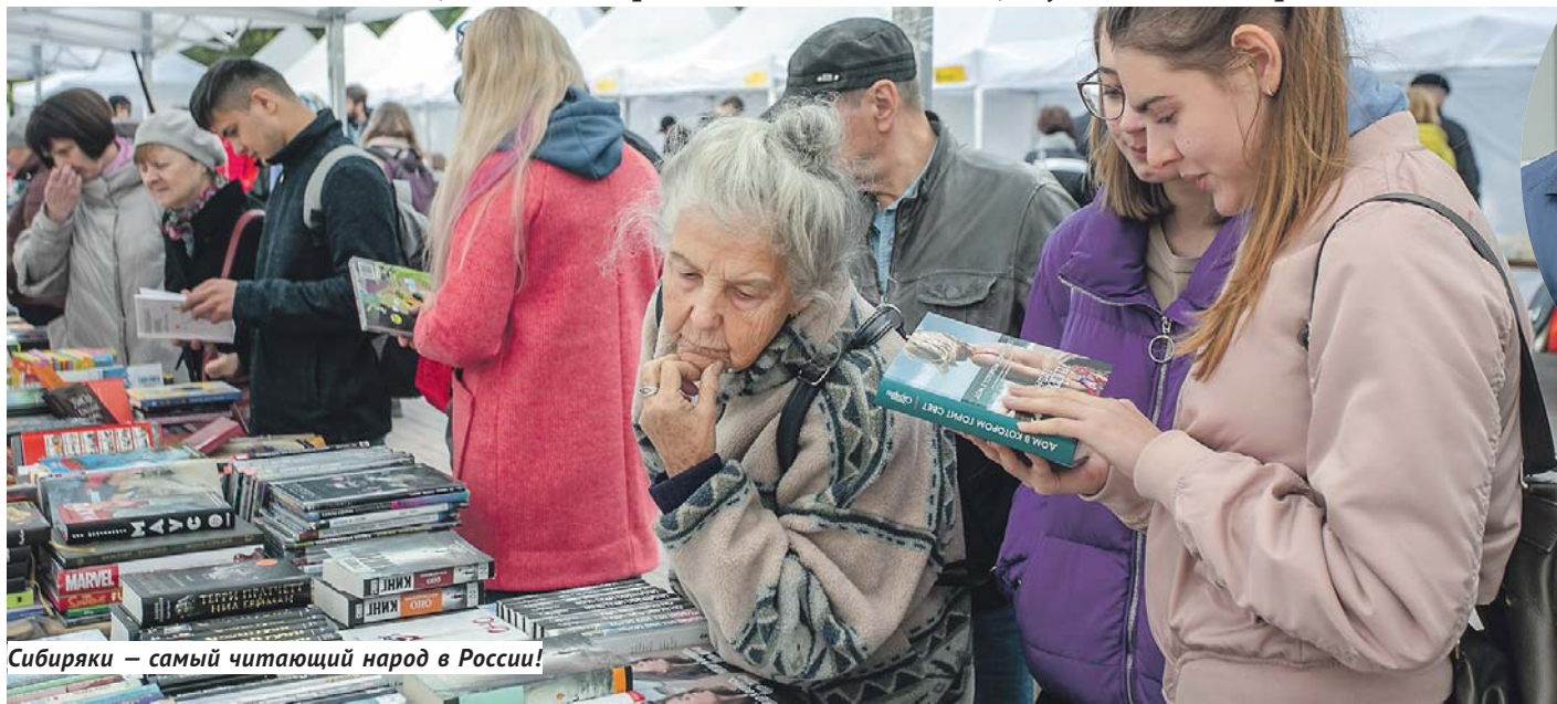
Сибиряки — самый читающий народ в России!

Два литературных фестиваля, «Книжная Сибирь» и «Новая книга», показали, что сибиряки любят читать, думать и спорить.