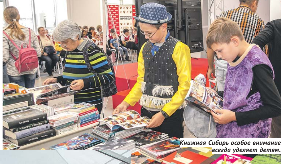
Книжная Сибирь особое внимание всегда уделяет детям.

Лектории жгли. В этом году молодыми голосами звучали последние тренды в литературе и обществе: авторы, журналисты, критики, режиссёры