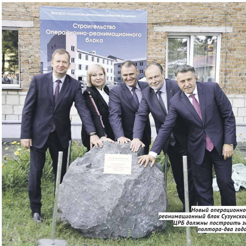
Новый операционно-реанимационный блок Сузунской ЦРБ должны построить за полтора-два года.