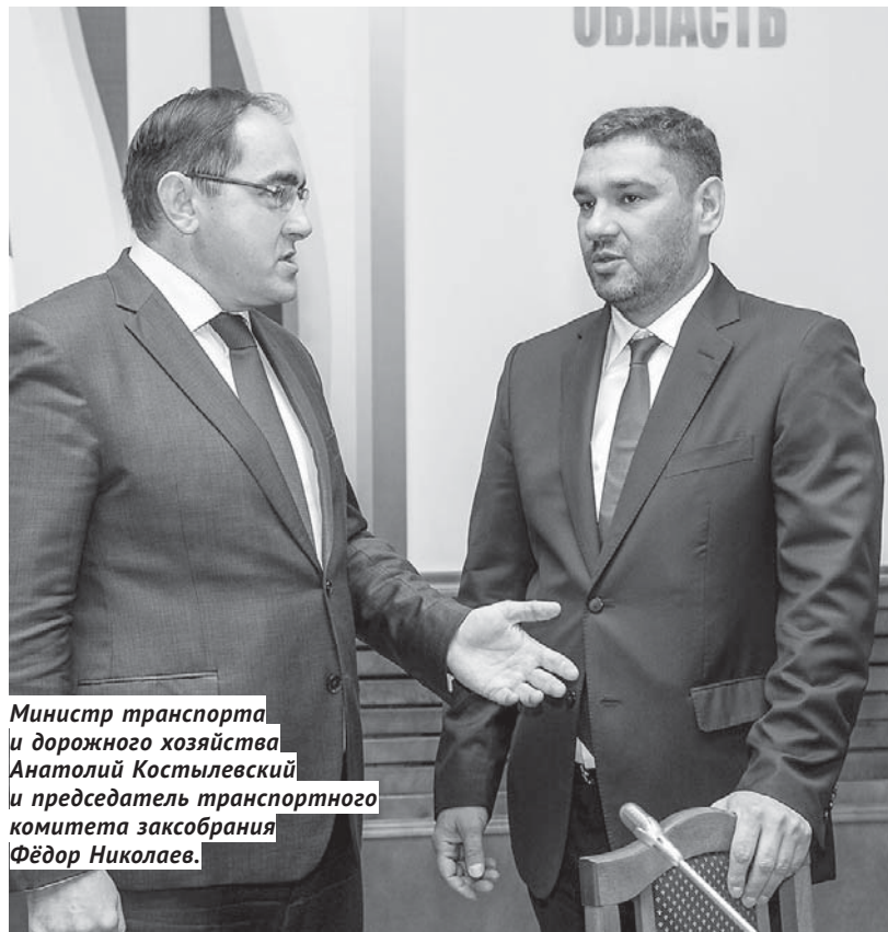
Министр транспорта и дорожного хозяйства Анатолий Костылевский и председатель транспортного комитета заксобраний Фёдор Николаев .

В ДВУХ ЧТЕНИЯХ Благодарность Законодательного собрания теперь будет иметь статус награды.