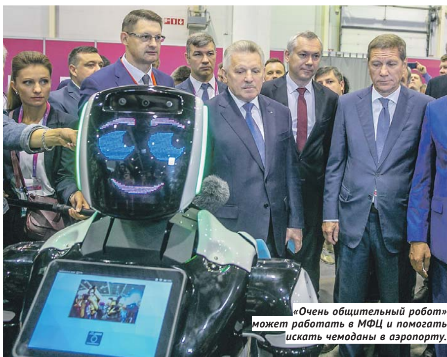
«Очень общительный робот» может работать в МФЦ и помогать искать чемоданы в аэропорту.

На торжественном открытии форума гостей приветствовали первый заместитель председателя Государственной думы Александр Жуков, полпред Президента РФ в Сибирском федеральном округе Сергей Меняйло, посол Беларуси в РФ Вла-