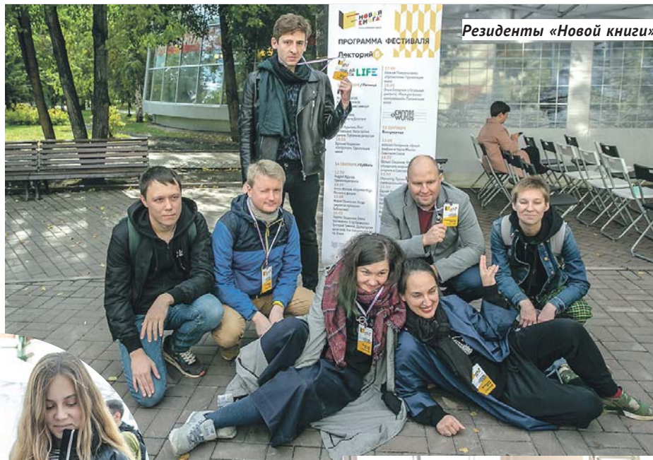
Резиденты «Новой книги».