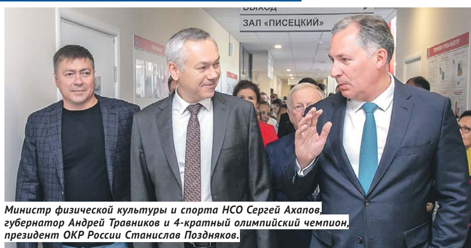
Министр физической культуры и спорта НСО Сергей Ахапов, губернатор Андрей Травников и 4-кратный олимпийский чемпион, президент ОКР России Станислав Поздняков.

— Открытие любого спортивного объекта, особенно современного, специализированного, — это важное со-