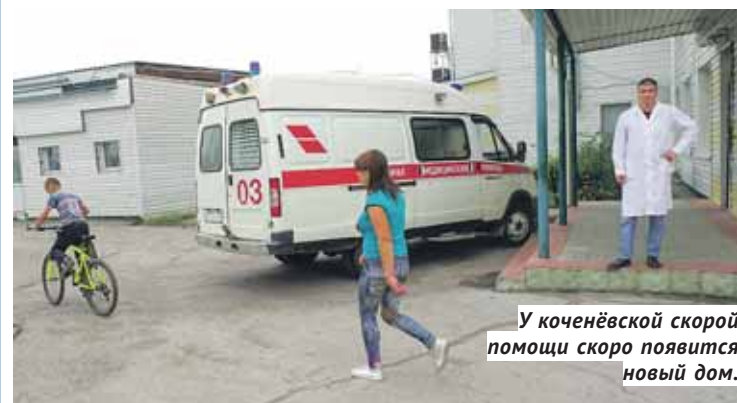
У коченёвской скорой помощи скоро появится новый дом.

Сейчас начнётся работа по оформлению проектно-сметной документации на реконструкцию зданий, чтобы долго затягивать с переездом врачам не пришлось.