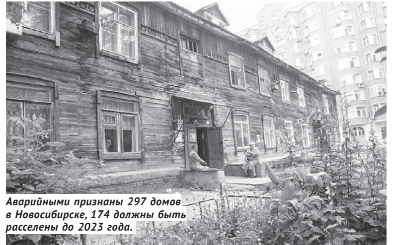
Аварийными признаны 297 домов в Новосибирске, 174 должны быть расселены до 2023 года.

Но бывают ситуации, когда архитектуру отдельных районов города могут изменить крупные федеральные или областные стройки. Как уже говорилось, многие садоводческие обществу в черте города в ближайшие годы останут-