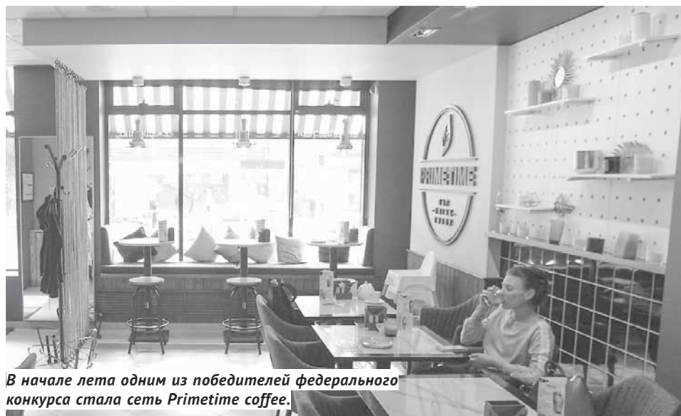
В начале лета одним из победителей федерального конкурса стала сеть Primetime coffee.

1 226,4 кв. м на 1 000 жителей (при федеральном нормативе в 552 метра) составляет обеспеченность населения торговыми объектами в Новосибирской области. В Новосибирске эта цифра превышает 1 500 квадратов.