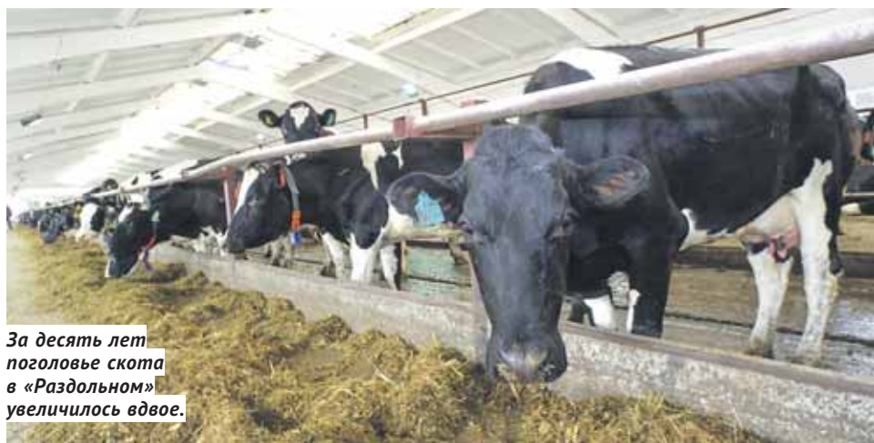
За десять лет поголовье скота в «Раздольном» увеличилось вдвое.

В то, что всего несколько лет назад в нынешнем офисе предприятия царил разоруха и обитали наркоманы, верится с трудом. А бывшее офисное здание новое руководство переделало под восьмиквартирный дом для специалистов (все-