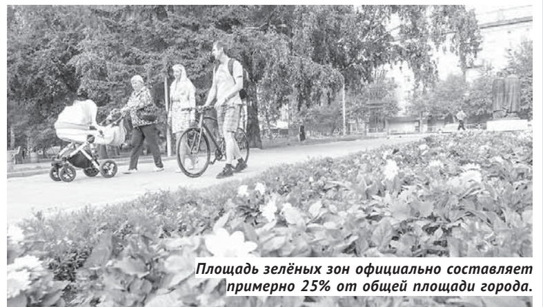
Площадь зелёных зон официально составляет примерно 25% от общей площади города.

— Многие воспринимают генеральный план города как некую цель, конечный результат развития, — отметил Локоть . — На самом деле генплан — всего лишь инструмент реализации Стратегии развития Новосибирска до 2030 года. Актуализация генплана проводится с целью определения этапности и приоритетности задач развития. К примеру, мы видим, что если в течение ближайших двух-трёх лет мы не займёмся строительством развязки на Бердском шоссе в районе Матвеевки, то там наступит вскоре полный транспортный коллапс. Как и на площади Маркса, с инфраструктурой вокруг которой необходимо что-то решать — прежде всего, чтобы там было нормальное движение. Я назвал только два примера, но их по городу десятки, и в новой редакции генплана они должны быть расставлены по этапам.