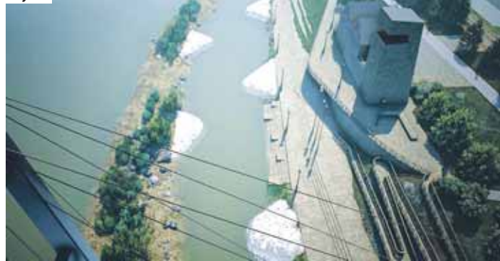
Гребной канал и здание гребного клуба.