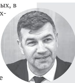
Андрей Гончаров, министр промышленности, торговли и развития предпринимательства Новосибирской области:

— У нас в области, к счастью, давно не было неприятных инцидентов, массовых отравлений, связанных с качеством продуктов питания, — сказал Андрей Гончаров. — Но у людей всё больше растёт запрос на чистые, натуральные, можно сказать, честные продукты. В том числе и поэтому по поручению губернатора Новосибирской области Андрея Травникова региональный минпромторг приступил к реализации пилотного проекта «Сделано у нас», в рамках которого планируется объединить сотни новоси-