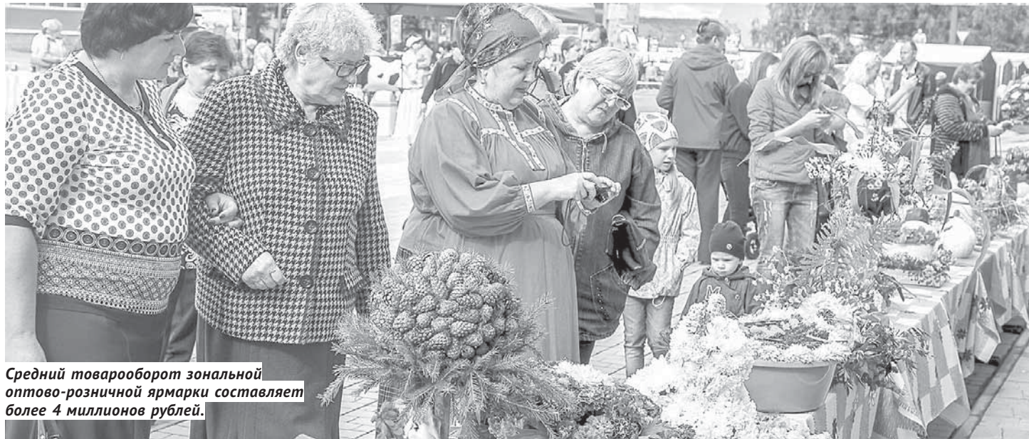
Средний товарооборот зональной оптово-розничной ярмарки составляет более 4 миллионов рублей.

Если рекламу принято считать двигателем торговли (оказывается, это крылатое выражение ещё в XIX веке придумал малоизвестный российский предприниматель Людвиг Метцель ), то торговлю можно назвать двигателем если не всего, то очень многих крупнейших сфер экономики. Логистика и транспорт, пищевая промышленность и строительство, банковский сектор и даже высокие технологии. Людей, торгующих и кормящих нас, мы видим ежедневно и по многу раз: порой, кажется, что город — это один большой магазин или рынок. В принципе, мы недалеко от истины.