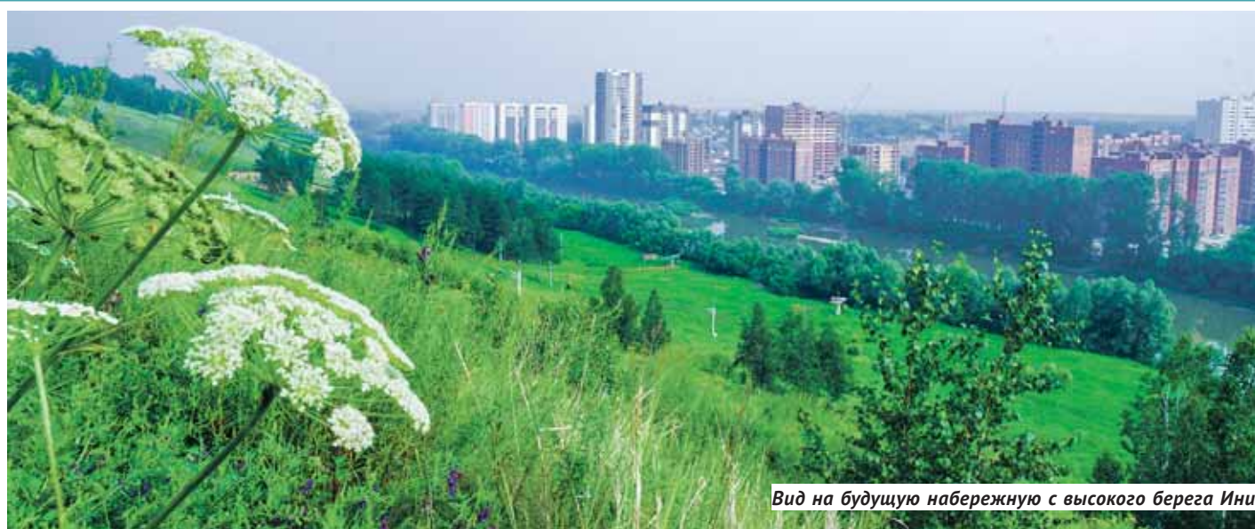
Вид на будущую набережную с высокого берега Ини.

ПРОЕКТ Как преобразится набережная реки Иня в Первомайском районе? Завершилось общественное обсуждение дизайн-проекта.