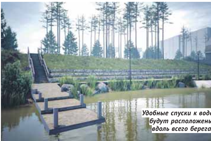
Удобные спуски к воде будут расположены вдоль всего берега.