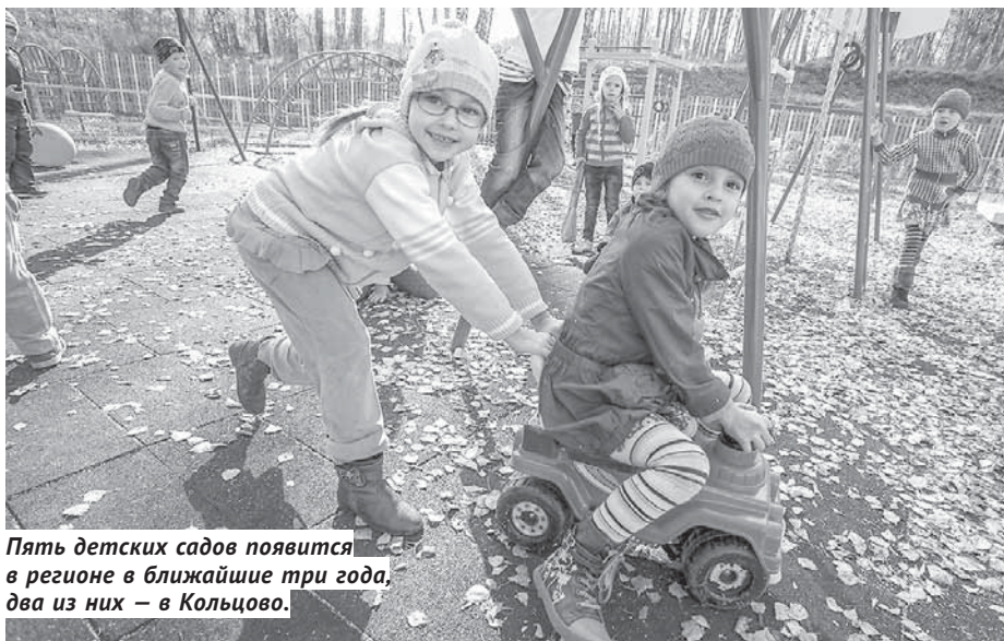
Пять детских садов появится в регионе в ближайшие три года, два из них — в Кольцово.

Стоимость работ, которые планируется выполнить в 2019 году, — 340 млн рублей. За три первых года, с 2019-го по 2021-й, на совершенствование дорожной инфраструктуры предполагается направить более 1,6 млрд рублей. Затем ожидается постоянное увеличение финансирования — с 2,5 млрд в 2022 году до 15,3 млрд в 2024-м. А с 2025-го по 2030 год область планирует потратить на дорожные проекты 70,6 млрд рублей. Наиболее затратным объектом должен стать Юго-западный транзит стоимостью около 65 млрд рублей. Как сообщил Анатолий Костылевский, разработка проектно-сметной документации для реализации этого знакового для региона проекта должна быть проведена в 2021—2023 годах.