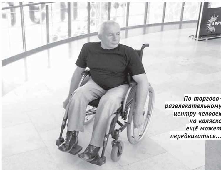
По торговле-развлекательному центру человек на коляске ещё может передвигаться...