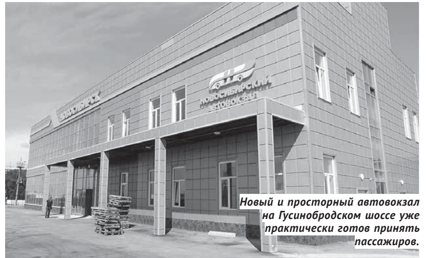
Новый и просторный автовокзал на Гусинобродском шоссе уже практически готов принять пассажиров.

Буквально за забором, пока оголаживающим территорию, полным ходом идёт реконструкция и