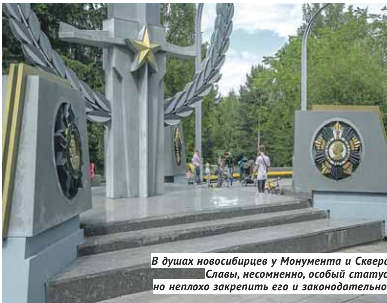
В душах новосибирцев у Монумента и Сквера Славы, несомненно, особый статус, но неплохо закрепить его и законодательно.

Новосибирская общественная организация «Память сердца»