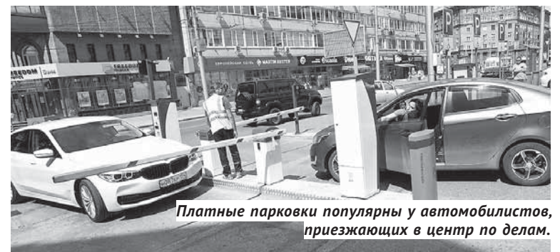
Платные парковки популярны у автомобилистов, приезжающих в центр по делам.

— Сама организация работы таких платных парковок радует и