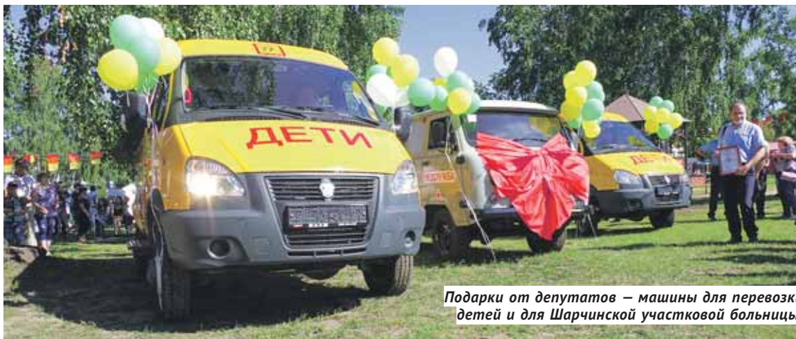
Подарки от депутатов — машины для перевозки детей и для Шарчинской участковой больницы.