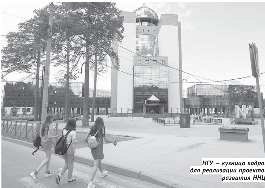
НГУ – кузница кадров для реализации проектов развития ННЦ.