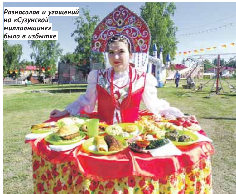
Разносолов и угощений на «Сузунской миллионщине» было в избытке.