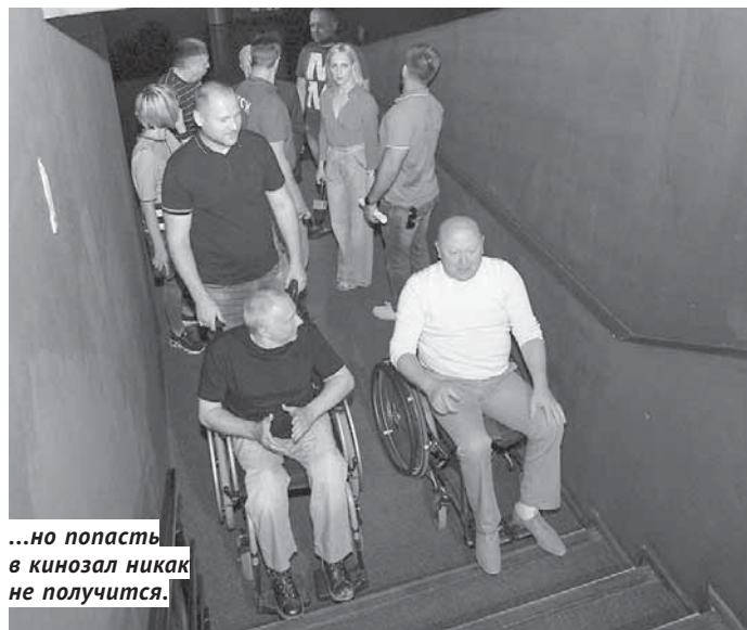
...но попасть в кинозал никак не получится.

До общества наконец-то «дошло», что люди в инвалидной коляске имеют право на полноценную жизнь, в которой есть место обычным тихим радостям — общению с друзьями в уютном кафе или походу в кинотеатр. Но, как показывает практика, если в кафе человек в коляске худо-бедно чувствует себя как все, то кино в Новосибирске ему точно не светит.