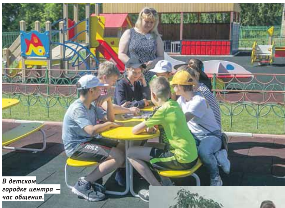
В детском городке центра — час общения.

«Мы не можем покупать обычные продукты, потому что они убивают нас. А товары с пометкой «Без глютена», которые представлены на российском рынке, произведены в странах ЕС и стоят дорого. Обеспечение безглютеновым питанием детей с диагнозом «целиакия» в школах и детсадах практически отсутствует из-за сложности в обеспечении чистоты приготовления. Требуется наличие отдельной посуды, оборудования и мест для приготовления, чтобы полностью исключить возможность попадания в еду глютена. Однако даже незначительное загрязнение