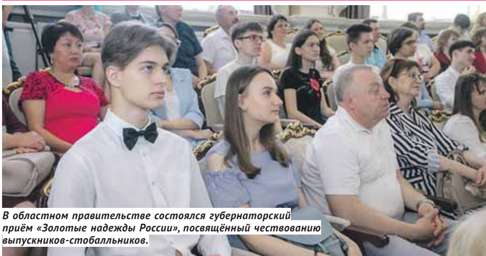
В областном правительстве состоялся губернаторский приём «Золотые надежды России», посвящённый чествованию выпускников-стобалльников.