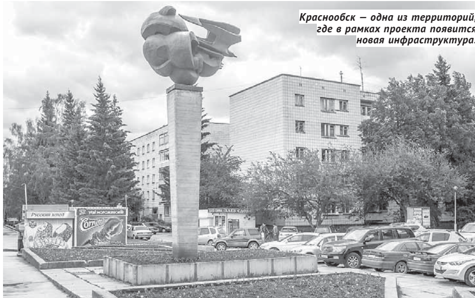
Краснообск — одна из территорий, где в рамках проекта появится новая инфраструктура.