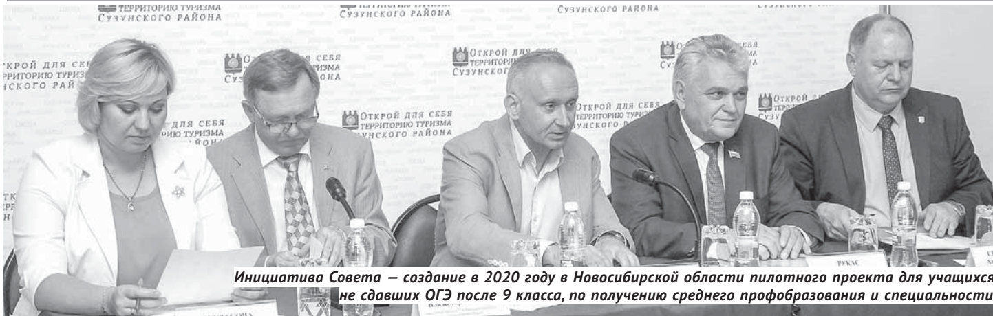
Инициатива Совета — создание в 2020 году в Новосибирской области пилотного проекта для учащихся, не сдавших ОГЭ после 9 класса, по получению среднего профобразования и специальности.

Уникальность практически каждого заседания Совета по взаимодействию Законодательного собрания с представительными органами муниципальных районов и городских округов Новосибирской области заключается в том, что вопросы, на первый взгляд, касающиеся сотен людей, в итоге становятся основами для решений, распространяющихся на всю область. Очередная встреча областных и муниципальных депутатов в Сузуне только подтвердила это.