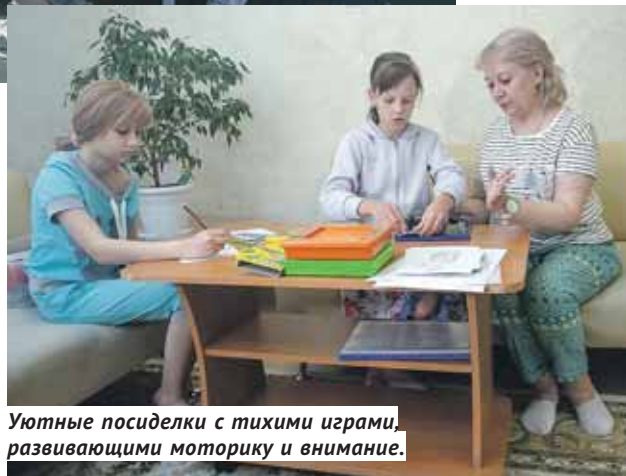
Уютные посиделки с тихими играми, развивающими моторику и внимание.

В год «Морской залив» принимает до 1000 детей, а попасть сюда может любой житель области — по направлению центра соцзащиты по месту жительства. Сегодня подобных реабилитационных центров в России нет — соседние регионы ещё не готовы к такой ответ-