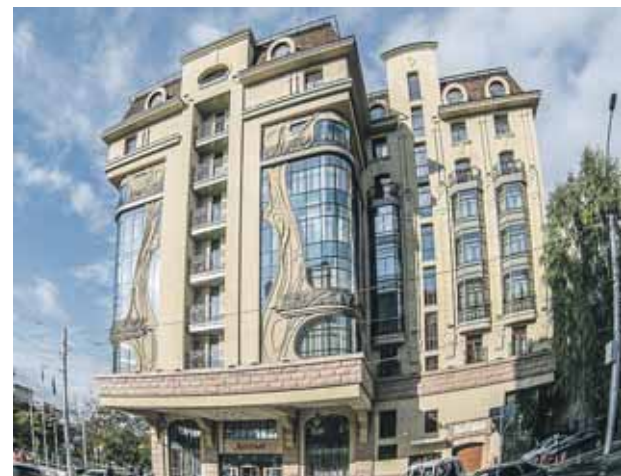
Подготовила Татьяна МАЛКОВА

Более мелкие отели должны пройти сертификацию до июля 2021 года.