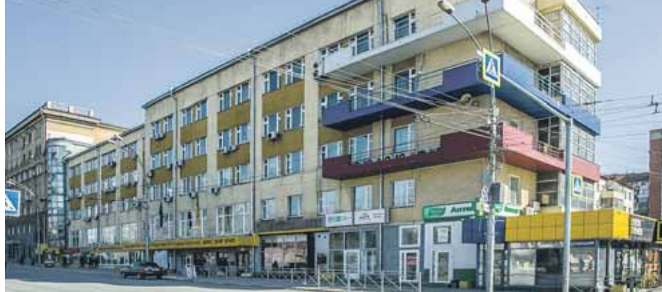
Гостиница «Динамо» входит в комплекс зданий на углу Красного проспекта и улицы Октябрьской.