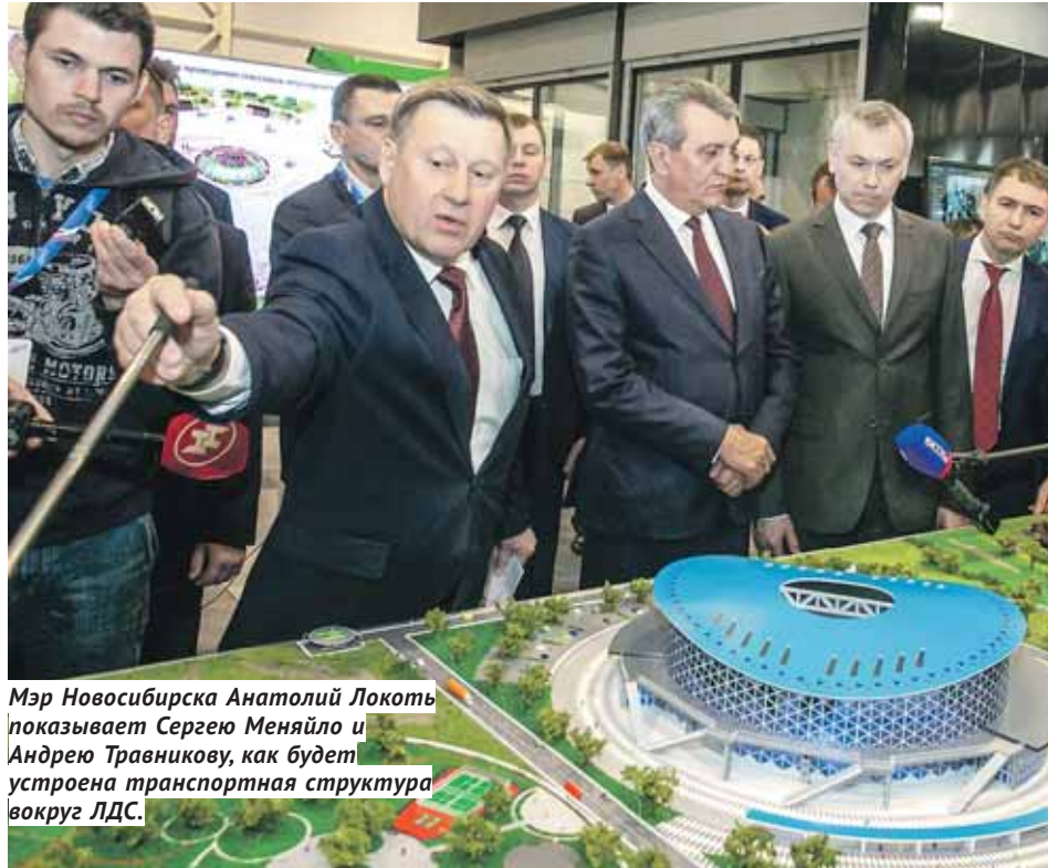
Мэр Новосибирска Анатолий Локоть показывает Сергею Меняйло и Андрею Травникову, как будет устроена транспортная структура вокруг ЛДС.

Полпред также отметил, что, помимо «физической» реализации БКАД в виде построенных и отремонтированных дорог, необходимо развивать и организацию движения. Это существенно дешевле, чем строительство, но не менее важно для функционирования всего дорожно-транспортного комплекса. Применительно к Сибири Сергей Меняйло посоветовал обратить особое внимание на использование внутренних судоходных путей, которые сегодня практически не задействованы. При этом перевозка грузов как морским, так и речным транспортом существенно дешевле доставки по железной дороге и автотранспортом.