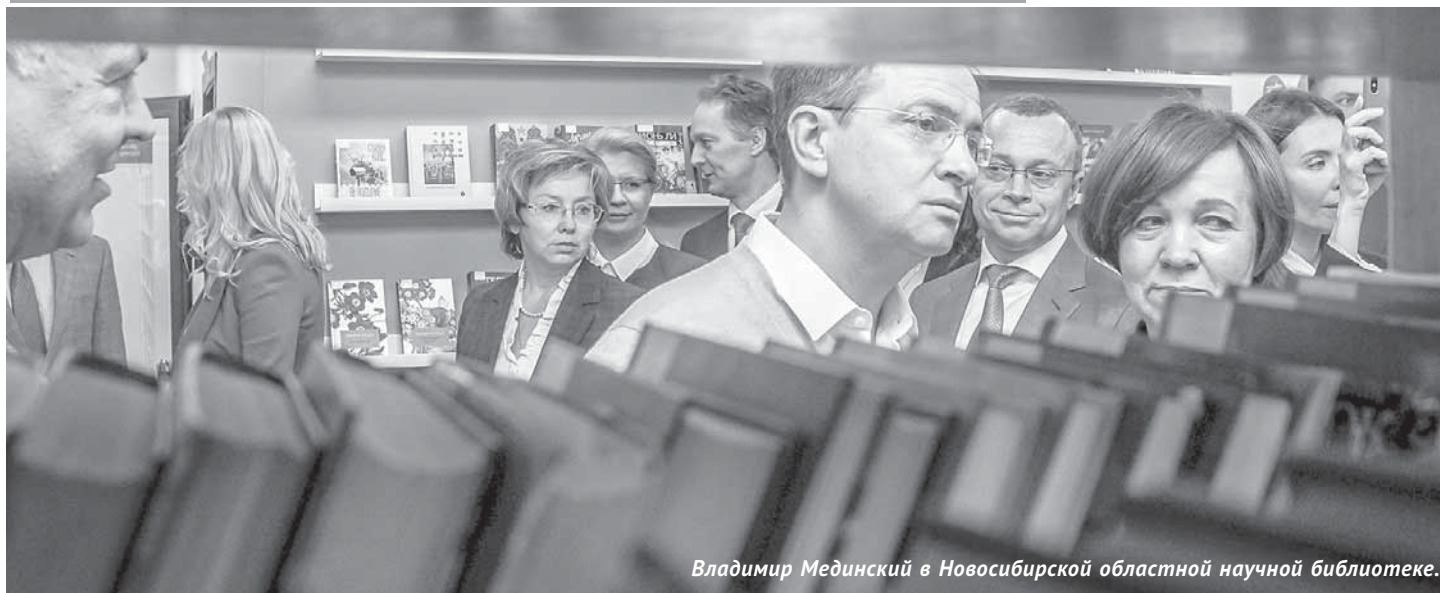
Владимир Мединский в Новосибирской областной научной библиотеке.