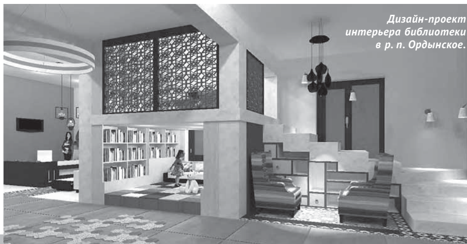
Дизайн-проект интерьера библиотеки в п. Ордынское.

Около ста лет назад, в 1920-е годы, в советской стране повсеместно создавались избы-читальни, призванные бороться с повальной неграмотностью, — это было частью культурной революции. На международной выставке в Париже в 1925 году «Красный павильон» Константина Мельникова и «Рабочий клуб» художника Александра Родченко произвели настоящий фурор. В основе идеальной избы-читальни лежал принцип экономии про-