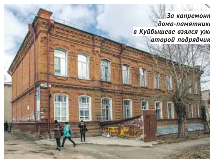
За капремонт дома-памятника в Куйбышеве взялся уже второй подрядчик.