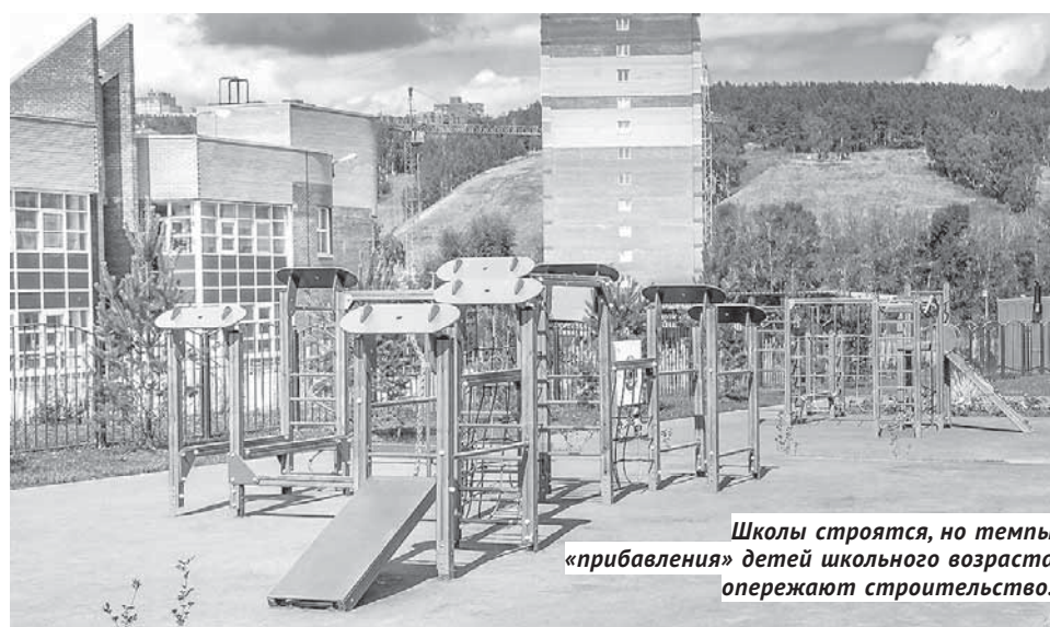
Школы строятся, но темпы «прибавления» детей школьного возраста опережают строительство.

Особое внимание в нашем регионе уделено развитию системы подготовки к самостоятельной жизни воспитанников детских домов и интернатов — в рамках сотрудничества с Фондом поддержки детей, находящихся в трудной жизненной ситуации. Совместно с фондом в 2018 году был создан региональный ресурсный центр по подготовке к самостоятельной жизни выпускников детских домов на базе «Центра развития семейных форм устройства детей-сирот и детей, оставшихся без попечения родителей». В настоящее время на базе всех организаций для детей-сирот и детей, оставшихся без попечения