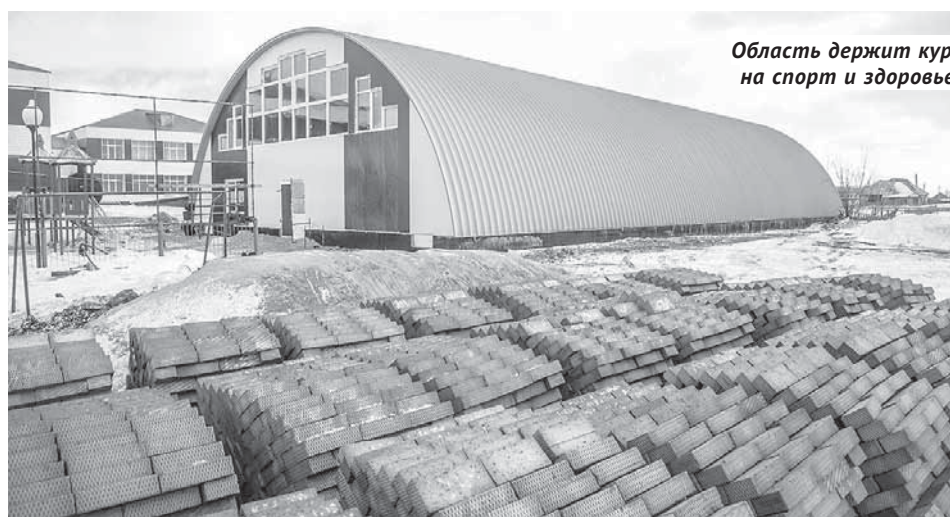
Область держит курс на спорт и здоровье.

Подготовила Наталья ДМИТРИЕВА