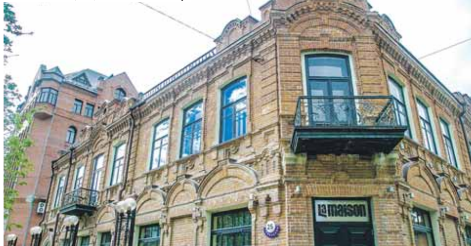
Ресторанные традиции в доме по Советской, 25, живы до сих пор.

Одним из первых предприятий общепита на правом берегу можно считать переселенческий врачебно-питательный пункт с собственной кухней, созданный в 1893 году на месте нынешней железнодорожной больницы. Он не сохранился — в отличие от здания бывшей столовой Красных казарм на улице Владимировской, построенного в 1902—1903 годах. В столовых казарм могло одновременно прокормиться до 2 000 солдат, перемещаемых с запада России на восток.