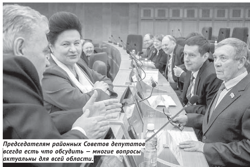
Председателям районных Советов депутатов всегда есть что обсудить — многие вопросы актуальны для всей области.