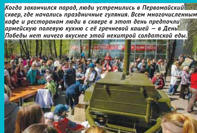
Когда закончился парад, люди устремились в Первомайский сквер, где начались праздничные гуляния. Всем многочисленным кафе и ресторанам люди в сквере в этот день предпочли армейскую полевую кухню с её гречневой кашей – в День Победы нет ничего вкуснее этой нехитрой солдатской еды.

Больше фото с празднования Дня Победы – на сайте ведомостинсо.рф