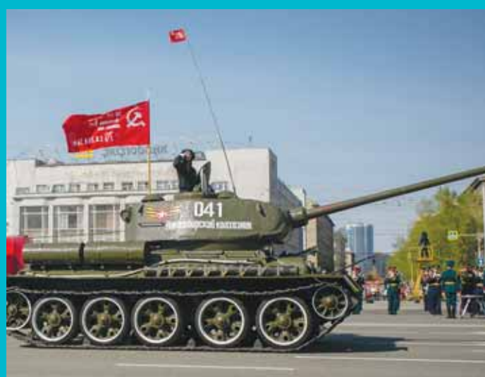
Затем на площадь выехала техника – от легендарной «тридцатьчетвёрки» до самых современных машин.