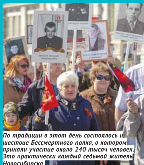
По традиции в этот день состоялось шествие Бессмертного полка, в котором приняли участие около 240 тысяч человек. Это практически каждый седьмой житель Новосибирска.