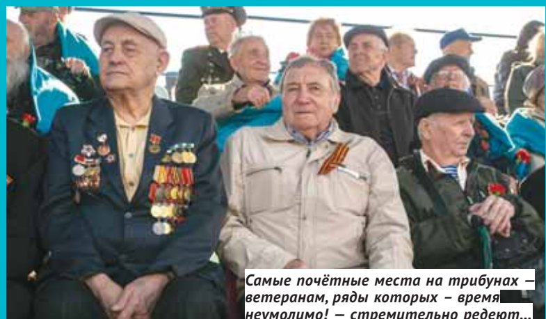
Самые почётные места на трибунах – ветеранам, ряды которых – время неумолимо! – стремительно редеют...