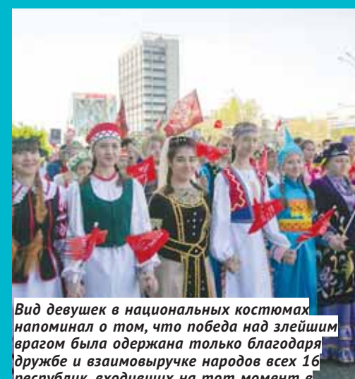
Вид девушек в национальных костюмах напоминал о том, что победа над злейшим врагом была одержана только благодаря дружбе и взаимовыручке народов всех 16 республик, входивших на тот момент в состав Советского Союза.