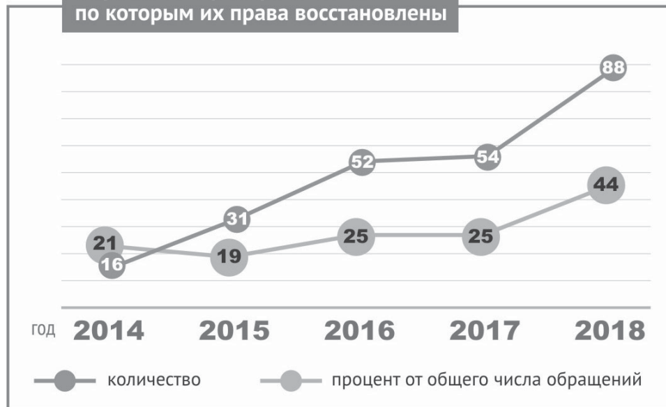
Обращения предпринимателей, по которым их права восстановлены

находится под стражей с сентября 2018 года. Ни следователь, ни суд не связывали инкриминируемое предпринимателю преступление с предпринимательской деятельностью. Уполномоченным были подготовлены письменный ответ обвиняемому с обоснованием связи деяния, в котором обвиняется предприниматель, с предпринимательской деятельностью, и обращение в адрес председателя Новосибирского областного суда. Адвокатом было заявлено ходатайство о приобщении мнения Уполномоченного к материалам дела, которое было удовлетворено судом. И 5 декабря мера пресечения предпринимателю была изменена на домашний арест.