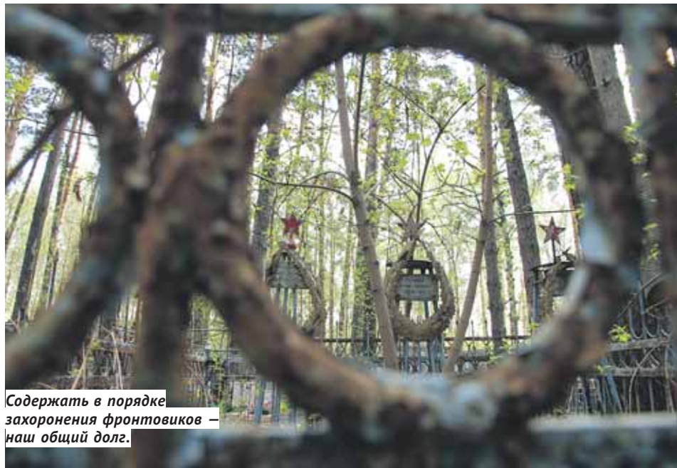
Содержать в порядке захоронения фронтовиков — наш общий долг.

той на кладбище занялись только в 2008 году. «Все данные о воинских могилах сверяются с военкоматом и вносятся в реестр, этим занимается специалист в отделе мэрии. Уже в этом году все воинские могилы будут отображены