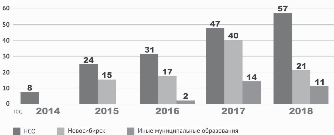
Количество правовых актов и их проектов, рассмотренных в аппарате Уполномоченного

земельного участка. Павильон находился в плачевном состоянии, и купивший его предприниматель сделал в нём ремонт, открыл там ресторан, благоустроил территорию. В августе 2017 года он внезапно получил из мэрии Новосибирска уведомление об одностороннем расторжении договора аренды – из-за самовольного переустройства временного объекта в объект капитального строительства. При этом экспертиза 2013 года показывала, что павильон капитальным сооружением не является. Закрытие ресторана повлекло бы потерю более 10 миллионов рублей инвестиций и увольнение более 30 сотрудников. Уполномоченный рекомендовал оспорить решение мэрии об отказе от исполнения договора в арбитражном суде. Суд в итоге признал этот отказ недействительным.