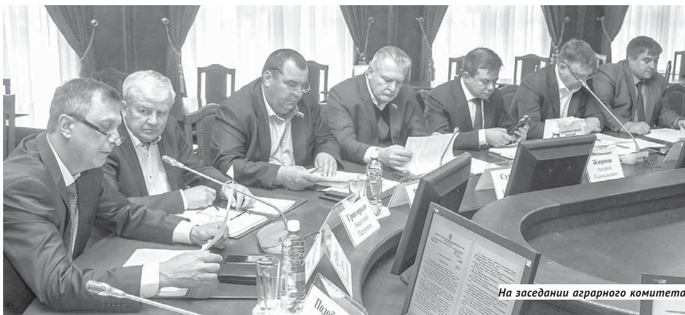
На заседании аграрного комитета.