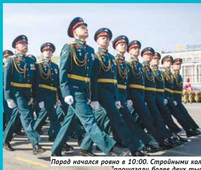
Парад начался ровно в 10:00. Стройными колоннами через площадь Ленина прошагали более двух тысяч военных.