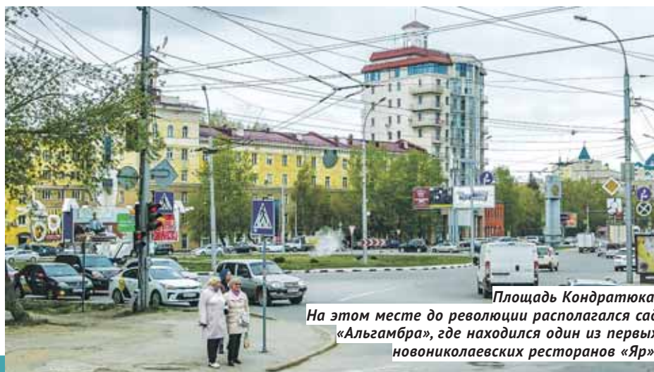
Площадь Кондратюка. На этом месте до революции располагался сад «Альгамбра», где находился один из первых новониколаевских ресторанов «Яр».

Подготовил Виталий СОЛОВОВ