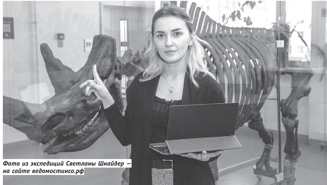
Фото из экспедиций Светланы Шнайдер — на сайте ведомостинсо.рф

— Это пошло ещё с тех времён, когда в создаваемый новосибирский Академгородок направили знаменитого археолога Алексея