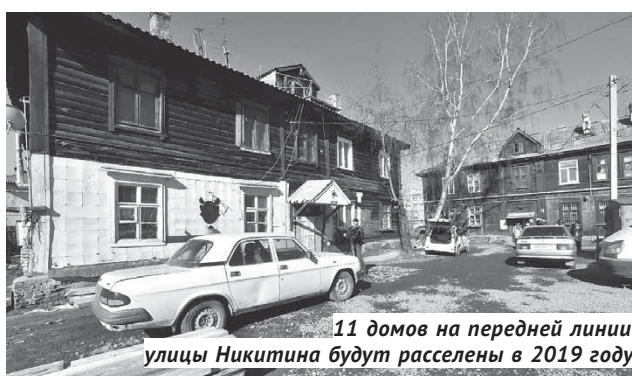
11 домов на передней линии улицы Никитина будут расселены в 2019 году.

Как только глава региона подъехал к дому №132 по улице Никитина, жители тут же окружили его и буквально засыпали вопросами: «Будут ли расселять наш дом?», «Где будет новая квартира?», «А какой площа-