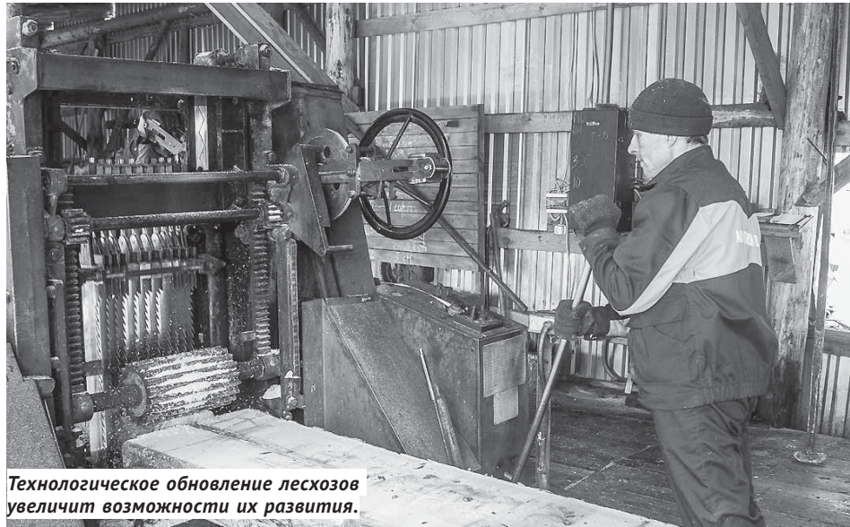
Технологическое обновление лесхозов увеличит возможности их развития.

— 17 из 21 лесхоза, существующих в области, в прошлом году сработали в плюс, получили хоть небольшую, но прибыль, — подчеркнул Рыжков. — Годом ранее их было всего 12. В Кыштовке, например, впервые за последние пять лет есть прибыль, Сузунский лесхоз вышел из процедуры банкротства и получил 16 миллионов прибыли. А производственная программа лесхозов на 2019 год позволяет надеяться, что по