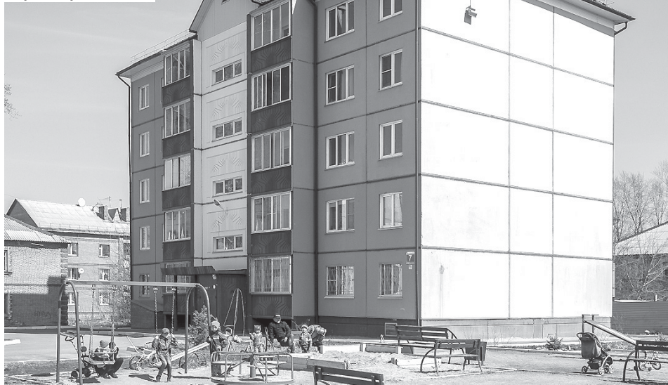
Тот самый двор на 2-й Ольховской, где производилось жертвоприношение.

нуты останавливаются, чтобы посмотреть на происходящее.