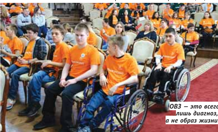
ОВЗ — это всего лишь диагноз, а не образ жизни.

В этом году работы участников оценивали 22 главных региональных эксперта и 118 экспертов по компетенциям — настоящие профессионалы своего дела, знающие, какие навыки должны проявлять соискатели. Вот, к примеру, в компетенции «Малярное дело» (а дело происходило на площадке Новосибирского центра профессионального обучения №1) школьникам-участникам надо было правильно наклеить обои (чтобы рисунок совместить!), а студентам ещё и оформить наклеенные обои модным декором. И здесь «советские варианты» не