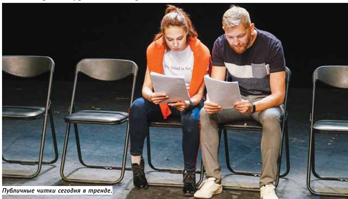
Публичные читки сегодня в тренде.

Как в Новосибирске искали пьесы на Международном конкурсе новой драматургии «Ремарка».