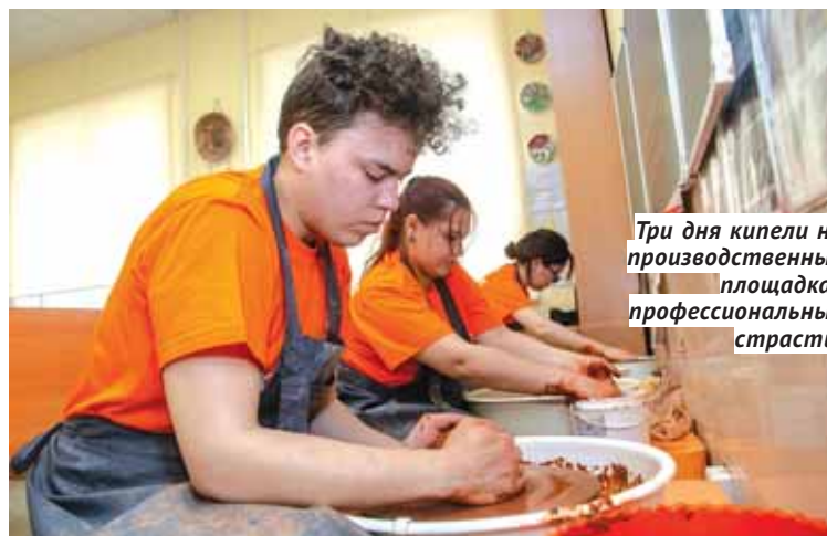
Три дня кипели на производственных площадках профессиональные страсти.

проходили: надо было и модную цветовую гамму выбрать, и стрелянку с учётом техники безопасности установить, и инструментарий в чистоте содержать. За 100 баллов пришлось попотеть изрядно, творческую мысль проявить и в отведённое время уложиться. Эксперты считают, что такие «военные условия» соискателям только на пользу идут: а кто сказал, что на современном рынке труда легко? Понятное дело, что таким мастерством в одиночку не овладеешь — учителя хорошие нужны.