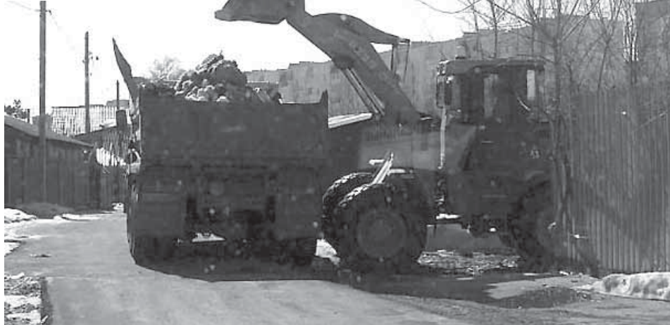
Вывоз свалки бараньих останков с ул. Высоцкого.