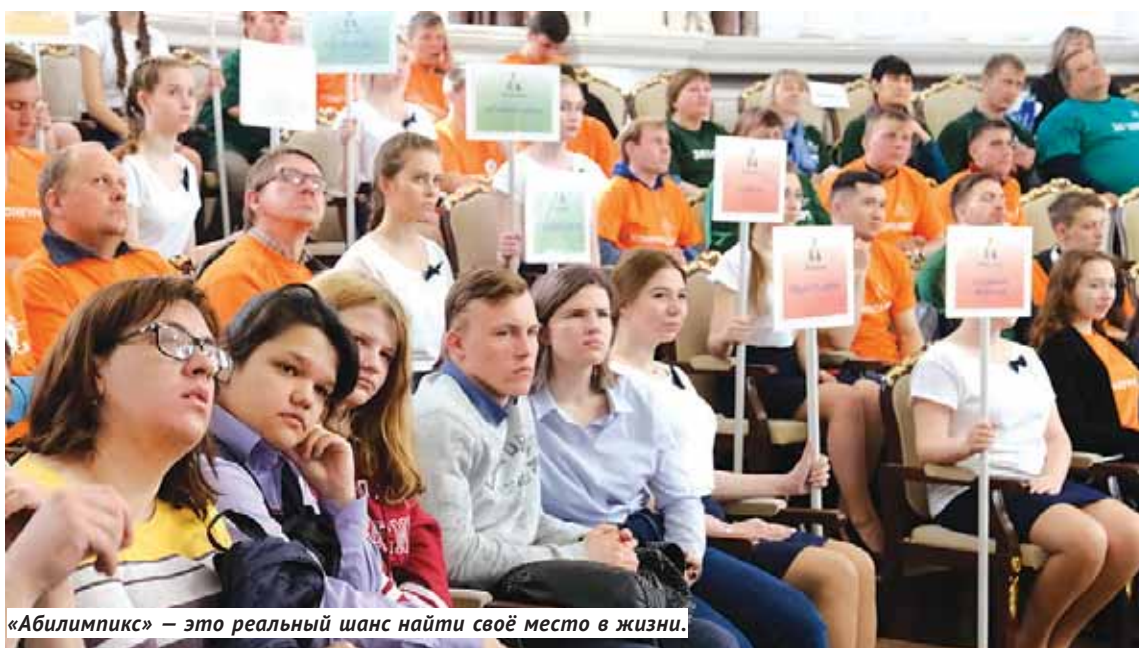
«Абилимпикс» — это реальный шанс найти своё место в жизни.

В этом году конкурс значительно расширил свои тематические границы, предоставив участникам возможность попробовать себя во многих направлениях: от кирпичной кладки и поварского дела до медицинского и социального ухода, от бисероплетения и социальной работы до веб-дизайна. Новичками в «Абилимпиксе» стали студийные фотографы, гончарных дел мастера, художники-прикладники, повара и мастера маникюра — многие из участников уже работают на себя, покоряя большой социум.