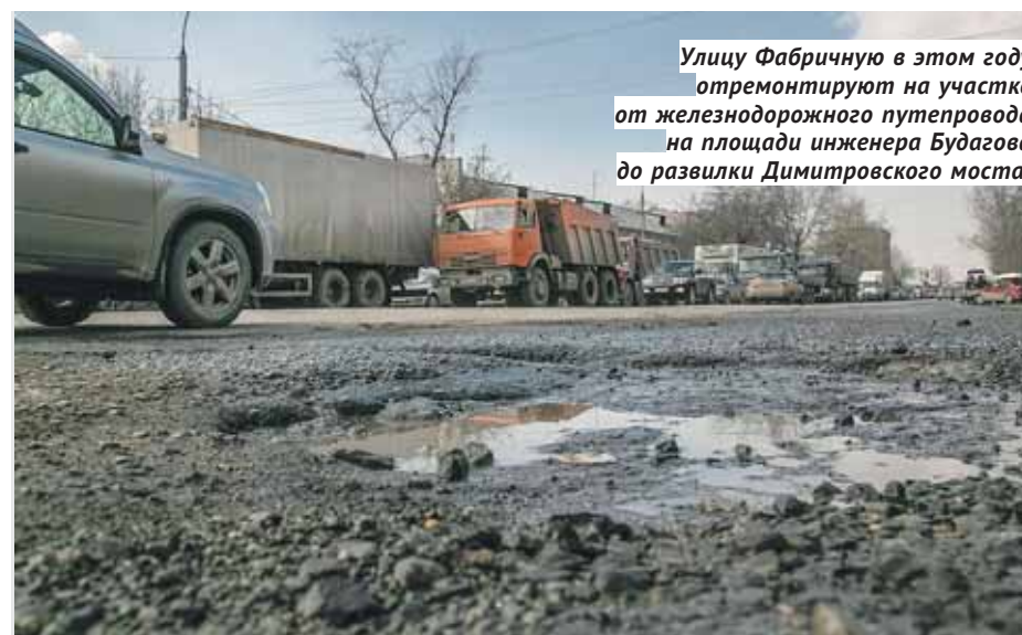
Улицу Фабричную в этом году отремонтируют на участке от железнодорожного путепровода на площади инженера Будагова до развилки Димитровского моста.

количество очагов возникновения ДТП. Как отметил министр транспорта и дорожного хозяйства Новосибирской области Анатолий Костылевский , из этого вытекает и другая задача, поставленная президентом РФ, — снизить годовую смертность в ДТП с 13 до 4 человек на 100 тысяч населения. А вот в этом плане у нас ситуация наоборот лучше, чем в среднем по России: если в 2013 году смертность в ДТП в НСО составляла 23 человека на 100 тысяч жителей, то по итогам 2018 года — уже 10. Впрочем, уменьшать этот показатель необходимо как минимум в 2,5 раза. Это будет достигаться установкой новых камер фото- и видеofиксации нарушений, элементов безопасности на самих дорогах, интеллектуальных систем управления движением и многими другими средствами. Не случайно в названии нацпроекта именно слово «безопасные» находится на первом месте.