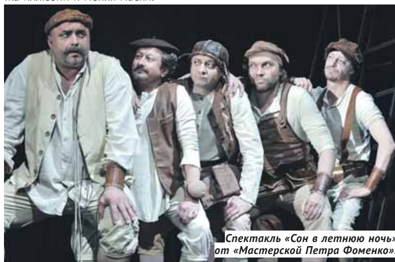
Спектакль «Сон в летнюю ночь» от «Мастерской Петра Фоменко».

ный факел». Спектакль удостоен «Золотой Маски» в 2016 году как «Лучший спектакль в драме, большая форма». Известный шекспировский сюжет: Елена влюблена в Деметрия, Деметрий влюблён в Гермия, а Гермия — в Лисандра. Отец Гермии пытается выдать дочь за нелюбимого Деметрия... Ночью молодые люди сбегают подальше от афинского закона и родительских советов в герцогацкий лес... В хаосе игры, в ночном море стирается черта между сном и явью. Лирическая комедия становится экспериментом по изучению страсти, разворачивая лабораторные испытания главного человеческого чувства. Иван Поповски продолжает традиции своего учителя. В 1990-е Пётр Фоменко предлагал свой способ выживания в унылой реальности безвременья: изобретать собственную реальность, множа иллюзии и меняя маски.