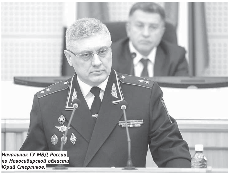
Начальник ГУ МВД России по Новосибирской области Юрий Стерликов.

Более 19 тысяч преступлений было раскрыто (среди них 642 преступления прошлых лет, включая 260 тяжких и особо тяжких). Убийства, причинения тяжкого вреда здоровью и изнасилования практически не остаются нераскрытыми (их показатель раскрываемости — от 96 до 99%). Юрий Стерликов отметил, что улучшилась результативность по раскрытию фактов умышленного причинения тяжкого вреда здоровью, краж с проникновением в жилище и разбойных нападений.