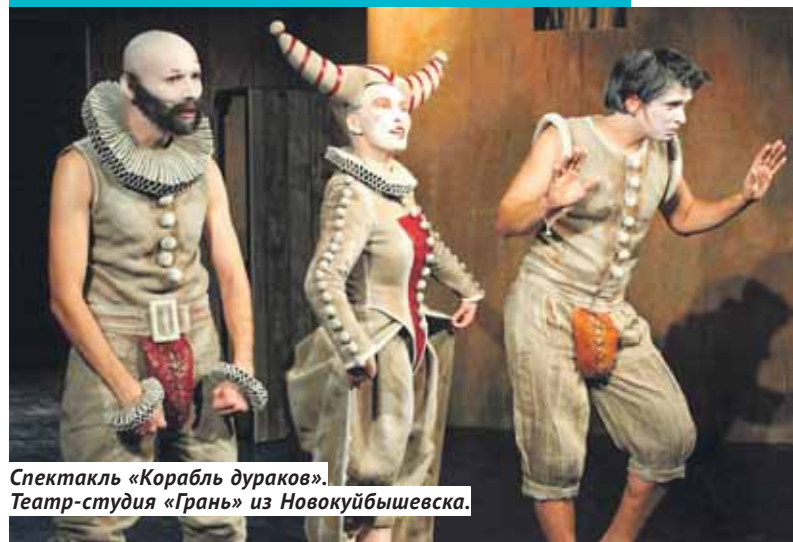
Спектакль «Корабль дураков». Театр-студия «Грань» из Новокуйбышевска.

Новосибирск примет спектакли, отмеченные российской национальной театральной премией-фестивалем «Золотая Маска». С 14 по 21 мая новосибирские зрители увидят постановки, номинированные и ставшие лауреатами в 2016–2018 годах. По два спектакля дадут московские театры — «Мастерская Петра Фоменко» и Театр имени Пушкина. Свои работы также представят театр-студия «Грань» из Новокуйбышевска и Альметьевский татарский государственный драматический театр. Билеты поступили в продажу неделю назад, цены от 300 до 4 000 рублей. Проект носит все-российский характер и входит в программу Года театра. Реализуется он при поддержке Министерства культуры Российской Федерации, Союза театральных деятелей РФ и министерства культуры Новосибирской области. Оператор проекта в Новосибирске — молодёжный театр «Глобус». Показы состоятся также на площадках театров «Красный факел» и «Старый дом».