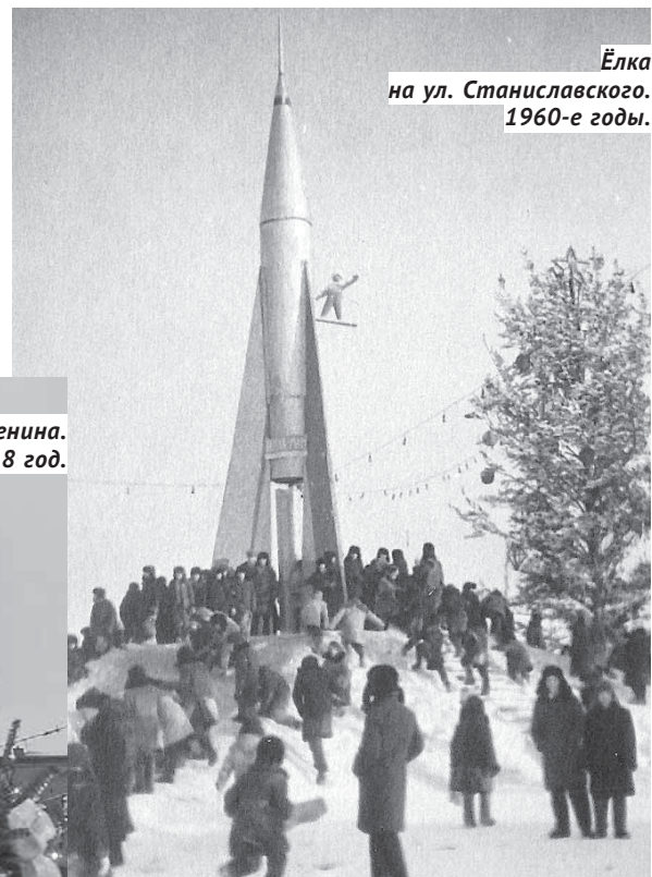
Ёлка на ул. Станиславского. 1960-е годы.

До революции понятия главной ёлки не было. Но детские утренники и спектакли в городе устраивали. И в том числе благотворительные — для детей необеспеченных родителей; один из таких утренников провели в январе 1917 года со спектаклем Золушка, угощением и играми. Мальчишки и девчонки пели пес-