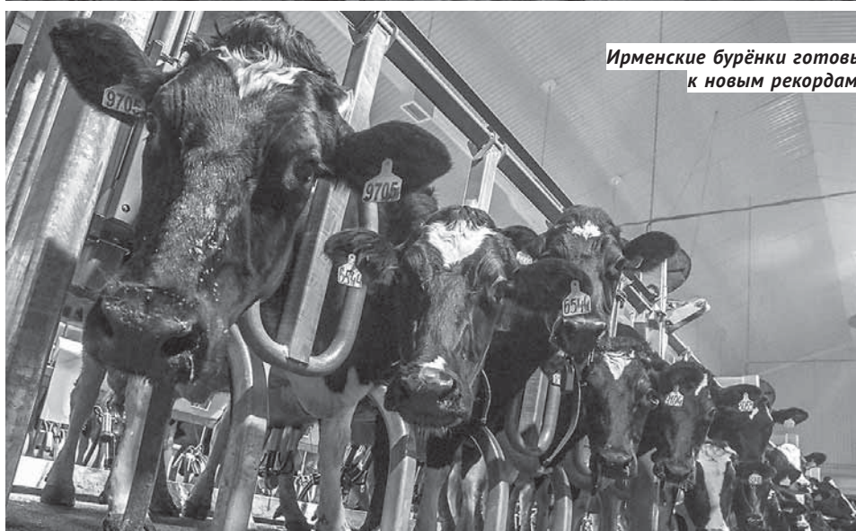
Ирменские бурёнки готовы к новым рекордам.

жением, он наш флагман, ориентир, а мы — областное правительство и Законодательное собрание — в свою очередь продолжим работать над тем, чтобы поддерживать и другие, менее крупные и прибыльные хозяйства, которые сохраняют на своих территориях сельский