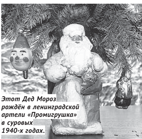
Этот Дед Мороз рождён в ленинградской артели «Промигрушка» в суровых 1940-х годах.

столом и ёлкой, на которой висели золочёные орехи, конфеты, леденцы, пряники, яблоки — дети были в полном восторге! После праздника все сладости ребяташки забирали себе.