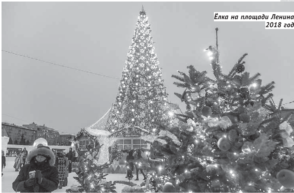
Ёлка на площади Ленина. 2018 год.