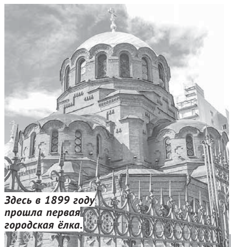
Здесь в 1899 году прошла первая городская ёлка.

В богатых семьях наряжали рождественское дерево. Ёлки тогда продавались на всех базарах города. А ёлочные игрушки были съедобными. Наряжали ёлочку втайне от детей. Когда вечером открывалась комната с праздничным