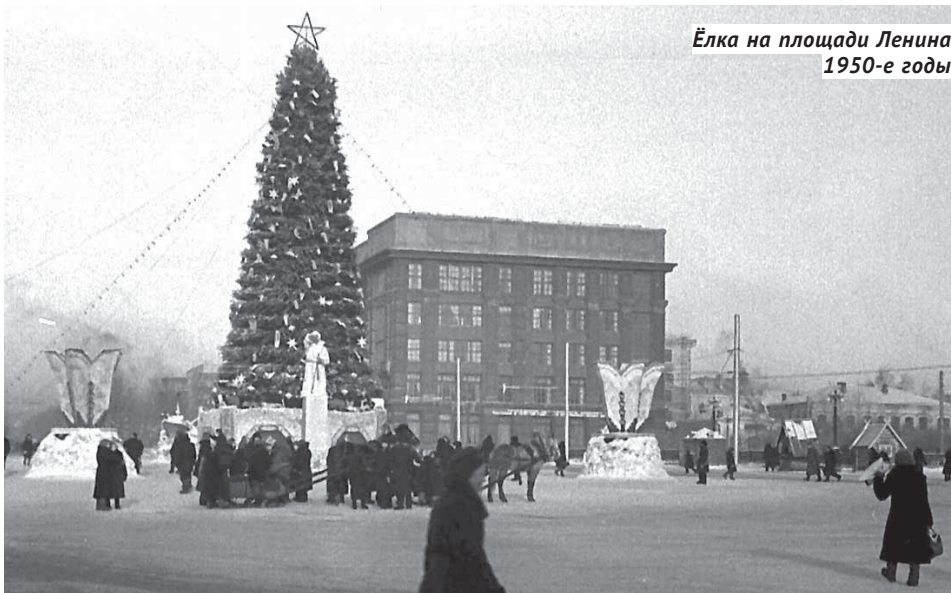
Ёлка на площади Ленина. 1950-е годы.