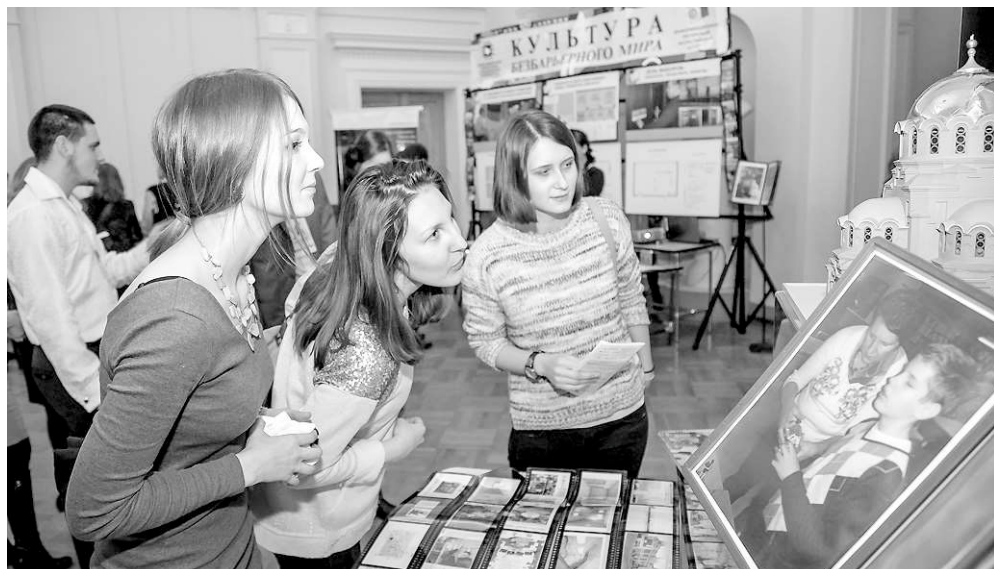
В фойе театра были представлены проекты, которые начали осуществляться в предыдущие годы и будут продолжены в рамках Года культуры.

«Новосибирск — признанная культурная столица Сибири, к нам едут перенимать наш опыт, получить удовольствие от выступлений наших артистов. Уверен, что в течение всего Года культуры все творческие коллективы будут достойно работать для жителей и гостей нашей области».