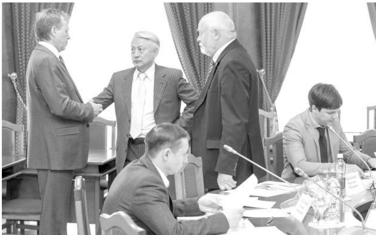
Теперь долгосрочные целевые программы будут утверждаться на уровне правительства, но депутаты Заксобрания намерены активно участвовать в их разработке.