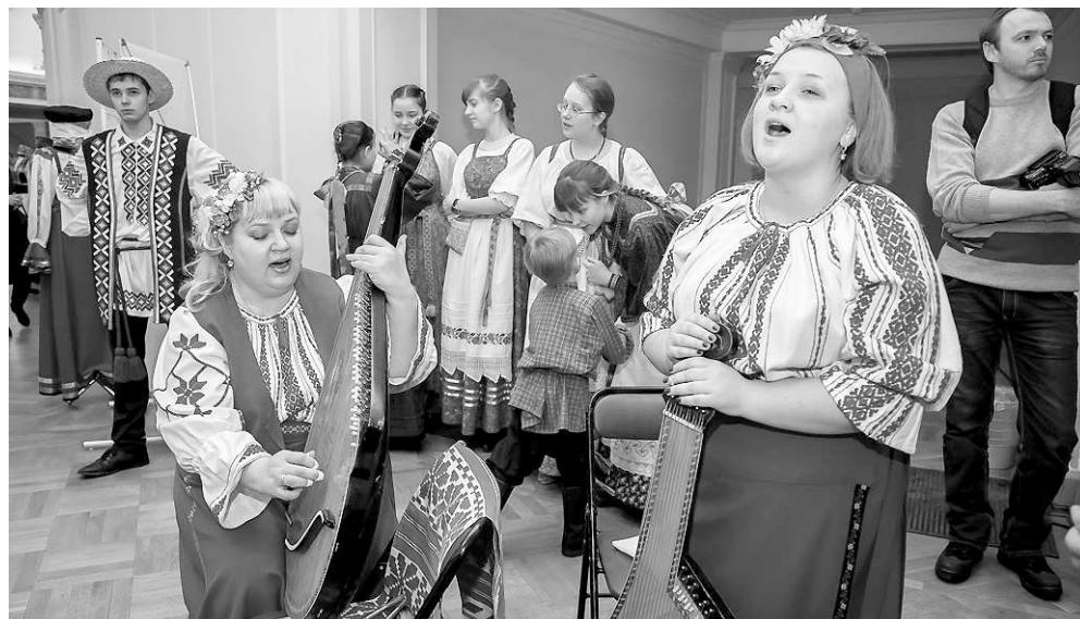
Участниками открытия Года культуры стали представители различных учреждений культуры города и области.