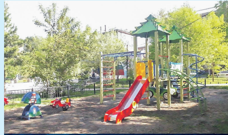
За время созыва на округе №22 были установлены десятки детских игровых площадок. Площадка у дома 266/4 по улице Дуси Ковальчук.