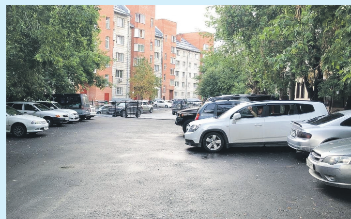
Один из множества заасфальтированных дворов на округе. Улица Аэропорт, 56