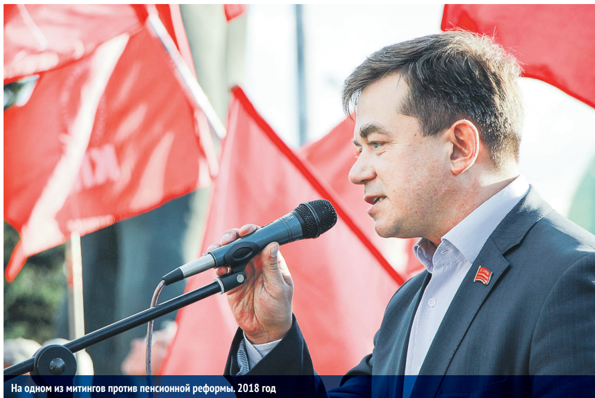
На одном из митингов против пенсионной реформы. 2018 год