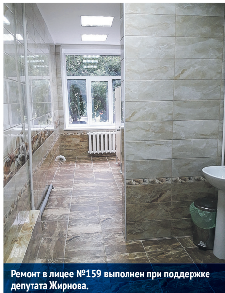
Ремонт в лицее №159 выполнен при поддержке депутата Жирнова.