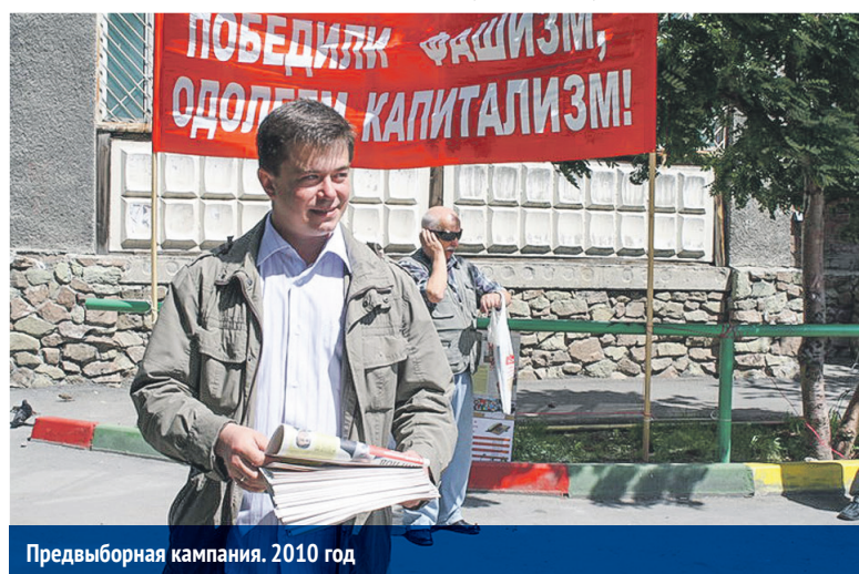
Предвыборная кампания. 2010 год