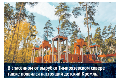
В спасённом от вырубки Тимирязевском сквере также появился настоящий детский Кремль.