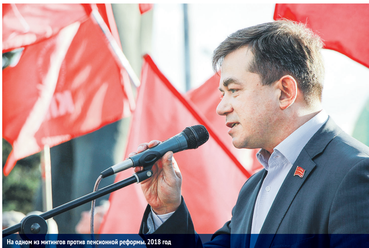
На одном из митингов против пенсионной реформы. 2018 год