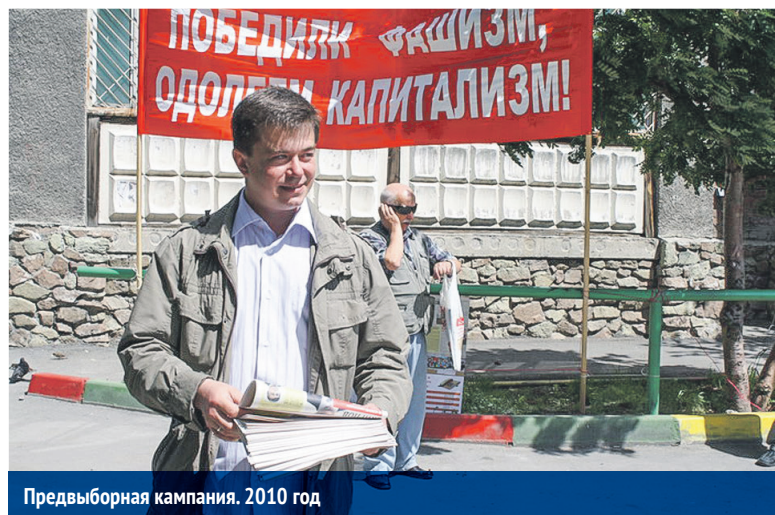
Предвыборная кампания. 2010 год