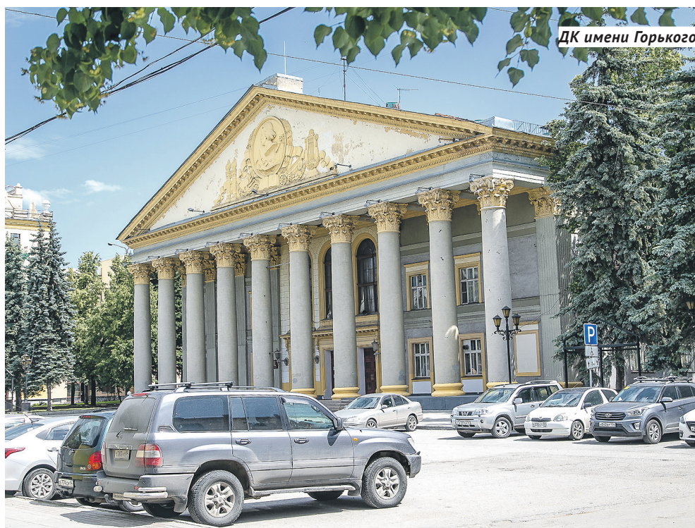
ДК имени Горького