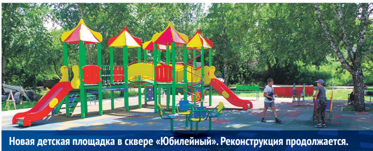
Новая детская площадка в сквере «Юбилейный». Реконструкция продолжается.