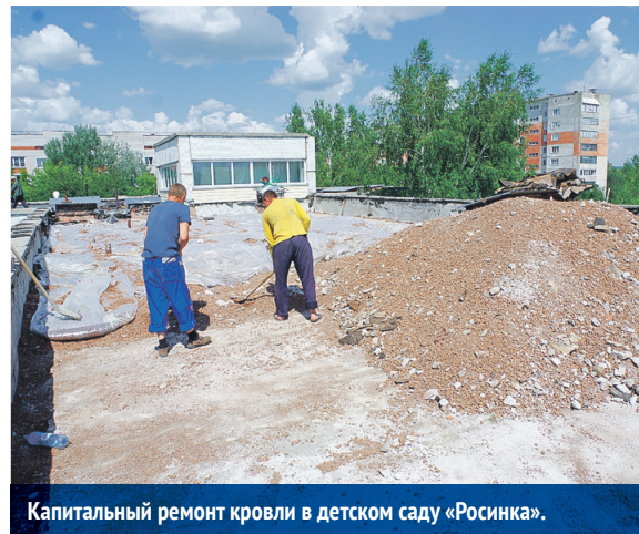
Капитальный ремонт кровли в детском саду «Росинка».