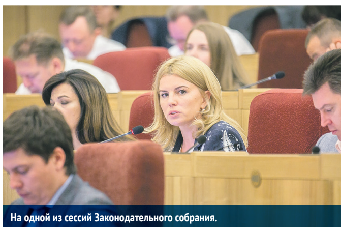
На одной из сессий Законодательного собрания.