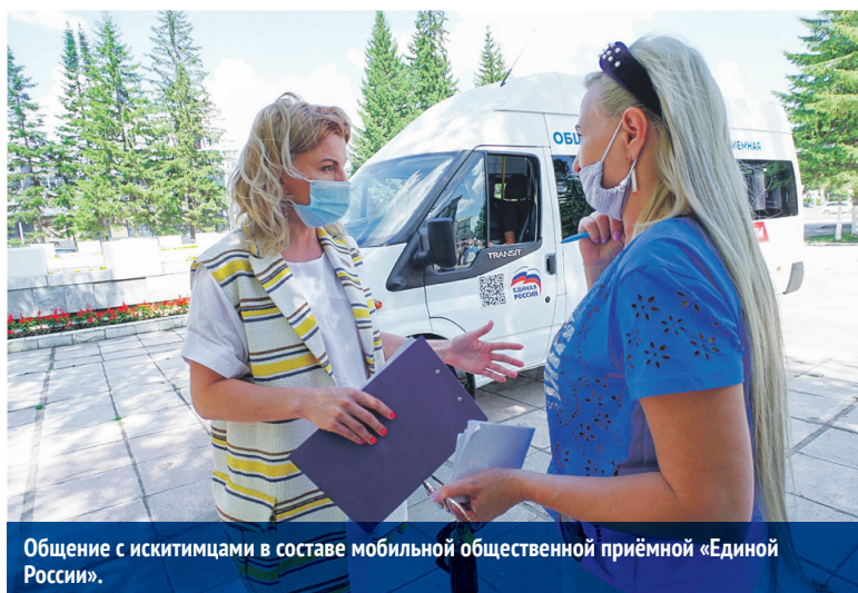
Общение с искимитцами в составе мобильной общественной приёмной «Единой России».

То же самое можно сказать и работе в бюджетном комитете заксобрания. Горожанам в плане работы легче — тут масса возможностей, а во многих сёлах кроме бюджетной сферы и устроиться некуда. Поэтому крайне важно, чтобы здесь появлялся и развивался бизнес, чтобы эта территория становилась дополнительным источником пополнения областного бюджета, а значит, новых дорог, водопроводов, красивых скверов и улиц. Это то, о чём при всех своих расхождениях и особенностях мечтают практически в каждой сельской территории. ●