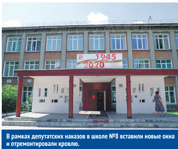
В рамках депутатских наказов в школе №8 вставили новые окна и отремонтировали кровлю.