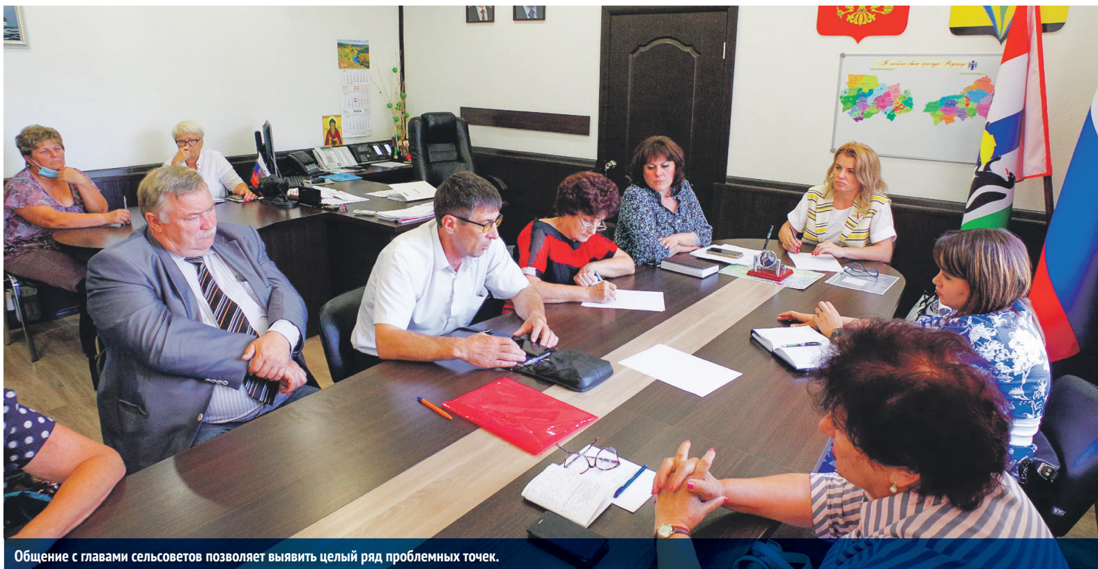
Общение с главами сельсоветов позволяет выявить целый ряд проблемных точек.