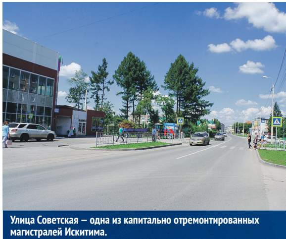
Улица Советская — одна из капитально отремонтированных магистралей Искитима.