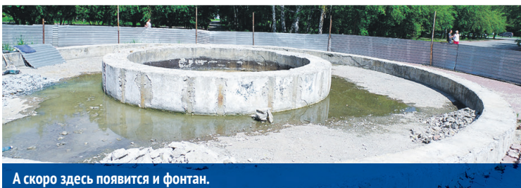
А скоро здесь появится и фонтан.