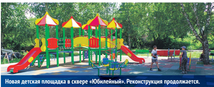
Новая детская площадка в сквере «Юбилейный». Реконструкция продолжается.