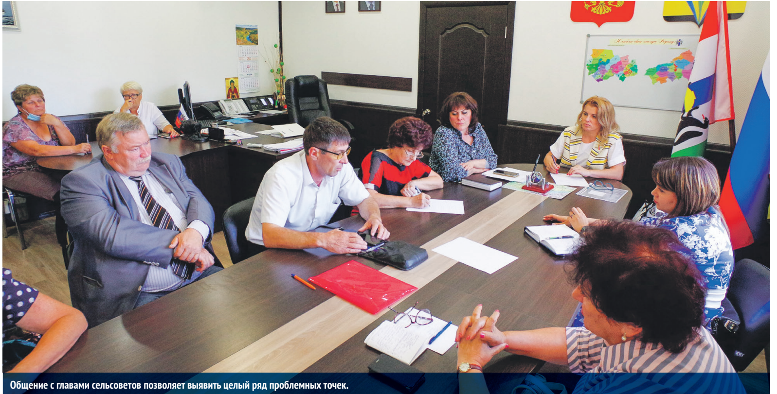
Общение с главами сельсоветов позволяет выявить целый ряд проблемных точек.