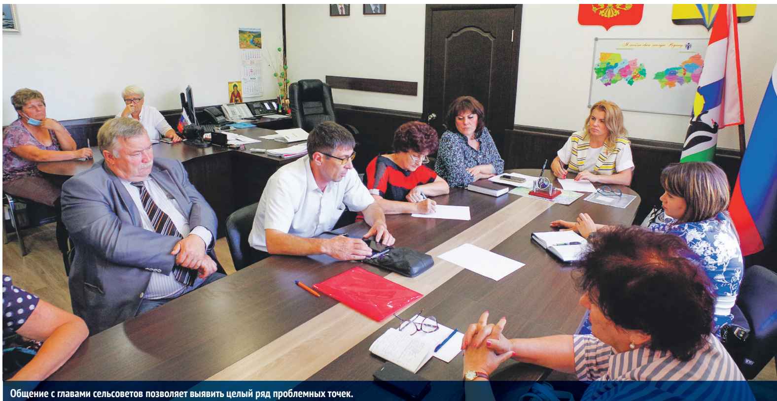
Общение с главами сельсоветов позволяет выявить целый ряд проблемных точек.