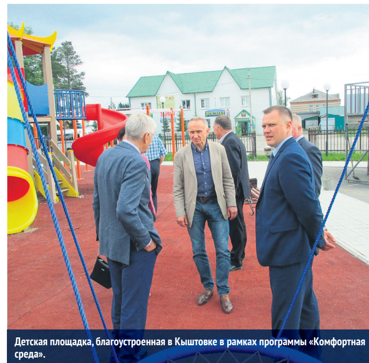
Детская площадка, благоустроенная в Кыштовке в рамках программы «Комфортная среда».