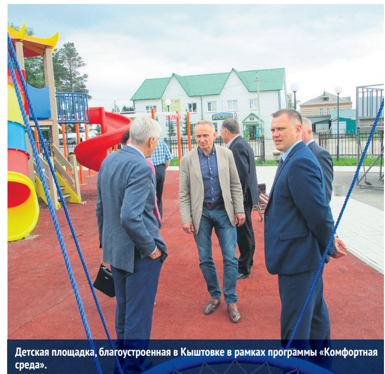
Детская площадка, благоустроенная в Кыштовке в рамках программы «Комфортная среда».