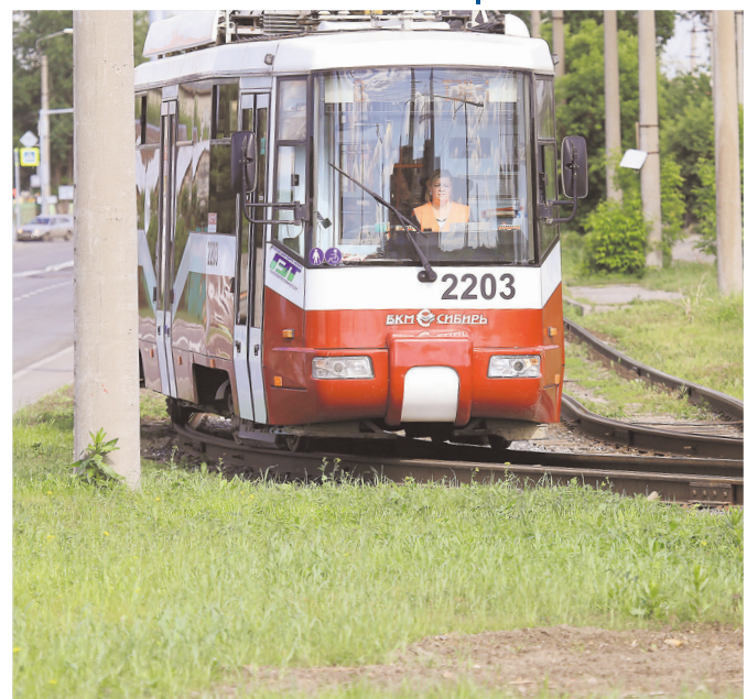
Движение по трамвайной линии на ул. Титова продлили в 2016 году. Сейчас там действуют два маршрута: № 2 «Микрорайон «Чистая Слобода» – М. «Площадь Маркса» и № 8 «Микрорайон «Чистая Слобода» – ТЭЦ-2»