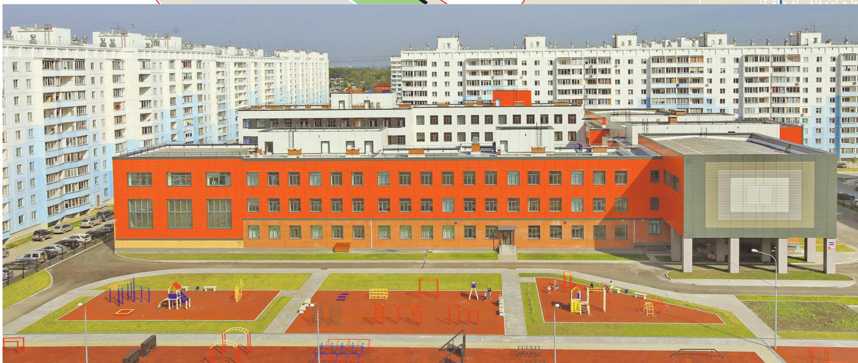
Школа № 215 в «Чистой Слободе» построена в 2018 году — в ней учатся 1100 учеников