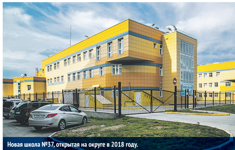
Новая школа №37, открытая на округе в 2018 году.

На открытии депутат Законодательного собрания Лариса Шашукова вручила директору школы Ирине Зайцевой сертификат на