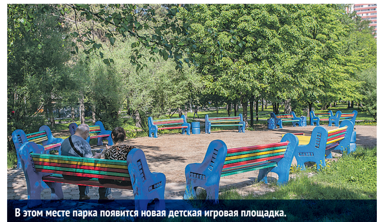
В этом месте парка появится новая детская игровая площадка.

Одну из любимых зелёных зон новосибирцев скоро ждёт преобразование.