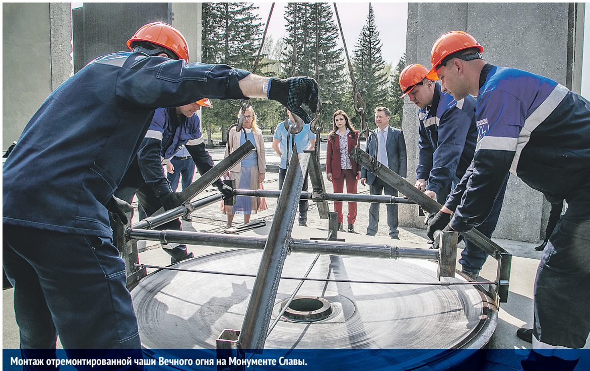
Монтаж отремонтированной чаши Вечного огня на Мемориале Славы.

Ещё одной важной задачей к юбилею являлся капитальный ремонт и реконструкция памятников воинам-сибирякам, погибшим в годы Великой Отечественной войны, расположенных