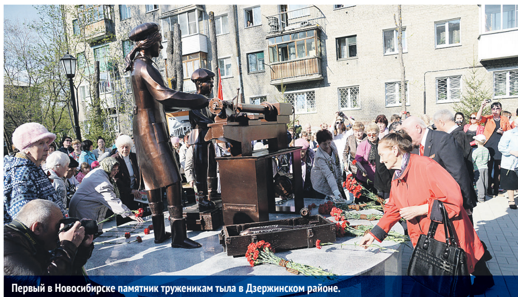
Первый в Новосибирске памятник труженикам тыла в Дзержинском районе.

Новосибирск, безусловно, заслуживает такого высокого звания. Он, кстати, был одним из первых, кто подал заявку. 1 марта вступил в силу федеральный закон об уч-