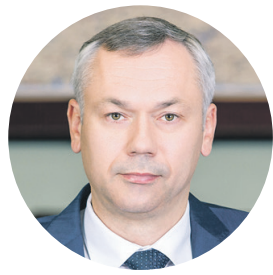
АНДРЕЙ ТРАВНИКОВ губернатор Новосибирской области, секретарь НРО партии «Единая Россия»:

Национальные проекты — это большие возможности для жителей Новосибирской области, которые подкреплены федеральным финансированием. Государство принимает на себя обязательства, но надо понимать, что в каждом конкретном случае внедрение национальных проектов зависит не только от бюджетных «вливаний», но и от нашей исполнительной дисциплины, ответственности, активности каждого, кто будет участвовать в их воплощении.