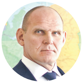
АЛЕКСАНДР КАРЕЛИН депутат Государственной думы, член Высшего совета партии «Единая Россия»:

сельской местности. Идёт планомерная работа по проведению ремонта в сельских домах культуры. В 2019 году отремонтирован Смоленский дом культуры в Мошковском районе, начат ремонт ДК в селе Красный Яр Новосибирского района, в 2020 году работы здесь продолжатся. В планах — капитальный ремонт домов культуры в сёлах Барлак и Сокур Мошковского района, в селе Сосновка Новосибирского района, Емельяновской и Сокурской библиотек.