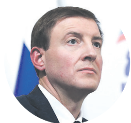
АНДРЕЙ ТУРЧАК заместитель председателя Совета Федерации, секретарь Генерального совета партии «Единая Россия»:

1 150 000 рублей, если первый ребёнок родился после 1 января 2020 года 2 идёт на оплату ипотеки